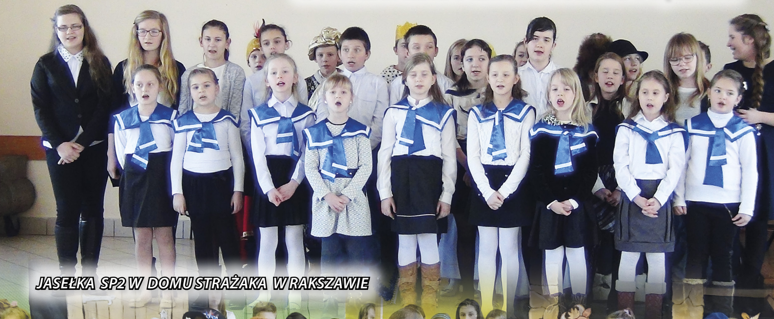
JASEŁKA SP2 W DOMU STRAŻAKA W RAKSZAWIE