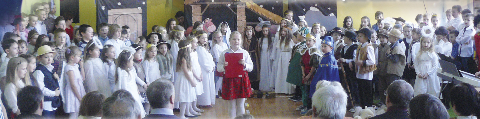
DZIEŃ BABCI I DZIADKA W SZKOLE PODSTAWOWEJ NR 1 W RAKSZAWIE