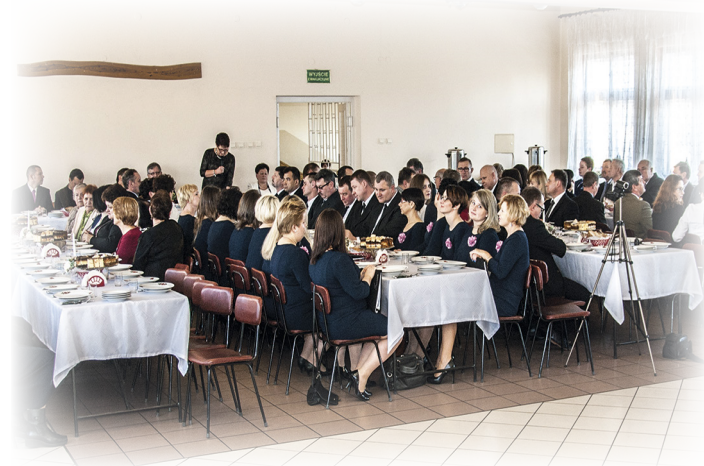
Spotkanie opłatkowe w Domu Strażaka w Rakszawie