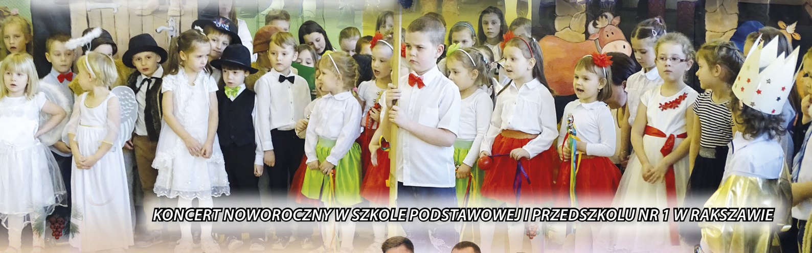
KONCERT NOWOROCZNY W SZKOLE PODSTAWOWEJ I PRZEDSZKOLU NR 1 W RAKSZAWIE