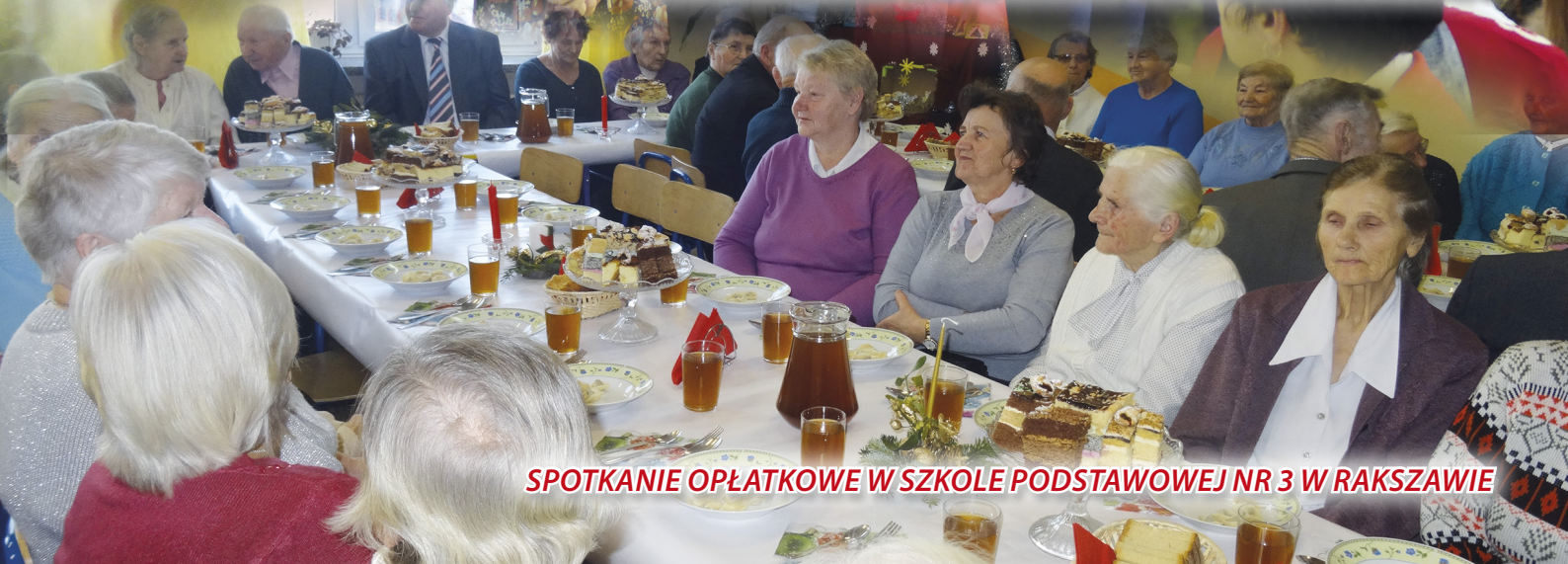
SPOTKANIE OPŁATKOWE W SZKOLE PODSTAWOWEJ NR 3 W RAKSZAWIE