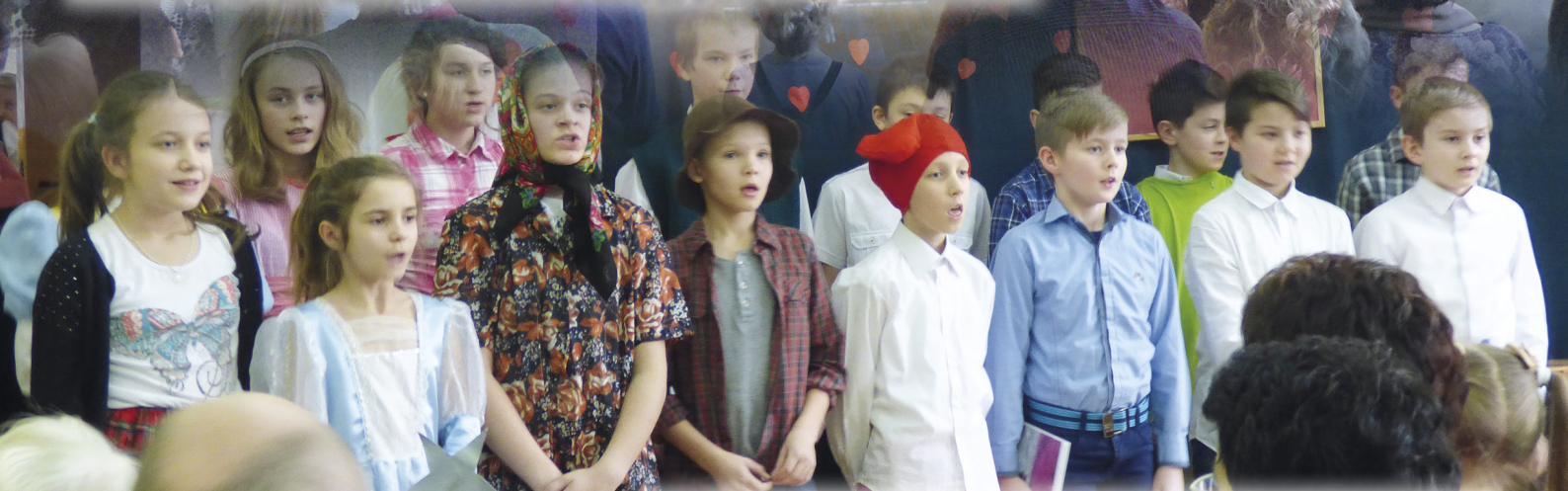
DZIEŃ BABCI I DZIADKA W SZKOLE PODSTAWOWEJ W WYDRZU