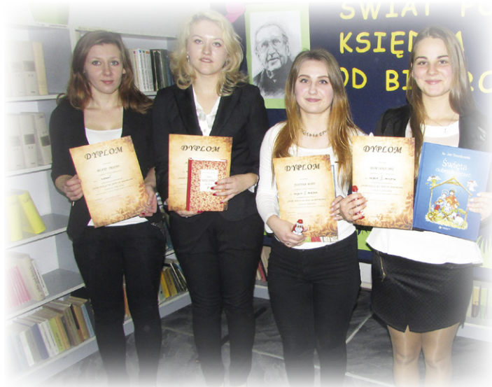
Uczniowie z ZSTG

W dniu 8 grudnia 2015 roku w Zespole Szkół Tekstylno-Gospodarczych odbył się konkurs recytatorski poezji Jana Twardowskiego pt. „Świat poezji Księdza Jana od biedronki” z udziałem uczniów wszystkich szkół z terenu gminy Rakszawa. Głównymi celami konkursu było popularyzowanie twórczości poetyckiej Ks. Jana Twardowskiego w związku z setną roczni-