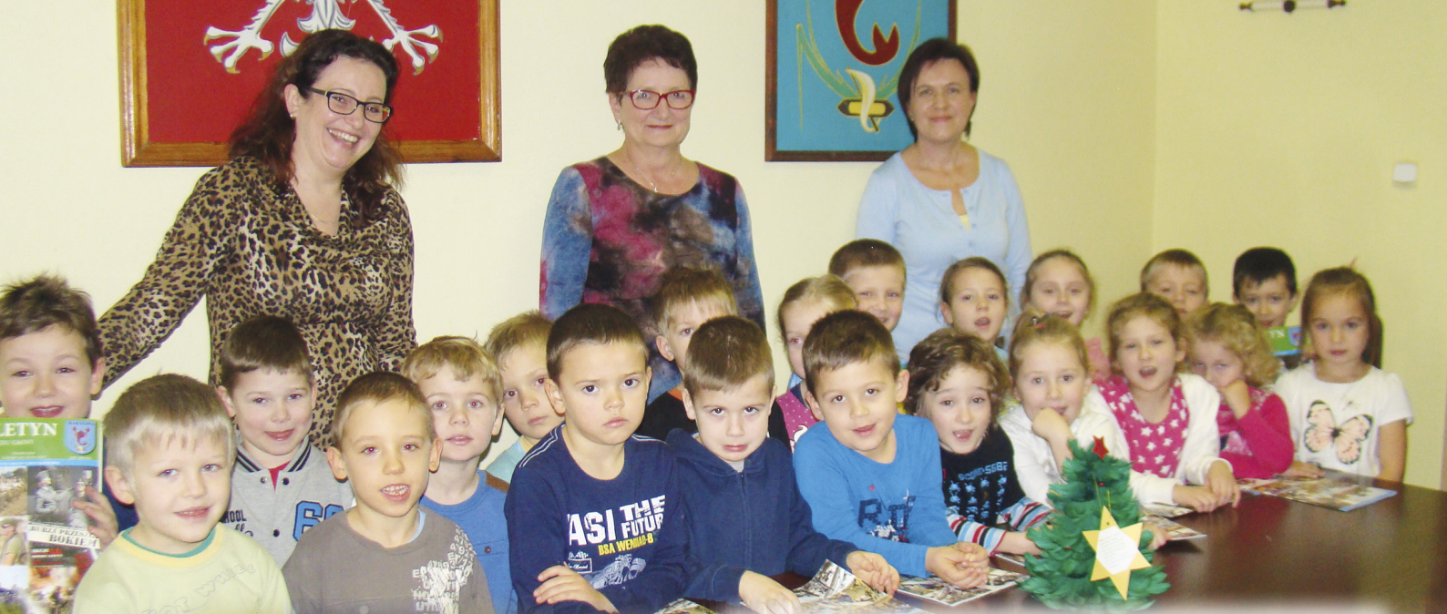
PRZEDSZKOLAKI W URZĘDZIE GMINY W RAKSZAWIE