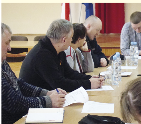
W Urzędzie Gminy w Rakszawie

Na terenie powiatu łańcuckiego odbywają się konsultacje społeczne na temat utworzenia „Map zagrożeń bezpieczeństwa”. Funkcjonariusze policji rozmawiają z przedstawicielami społeczności lokalnej o tym, jakie zagrożenia występują w ich sąsiedztwie i jak im przeciwdziałać.