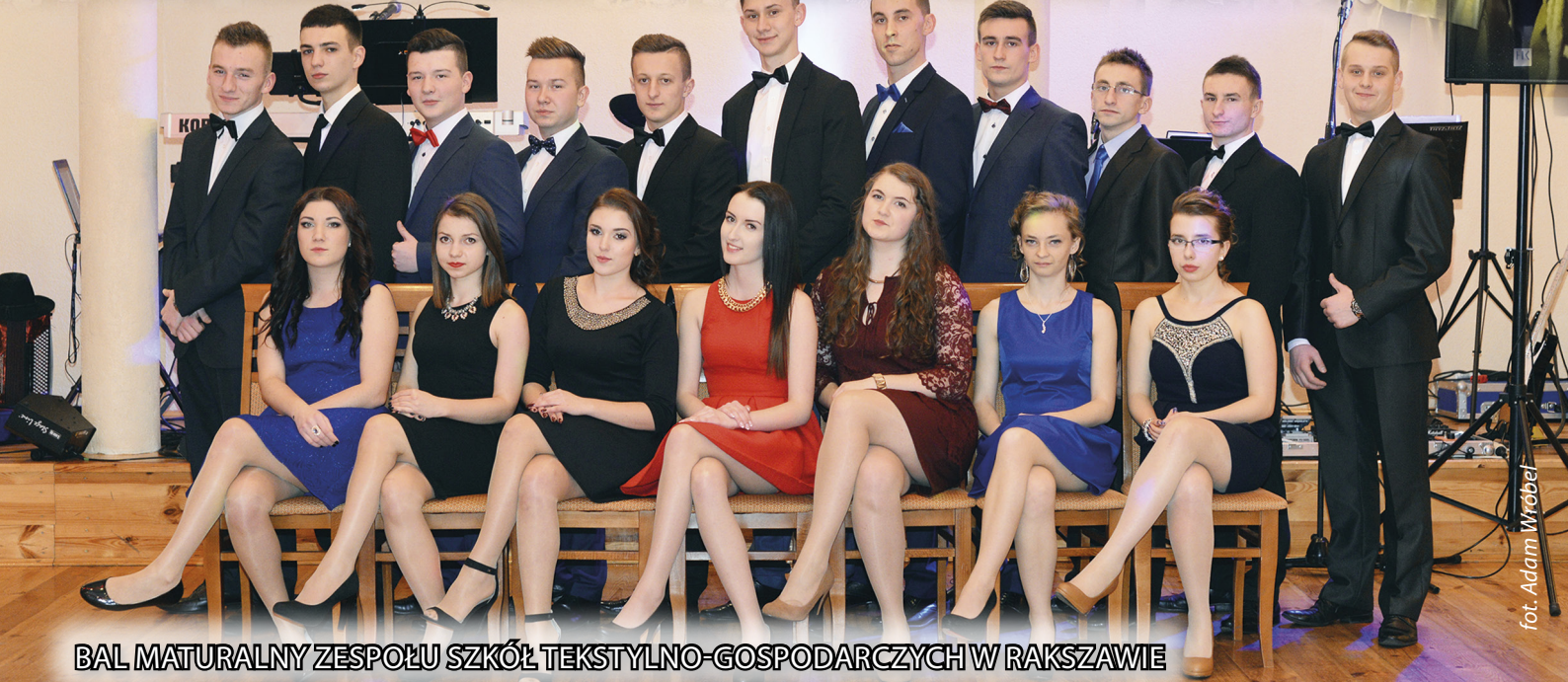
BAL MATURALNY ZESPOŁU SZKÓŁ TEKSTYLNO-GOSPODARCZYCH W RAKSZAWIE