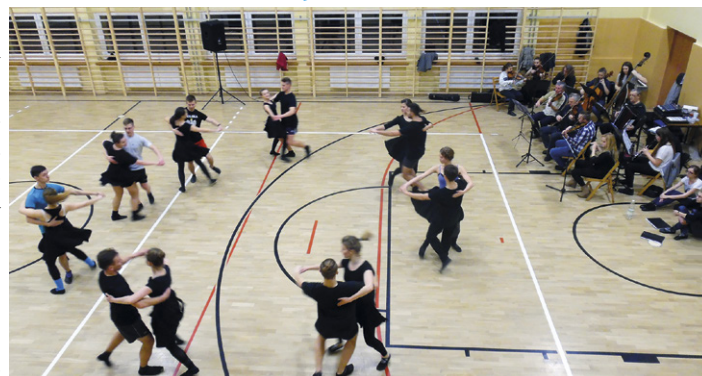
Warsztaty w ZSTG