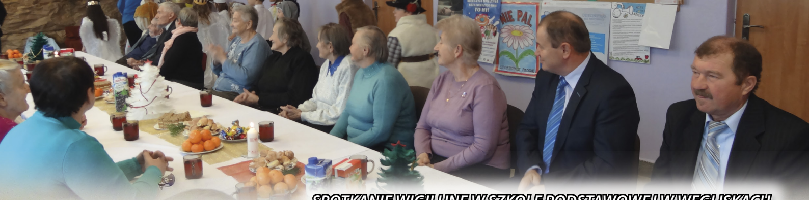
SPOTKANIE WIGILIJNE W SZKOLE PODSTAWOWEJ W WĘGLISKACH