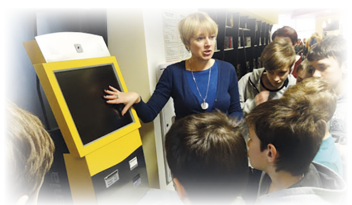
Miejska Biblioteka Publiczna w Jarosławiu

temat wpływu czytania na rozwój dziecka. Wszystkie te działania sprawiają, że czytelnictwo w szkolnych bibliotekach w porównaniu z I semestrem wzrosło.