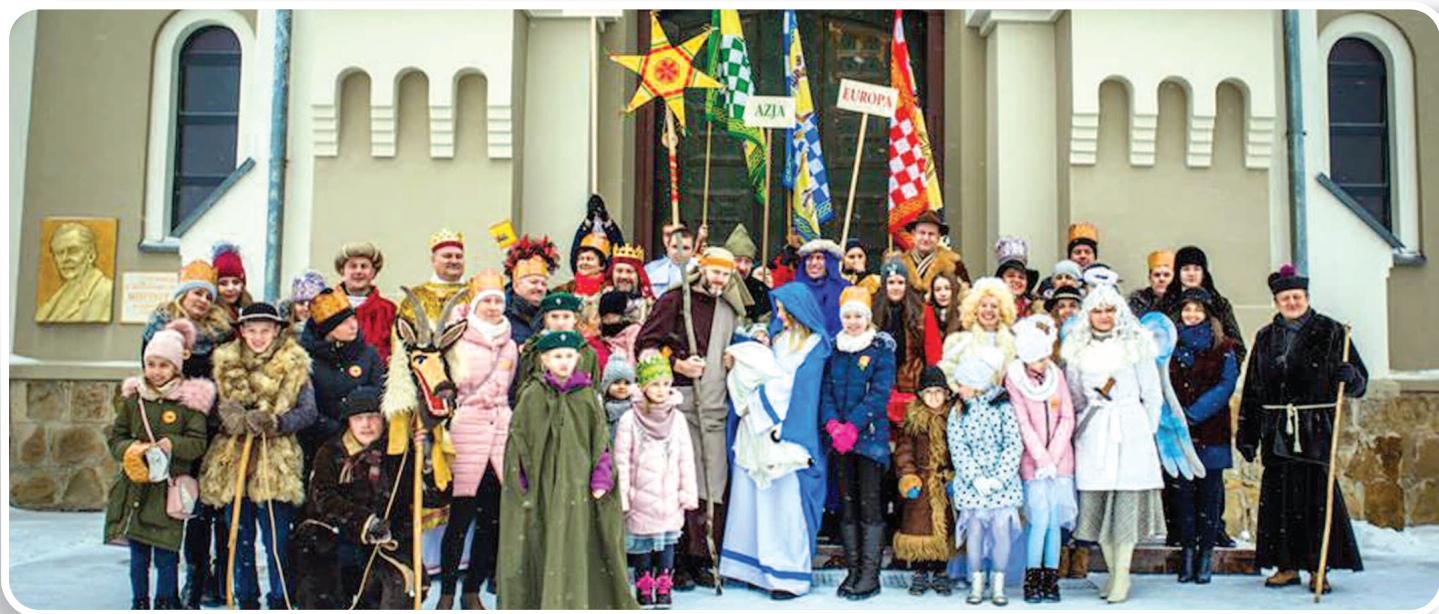
6 stycznia 2019 r., Orszak Trzech Króli, fot. Lucyna Domka.