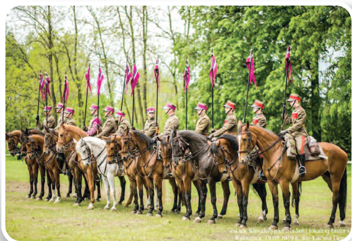
19 maja 2019 r., Piknik Kawaleryjski. Śladami Lokalnej Historii