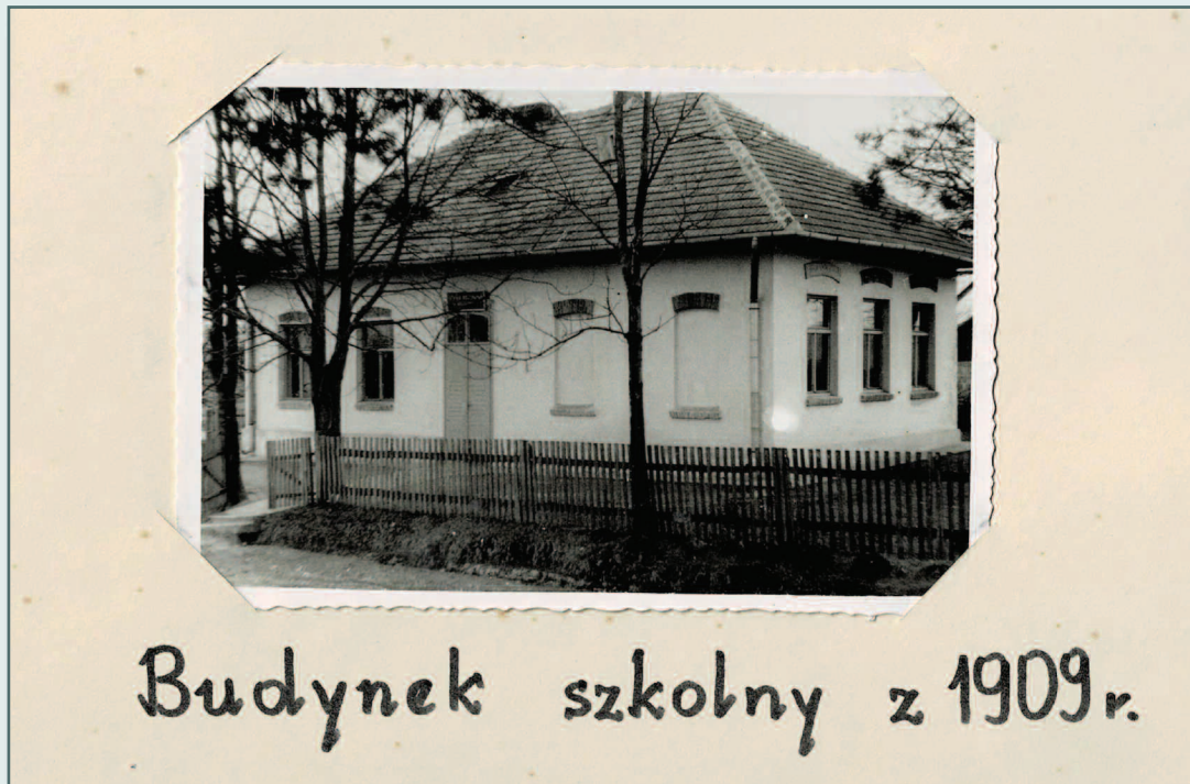
Budynek szkolny z 1909 r.