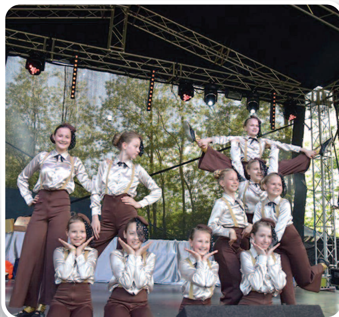
2 czerwca 2019 r., VII Rakszawski Ćwierćmaraton im. Jana Pawła II