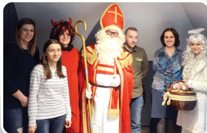
6 grudnia 2019 r., odwiedziny św. Mikołaja