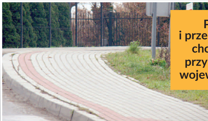
Pasy i przedłużenie chodnika przy drodze wojewódzkiej