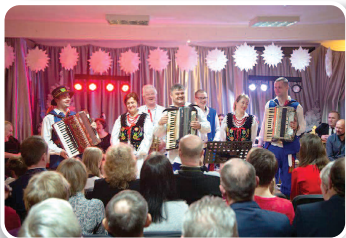
1 lutego 2019 r., Koncert Kolęd w Węgliskach, fot. Peter Firus