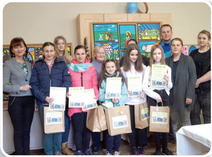
12 kwietnia 2019 r., XVII Gminny Konkurs Wielkanocny