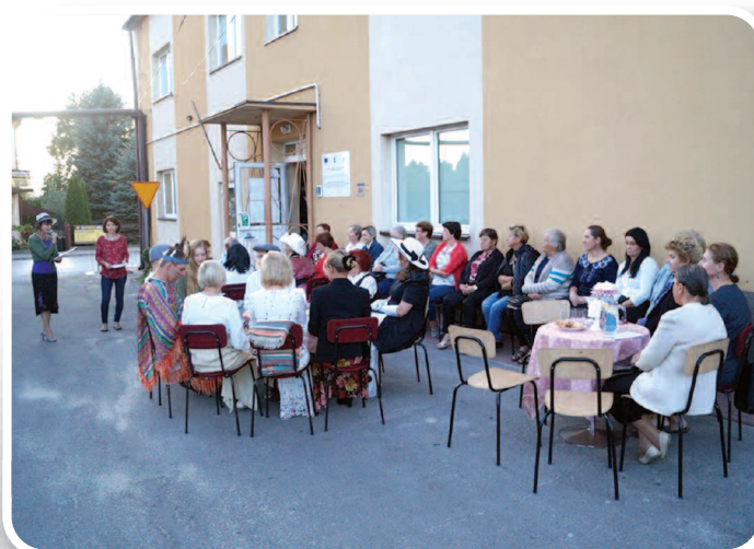
10 września 2019 r., VII Narodowe Czytanie