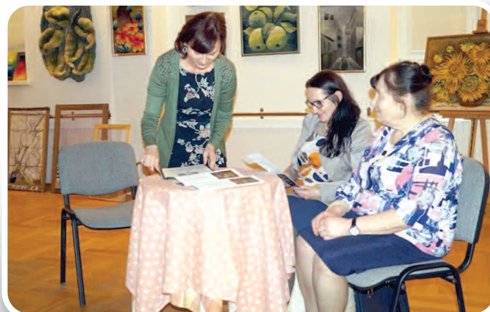
Wernisaż wystawy malarstwa i tkaniny artystycznej Wspólne pasje