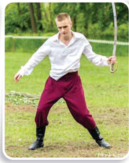
19 maja 2019 r., Piknik Kawaleryjski. Śladami Lokalnej Historii