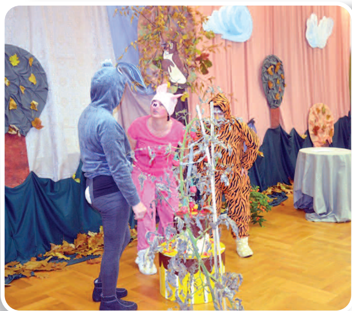
17-18 października 2019 r., Urodziny Kubusia Puchatka