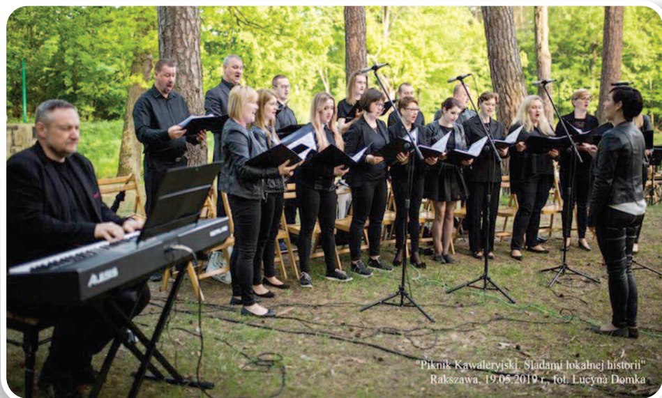
19 maja 2019 r., Piknik Kawaleryjski. Śladami Lokalnej Historii