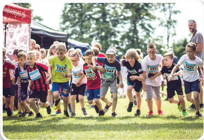
2 czerwca 2019 r., VII Rakszawski Ćwierćmaraton im. Jana Pawła II