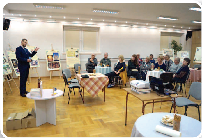
13-21 maja 2019 r., XVI Ogólnopolski Tydzień Bibliotek