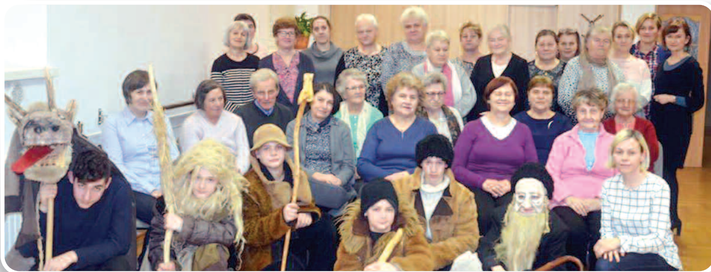
30 stycznia 2019 r., Spotkanie z kolędnikami, fot. Jan Jabłoński