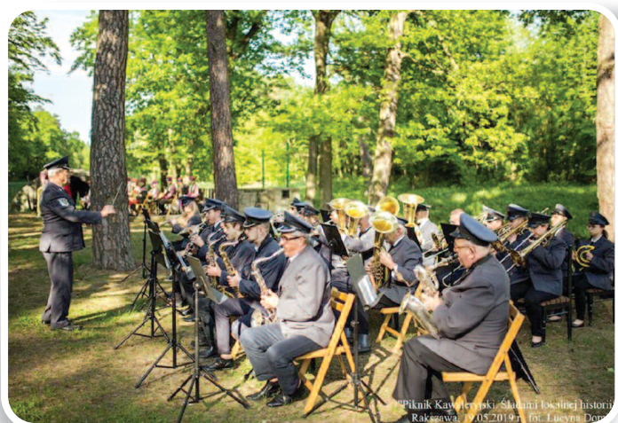
19 maja 2019 r., Piknik Kawaleryjski. Śladami Lokalnej Historii