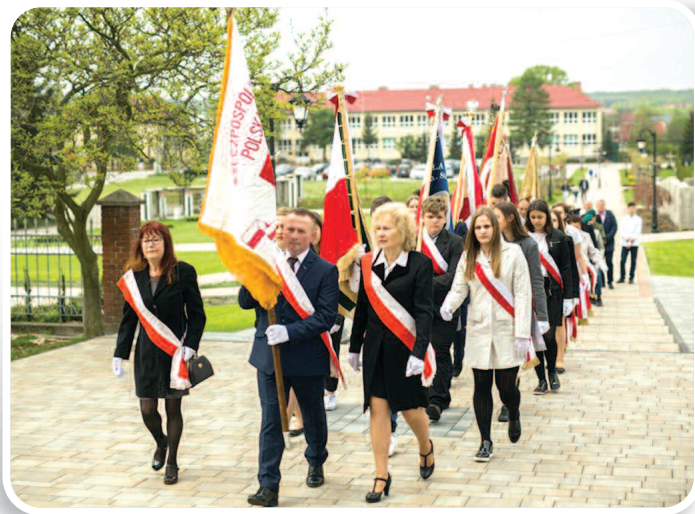
3 maja 2019 r., Obchody Święta 3 Maja, fot. Lucyna Domka