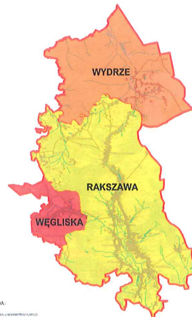
Rys.1: Położenie miejscowości Węgliska na tle mapy Polski i Gminy Rakszawa