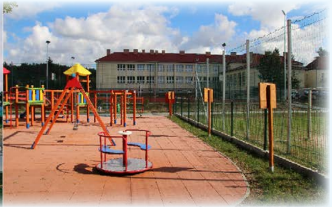
II miejsce Łukasz Frączek