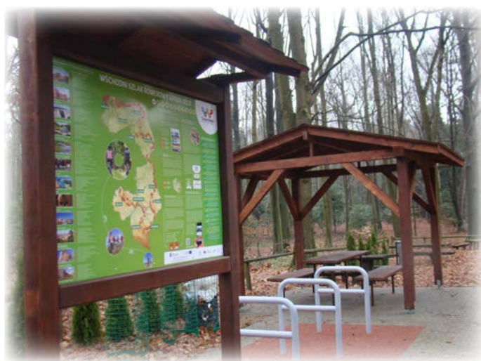
Miejsce Obsługi Rowerzystów przy Pałacyku Myśliwskim w Julinie.