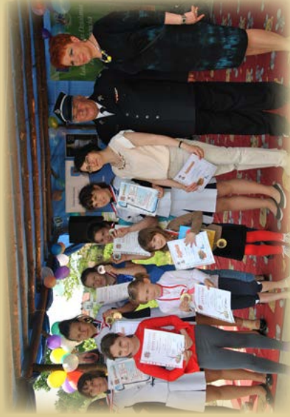
Festyn Rodzinny „Powitanie Lata”

Konkurs pięknego czytania dla uczniów szkół podstawowych naszej gminy połączony z prezentacją ulubionej książki – Publiczne Gimnazjum w Rakszawie Spotkanie wielkanocne - KGW Rakszawa Środkowa Gminny Konkurs Muzyczny „DO RE MI” - GOKiC Gminny Turniej Wiedzy o Janie Pawle II i konkurs plastyczny „Jan Paweł II widziany oczami dzieci?” - SP w Węgliskach Gminny Konkurs logicznego myślenia „Super Główka” - ZSPiP nr 1 w Rakszawie Zawody Wędkarskie o Puchar Prezesa Koła - Koło Wędkarskie „Rak 24” w Rakszawie Premiera spektaklu pt. „Requiem dla gospodyni” — w wykonaniu Teatru „Siolo” z Gminnego Ośrodka Kultury i Czytelnictwa w Rakszawie