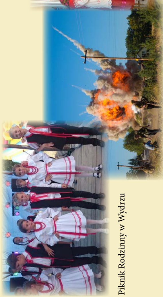
Piknik Rodzinny w Wydrzu

Warsztaty Archeologii Doświadczalnej w Osadzie Rakszawa (piecowisko hutnicze - pokaz starożytnej metalurgii żelaza, pionowy warsztat tkacki - pokaz tkactwa, dzieje pisma - od piktogramów do średniowiecznych rękopisów, czerpanie papieru, warzenie jadal, bednarstwo- sposób wyrabiania naczyń klepkowych, plecionkarstwo) – GOKiC