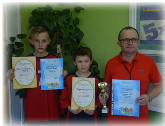
Tabela końcowa zawodów : IMS Mini Piłka Ręczna Chłopców – gmina Rakszawa