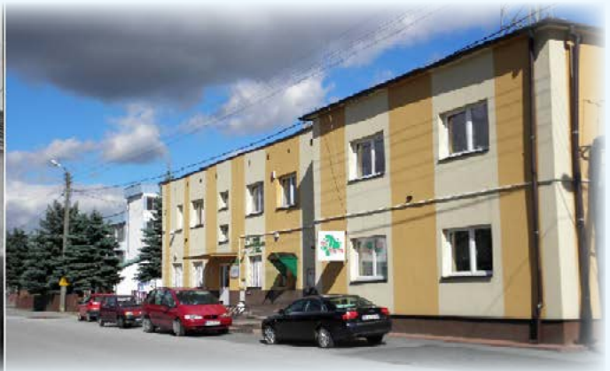
III miejsce Bogumiła Babiarcz