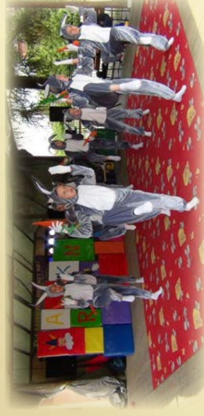
Festyn Rodzinny „Mama, Tata, Ja i ...”

Obchody Święta 3 Maja - GOKiC/Gmina Rakszawa Gminny Konkurs na Najaktywniejszego Czytelnika 2015 r. - GOKiC Gminny Konkurs Czytelniczy dla dzieci szkół podstawowych - GOKiC Gminny Konkurs Matematyczny dla klas III - SP Wydrze Gminny Konkurs Ortograficzny - SP nr 2 w Rakszawie Gminny Konkurs Wiedzy Zintegrowanej - SP nr 2 w Rakszawie Gminny Konkurs Poetycko-Literacki - GOKiC Akcja „Cała Polska czyta dzieciom” - GOKiC Spotkania miłośników książek - GOKiC Ruszaj z kijem w trasę - GOKiC Gminne Obchody Dnia Strażaka - OSP Rakszawa Festyn Rodzinny (22.05) - SP nr 2 w Rakszawie Gminny Dzień Matki - KGW Rakszawa Środkowa Rakszawskie Święto Teatrów im. Zenony Turskiej — Publiczne Gimnazjum w Rakszawie Rakszawski Ćwierćmaraton im. Jana Pawła II - Publiczne Gimnazjum w Rakszawie