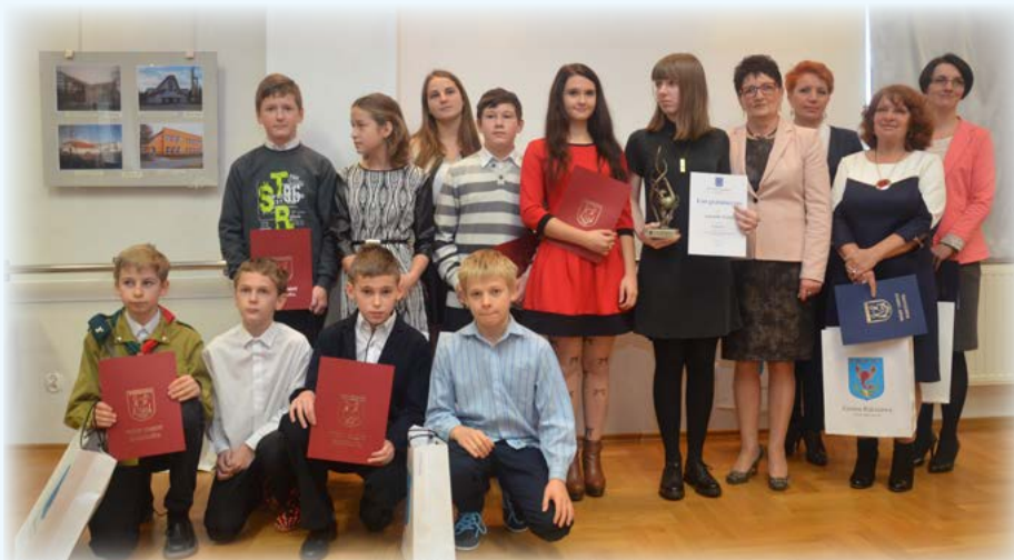
Nagrodzeni w Konkursie Literackim pt. „Dusza mojej małej ojczyzny-moja miejscowość, Gmina i jej Patron”