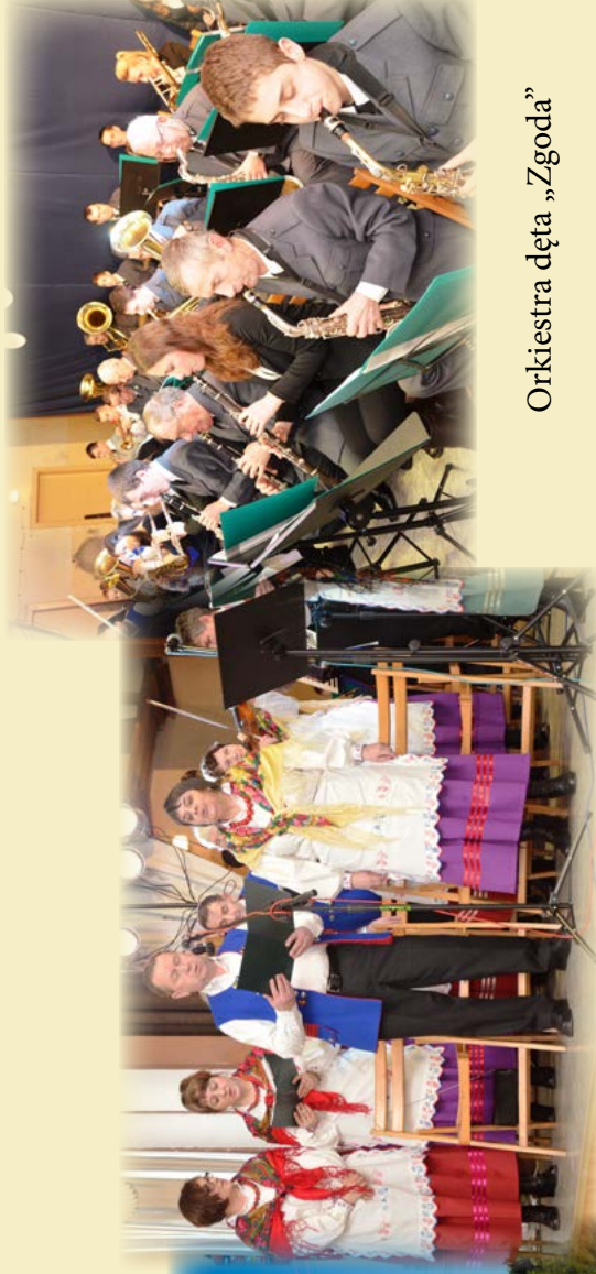
Zespół śpiewaczy „Brzeziny”

Mikołajki – GOKiC Turniej Mikołajkowy Dwojek Siatkarskich (rodzic-dziecko) -TKF Rakszawa Gminny Konkurs Bożonarodzeniowy – GOKiC Warsztaty Florystyczne – GOKiC Kiermasz Bożonarodzeniowy – GOKiC II Gminny Konkurs Recytatorsko-Literacki - ZSTG w Rakszawie Wigilia dla samotnych - Szkoła Podstawowa w Węgliskach