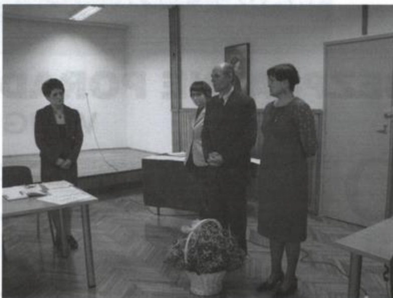
Fot: XXXV Sesja Rady Gminy w Rakszawie.