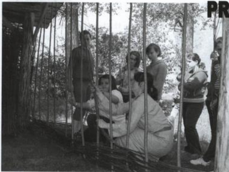
Fot: Goście z Brzoźy Stadnickiej i ze Słowacji – wypłacanie ściany

O tym, że Osada Rakszawa jest atrakcją turystyczną naszej gminy GOKiC mógł przekonać się w maju i czerwcu br. Utworzona przez GOKiC w 2009r. prehistoryczna osada, usytuowana nad rzeką Młynówką za firmą Remix Sp.z o.o. przyciąga turystów spoza Rakszawy. Już na początku maja w dniach 9 – 10 maja 2010r. w Osadzie Rakszawa gościliśmy grupę uczniów ze Szkoły Podstawowej w Brzoźy Stadnickiej oraz ich gości ze Słowacji. Biorącym udział w wymianie dzieciom zorganizowaliśmy zabawę „Wyzwoliny na ucznia mistrza”, na którą złożyły się warsztaty archeologii doświadczalnej.