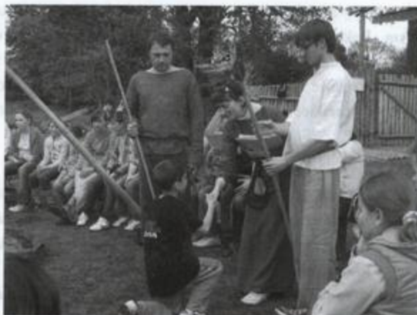
Fot: Goście z Brzoźy Stadnickiej i ze Słowacji – uroczyste wyzwoliny

Opr. Agnieszka Rzepka Dyrektor Gminnego Ośrodka Kultury i Czytelnictwa w Rakiszewie