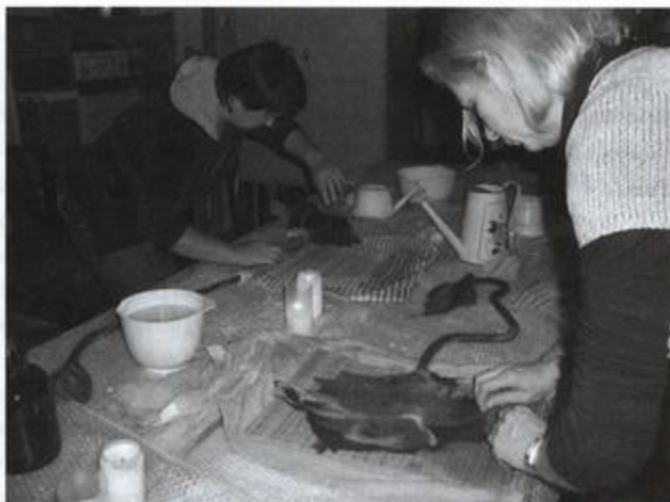
Fot: Kurs filcowania wełny w Gminnym Ośrodku Kultury i Czytelnictwa w Rakszawie.