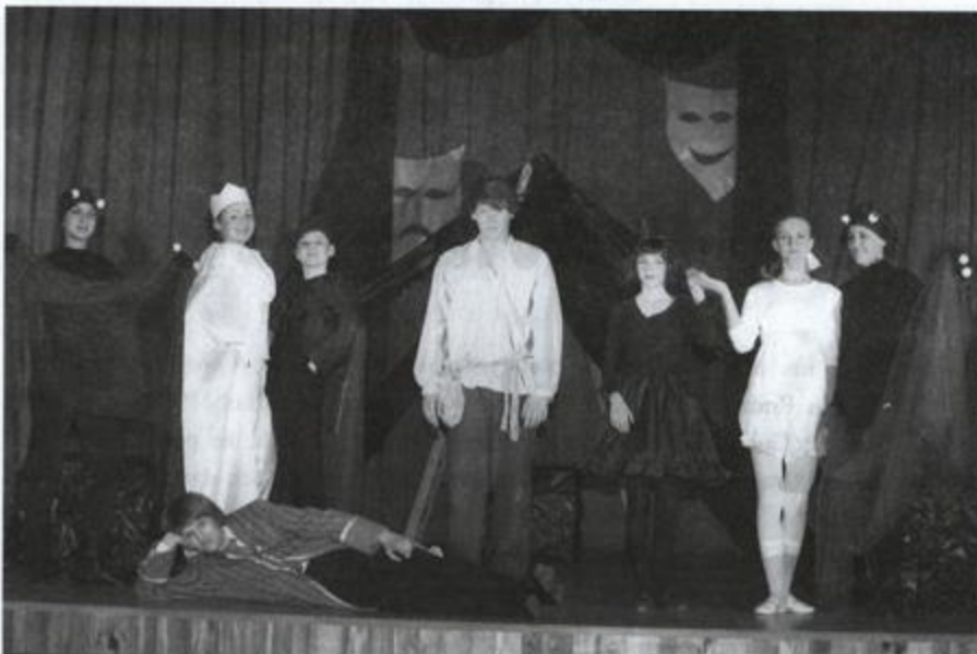
Fot: Aktorzy Gimnazjum w Rakszawie w spektaklu Osma Góra - Laureaci Przeglądu.

Ponadto gościliśmy zespół ze Szkoły Podstawowa Nr 3 w Rakszawie. Uczniowie pod okiem pani Beaty Babiarcz w pięknych dekoracjach przedstawili barwną sztukę pt. Świnio-pas autorstwa pani Teresy Rupa, kreując w niej świat życia dworskiego.