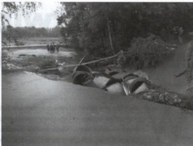
Fot. Zerwany most w miejscowości Wydrze.

W ójt Gminy Rakszawa składa serdeczne podziękowania wszystkim mieszkańcom i strażakom za pomoc w usuwaniu skutków powodzi i ulewy, a także dyrektorom szkół z terenu Gminy Rakszawa, którzy włączyli się w zbiórkę darów dla Powodźian.