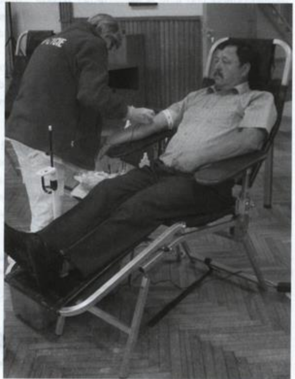
Fot. Akcja Krwiodawstwa w Rakszawie.

P omimo ogromnego postępu medycyny, dotąd nie udało się wytworzyć substancji, która w pełni zastąpiłaby ludzką krew. Krew jest niezbędna w wielu sytuacjach np.: dla poszkodowanych w wypadkach komunikacyjnych, przy wielu operacjach, przy przeszczepach narządów. Problemy z krwią są w każde wakacje. Sprzyjają temu masowe podróże ludzi, a co za tym idzie zwiększona liczba wypadków, po których potrzebna jest transfuzja. Dodatkowo większość regularnie oddających krew też jest na urlopiach. Dlatego każda kropla Twojej krwi jest na wagę złota.