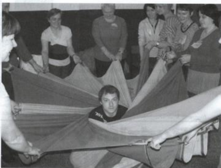
Fot: Zabawy z chustą animacyjną, fot. Magdalena Stręk -Pióro.

W październiku 2010r. odbędzie się kurs animatora turystycznego. Podsumowanie projektu nastąpi podczas biesiady w Osadzie Rakaszawa. Wszystkie w/w działania skierowane są do członków organizacji pozarządowych, Kół Gospodyń Wiejskich, instytucji, szkół, osób indywidualnych mieszkających i pracujących na terenie Gminy Rakaszawa. Każdy uczestnik otrzyma zaświadczenie ukończenia kursu oraz środki i materiały dydaktyczne. Wszystkie zajęcia są bezpłatne. Serdecznie wszystkich zapraszamy i zachęcamy do wzięcia udziału w proponowanych szkoleniach.