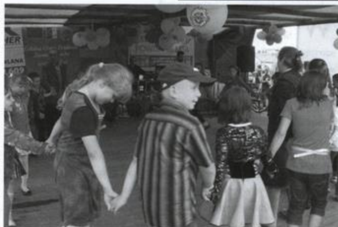
Fot: Zabawa z Wodzirejem

Tegoroczny festyn nie byłby możliwy bez ogromnego wkładu pracy i zaangażowania uczniów, rodziców i nauczycieli.