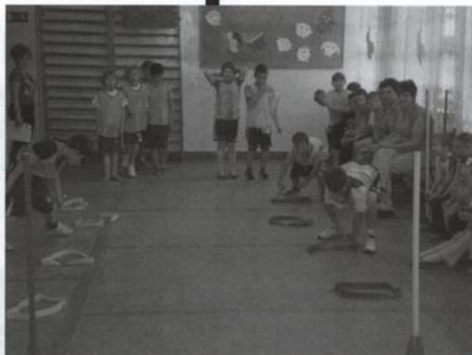
Fot: Bieg z przeszkodami w Szkole Podstawowej w Węgliskach