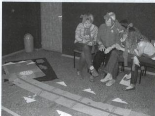
Fot: Warsztaty z pedagogiki zabawy, fot. Magdalena Stręk -Pióro.

Od 29 czerwca br. rozpoczynają się warsztaty tkackie, które zapoznają grupę z podstawowymi technikami tkackimi jak również bardziej rozbudowanymi technikami splotów: splot płócienny, gobelin, sumak czy brosz. Zajęcia będą poszerzone o zasady tworzenia projektów tkackich jak i możliwościami wykorzystania innych materiałów takich jak: bibuła, papier, folia itp. Cykl szkoleniowy obejmuje 50 godzin. Kolejne warsztaty dotyczą dziedzictwa kulinarnego i przeprowadzone będą na przełomie sierpnia i września br. również w liczbie 50 godzin.