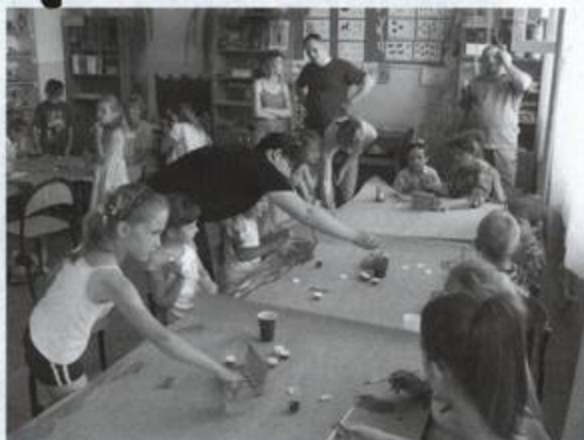
Fot: Uczestnicy konkursu plastycznego „Szczęśliwy człowiek i zwierzę”

Dla uczniów klas 4-6 przygotowane były następujące konkursy: kanapkowy „Smacznie, zdrowo, kolorowo”, z języka angielskiego „Moja mama zna angielski”, plastyczny „Szczęśliwy człowiek i zwierzę”, muzyczny „Jaka to melodia?”. Umiejętności sportowe dzieci prezentowały w rozgrywkach piłki nożnej i siatkowej, rzutach ringo, w grze badmintonu. W strzałach do bramki dzieci zaprezentowały się w nowych strojach sportowych z logo szkoły. Dużą popularnością cieszył się mini konkurs piłki nożnej „Piłkarzyki”.