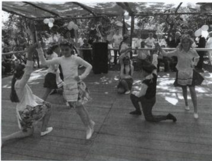
Fot: Występ „Lasowiaczków” ze Szkoły Podstawowej w Wydrzu

Rodzice zadbali o część kulinarną całej imprezy. Można było kupić smaczne ciasto, gofry, frytki, lody, napoje chłodzące, zjeść pieczoną kielbasę.