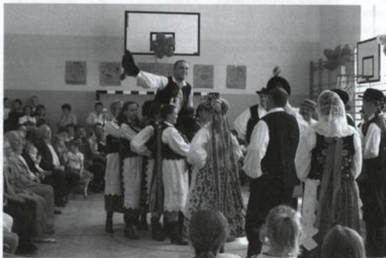
Fot: „Wesele Krzemienickie” - inscenizacja wesela wiejskiego z okolic Łańcuta z XIX wieku.

H ura mamy festyn! – tak cieszyliśmy się, gdy dotarła do nas wiadomość, że w naszej szkole odbędzie się taka uroczystość. Przygotowania zaczęły się znacznie wcześniej – a to trzeba było wymyślić nazwę imprezy, a to ustalić jej przebieg, pomyśleć o zaproszeniach, ważne było także menu, no i liczenie, liczenie,... – czy zmieścimy się w kosztach. Właściwe osoby tym właśnie się zajęły i dopięły wszystko w odpowiednim czasie na ostatni guzik, no i oczywiście z fasonem. „Zielone świątki” godz. 14.00 – imprezę w ramach akcji „Zachować trzeźwy umysł” pod hasłem „MAMA, TATA, JA I ...” czas zacząć. Szkolny korytarz, scenografia, gospodarze, goście – ruszyliśmy.