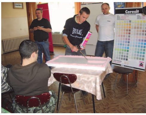
Fot; Prezentacja firm budowlanych dla uczniów technikum budownictwa