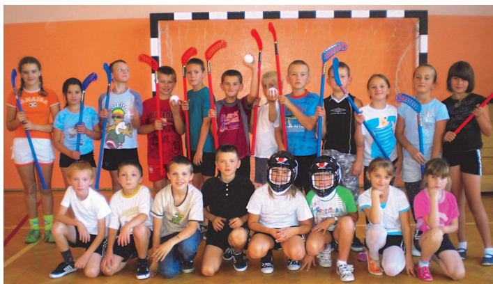
Fot; Unihokej w Szkole Podstawowej NR 3 w Rakszawie

W tymże też miesiącu poszerzyła nam się o tuzin pierwszaków „brać uczniowska”.