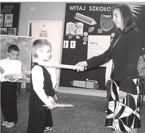
Fot; Pasowanie na ucznia pierwszoklasistów

1 września 2008 roku odbyło się uroczyste rozpoczęcie nowego roku szkolnego.