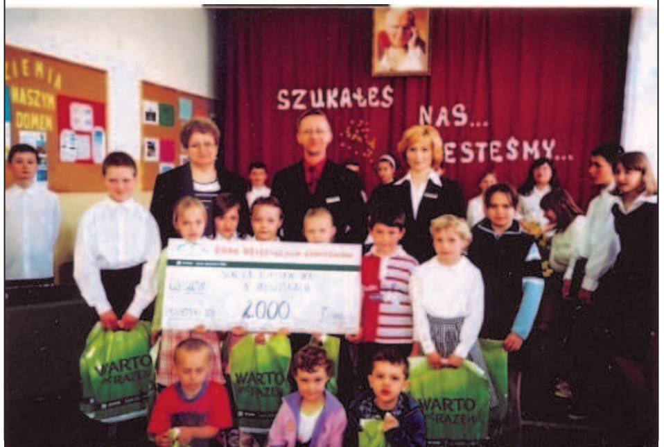
Fot; Przedstawiciele Banku z grupą obdarowanych dzieci

Szkoła Podstawowa Węgliskach brała udział w Projekcie „Bank Dziecięcych Uśmiechów” – otrzymaliśmy kwotę 2 000 zł, za którą zakupiliśmy odzież i obuwie dla 13 uczniów z rodzin o trudnej sytuacji materialnej. Uroczyste wręczenie czeku odbyło się 2 kwietnia 2008 roku i zostało połączone z akademią poświęconą III rocznicy śmierci Ojca św. Jana Pawła II.