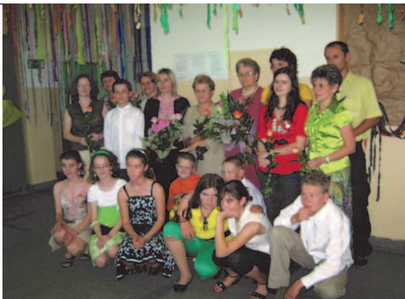
Fot; Pożegnanie klasy VI

Największym wydarzeniem sportowym organizowanym przez Stowarzyszenie „Przedszkola Przyszłości” dla najmłodszych dzieci z przedszkola była VI Wojewódzka Sportowa Olimpiada „Przedszkolada” . Kolejny nasz udział zakończył się ogromnym sukcesem, bowiem na 58