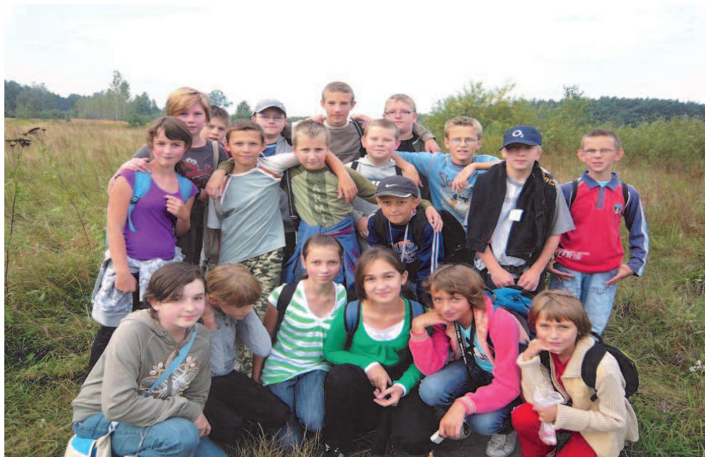
Uczniowie SP 1 na wycieczce w Rabce Zdrój