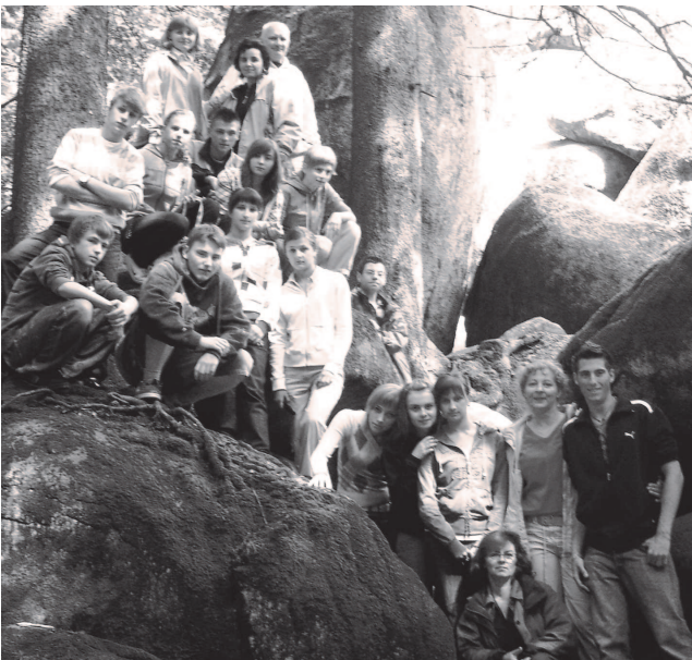
Fot: Grupa uczniów z Gimnazjum w czasie wymiany polsko-niemieckiej

Pamiętając, że „Człowiek czytający wart jest dwóch”, 6 maja 2008 r. w naszej bibliotece obchodzony był Światowy Dzień Książki i Praw Autorskich , w ramach którego zaproszeni nauczyciele zaprezentowali uczniom fragmenty swoich ulubionych książek. Uczniowie z zainteresowaniem słuchali prezentacji pedagogów, które bez wątpienia rozbudzą ich zainteresowania czytelnicze. Dobrym sposobem doskonalenia warsztatu pisarskiego uczniów jest redagowanie gazetki szkolnej. W naszej szkole od 2004 roku członkowie Koła polonistyczno - dziennikarskiego wydają gazetkę szkolną. Miesięcznik nosi nazwę Burza Mózgów .