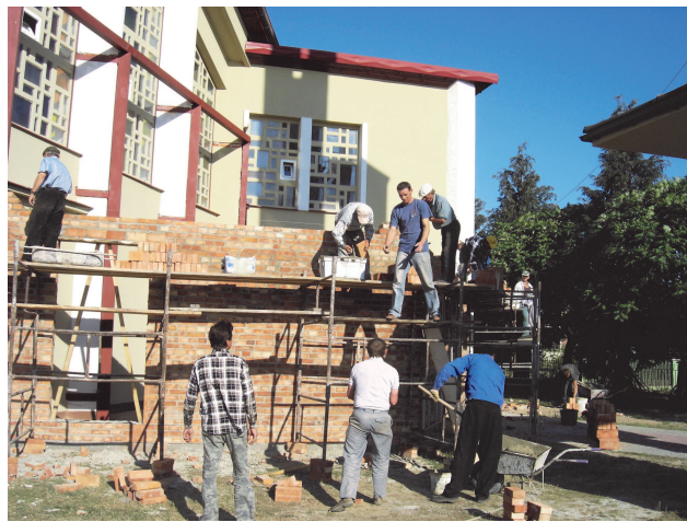
Fot; Pomoc mieszkańców w rozbudowie Kościoła

Teraz Dom Boży wita wszystkich szeroko otwartymi drzwiami ofiarując swoje Boże „usługi”. Czekają nas jeszcze wiele pracy by było ciepło, by było jeszcze więcej miejsc siedzących, również dla ministrantów. Potrzebna by była poli-