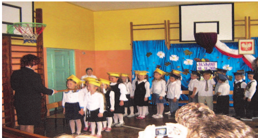
Fot; Pasowanie na Ucznia pierwszoklasistów

wypoczęci i gotowi do nauki przekroczyli próg szkoły i wraz z dzwonkiem rozpoczęli zajęcia lekcyjne. Ważnym wydarzeniem było Pasowanie na uczniów klas I . Najmłodszy uczniowie uroczyście przyrzekli być dobrymi i uczciwymi Polakami szanującymi symbole narodowe, tradycje, historię naszego kraju. Tradycją naszej szkoły jest otaczanie opieką pierwszoklasistów przez starszych kolegów z kl. IV. Starsi koledzy życzyli im by nie tracili wiary w spełnienie marzeń, tych małych i tych większych.