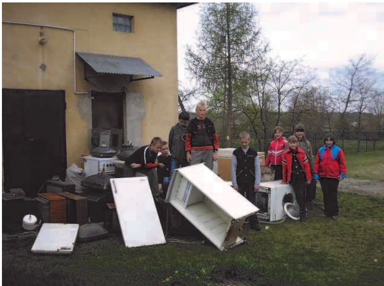
Fot; : Blisko ekologii– Ogólnopolska Akcja „Zbiórka ZSEE”

W rankingu Szkolnego Związku Sportowego szkoła została sklasyfikowana na trzecim miejscu w gminie i na dziesiątym w powiecie łańcuckim.