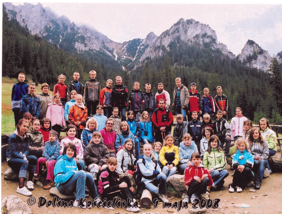
Fot; Uczestnicy wycieczki do Zakopanego