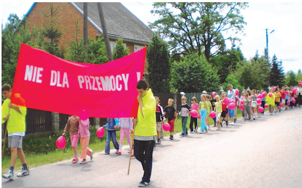
Fot; Przemarsz społeczności szkolnej z okazji „Dnia bez Przemocy”

Obok zajęć obowiązkowych „ruszyły” koła zainteresowań – miejsce dla siebie znajdują kochający przyrodę, zamiłowani w historii, ci, co lubią pędzel i farby, uwielbiają taniec, ci, którym miła jest plansza i figury szachowe, a i aktorzy mogą dać upust swoim talentom. Dla mniej łaknących wiedzy, nauczyciele organizują konsultacje przedmiotowe, na które ochotniczo uczęszcza szkolna dziatwa.