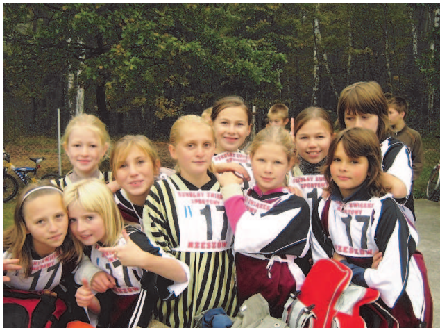
Fot; Drużyna dziewcząt z SP 2 na zawodach sportowych

Osiągamy nie tylko sukcesy dydaktyczne, lecz także wychowawcze. Posiadamy certyfikat Szkoły z Klasą i bierzemy udział