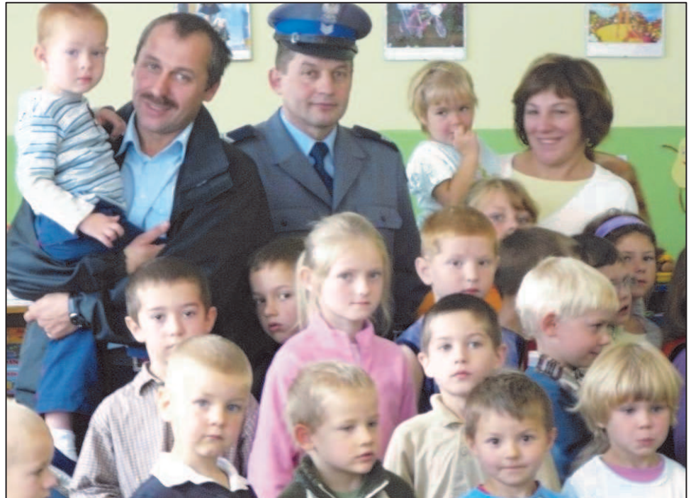
Fot; Policjanci z wizytą w ZSPiP Nr 1

Wszystkie prace zostały wykonane dzięki ogromnemu zaangażowaniu władz gminy i współpracy z rodzicami. Za troskę i zrozumienie naszych potrzeb, dziękujemy.