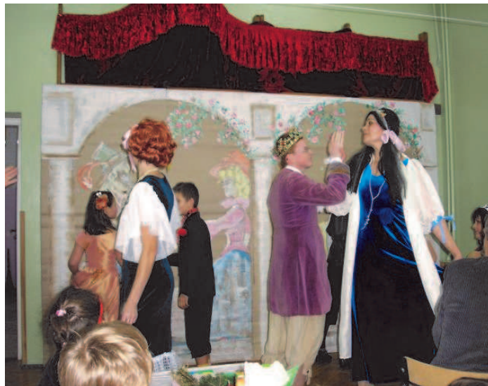
Fot: „Teatr MAM „-forma współpracy z rodzicami

Rodzice i mieszkańcy naszej wsi chętnie uczestniczą w spotkaniach i akademiach, organizowanych rokrocznie w szkole z okazji Świąt Bożego Narodzenia, Dnia Babci i Dziadka, Dnia Mamy i Taty, Dnia Dziecka.