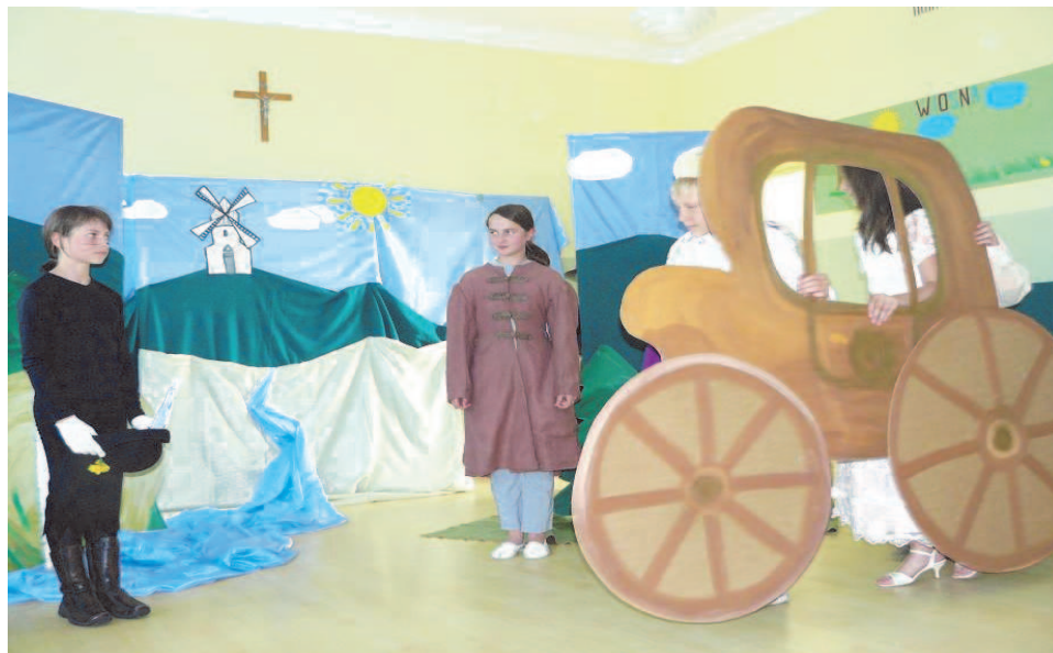
Fot; Inscenizacja „Cyruk przyjechał” w wyk. Koła teatralnego ZSPiP Nr 1