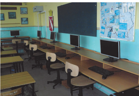
Fot; Nowe meble w pracowni komputerowej

Szkoła promuje zdrowy styl życia , co odzwierciedla się w tematyce zajęć edukacyjnych i wychowawczych. W klasie drugiej prowadzony był program zdrowego