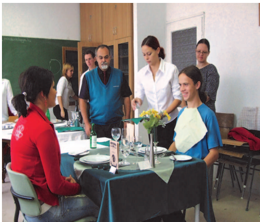
Fot; Działanie – „Polak – Węgier dwa bratanki...” – wymiana ze szkołą w Jaszapati na Węgrzech

Dzięki tym wszystkim działaniom i dobrej współpracy z Gimnazjum Rakszawskim zwiększono nabór do klas pierwszych. Od 1.09.2008 r. funkcjonują 3 klasy pierwsze: 2 klasy technikum: jedna - technikum budownictwa, a druga łączona - technikum hotelarskie i techniku organizacji usług gastronomicznych oraz jedna klasa zasadniczej szkoły zawodowej w zawodach: kucharz małej gastronomii i posadzkarz.