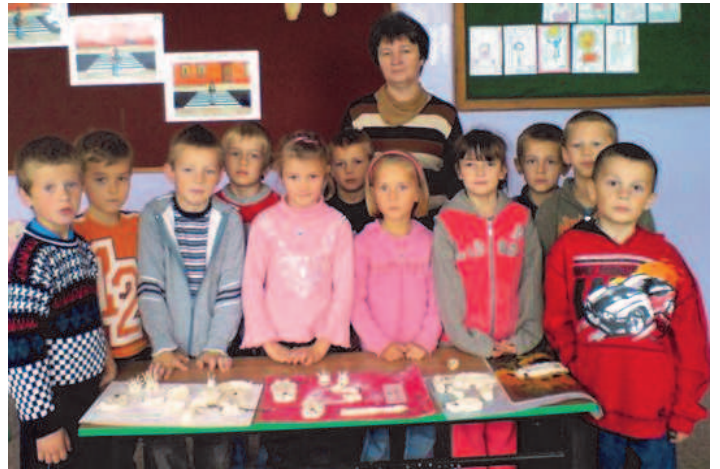
Fot; Warsztaty w Szkole Podstawowej Nr 3 w Rakszawie

Przed nami już tylko 9 miesięcy roku szkolnego 2008/2009. Jaki będzie? Mamy nadzieję, że nie zabraknie sukcesów, o czym niezwłocznie informujemy mieszkańców naszej miejscowości na łamach biuletynu.