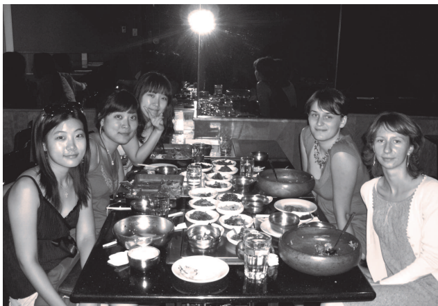
Fot: W miłym towarzystwie koleżanek Koreanek

„Śniadanie u Tiffaniego”, Trump Tower czyli kwintesencja ostentacyjnego luksusu i wspaniałości jest zespołem ekskluzywnych salonów i butików dla każdego, oczywiście za niewyobrażalnie wielką sumę. Dodatkowo na Piątej Alei znajduje się największa świątynia Nowego Jorku - Katedra św. Patryka zaprojektowana w stylu francuskiego gotyku. Jednak najprzyjemniejszym i najczęstszym miejscem odpoczynku nowojorczyków jest Central Park zajmujący powierzchnię 341 ha. Jak nazwa wskazuje znajduje on się w centrum miasta, i jest największą oazą zieleni w NY. Urządzony w stylu angielskim, posiada wiele rozległych łąk, kilkanaście wzgórz, chodników dla pieszych oraz nowojorskie zoo. Największym atutem jego jest duża ilość drzew (ok. 26 tys.). Prócz tego w parku znajduje się wiele rzeźb i pomników z których największym i najokazalszym jest monument króla Władysława Jagiełło – jest to polski akcent w tak wielkim amerykańskim mieście. Żałujemy jednak, że nie udało nam się zobaczyć z bliska stojącej samotnie na osobnej wysepce w pobliżu Manhattanu, symbolu wyzwolonej Ameryki – Statuy Wolności. Jednakże nawet z daleka robi ona imponujące wrażenie.