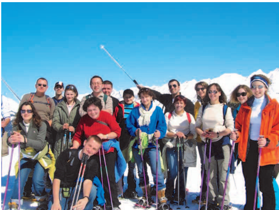
Fot; Program Socrates – Comenius (Francja – Węgry - Polska)

⇒ realizacja projektu „ Promocja obszarów chronionych szansą rozwoju turystyki, na przykładzie Brzózkańskiego Obszaru Chronionego Krajobrazu ” w ramach ogólnopolskiego programu „Działaj Lokalnie V” Polsko-Amerykańskiej Fundacji Wolności realizowanego przez Akademię Filantropii w Polsce przy współpracy z Leżajskim Stowarzyszeniem Rozwoju.