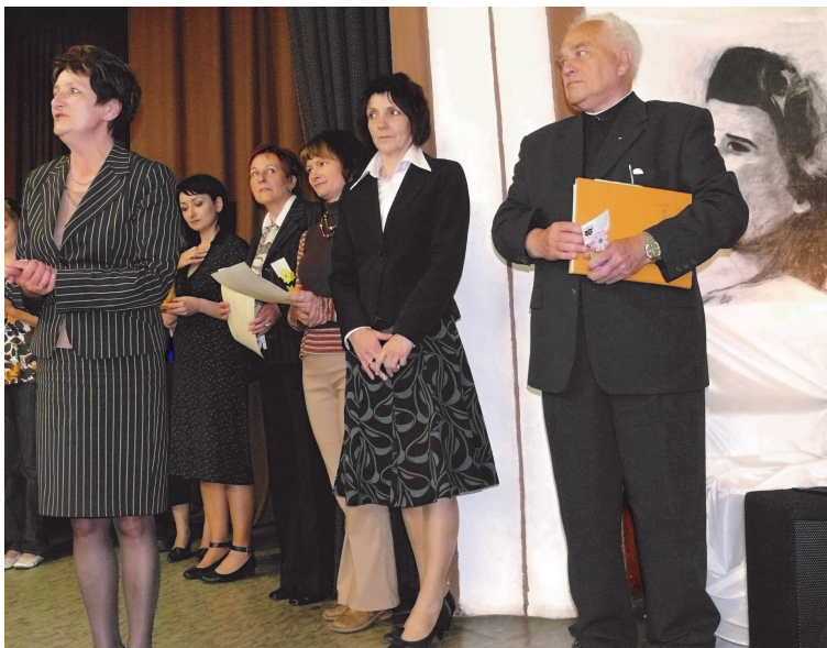
Fot: I Przegląd Teatrów Szkolnych im. Zenony Turskiej

Wielu talentów scenicznych nie udało się z pewnością odkryć, gdyby nie działające w Szkole Koło teatralne , które skupia chętnych gimnazjalistów ze wszystkich klas i stwarza możliwość twórczego rozwijania zainteresowań recytatorskich, aktorskich, teatralnych, muzycznych, plastycznych i innych. Spotkanie młodego człowieka z teatrem powoduje rozwój intelektualny i emocjonalny. To przygoda tak dla nauczyciela, jak i dla podopiecznych. Bo teatr to nie tylko scena, dekoracje, aktorzy, publiczność. Teatr, to aktywny proces twórczy. Kryje niespodzianki, radości, sukcesy, ale i porażki. Teatr to wspólna praca nad tekstem literackim, słowem, gestem, ruchem. Nad kontaktem z partnerem, nad umiejętnością pracy z całym zespołem.