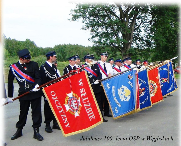
Jubileusz 100 -lecia OSP w Węgliskach