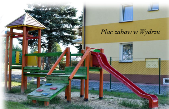
Plac zabaw w Wydrzu