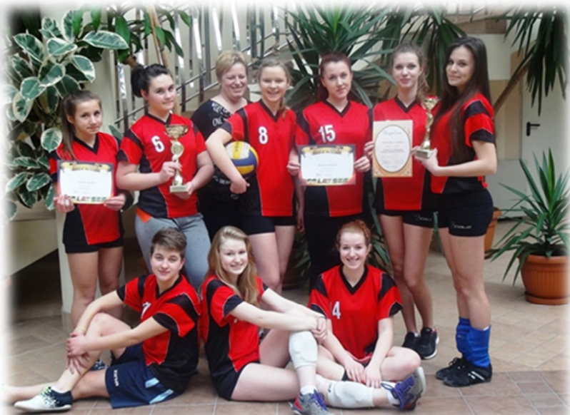
Final Powiatowej Gimnazjady w Piłce Siatkowej Dziewcząt

W dniu 10 lutego 2014r. w hali sportowej MOSiR w Łańcucie odbył się Final Powiatowej Gimnazjady w Pił-