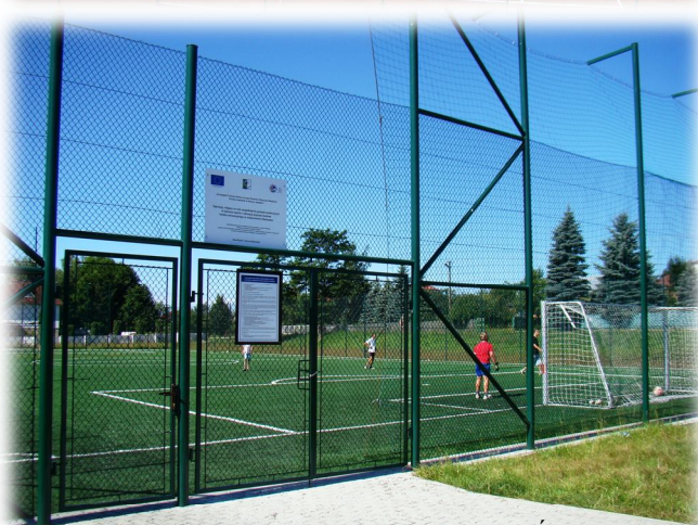
Boisko rekreacyjne w Rakszawie Środkowej