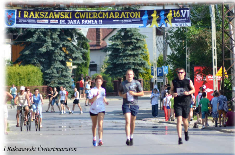
I Rakszawski Ćwierćmaraton