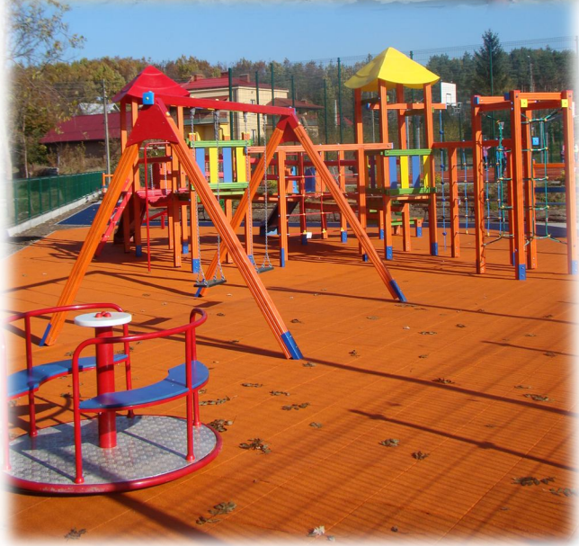
Plac zabaw o sztucznej nawierzchni przy SPI w Rakszawie