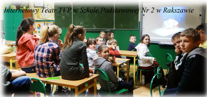
Internetowy Teatr TVP w Szkole Podstawowej Nr 2 w Rakszawie

Internetowy Teatr TVP dla szkół– nowatorski projekt realizowany przez Telewizję Polską. Skierowany jest on do uczniów szkół podstawowych, gimnazjalnych i ponadgimnazjalnych. W szczególności tych, które są oddalone od wielkomiejskich ośrodków kulturalnych i artystycznych. Projekt zakłada wykorzystanie nowoczesnej technologii w celu dotarcia ze sztuką wysoką do masowej młodej widowni.