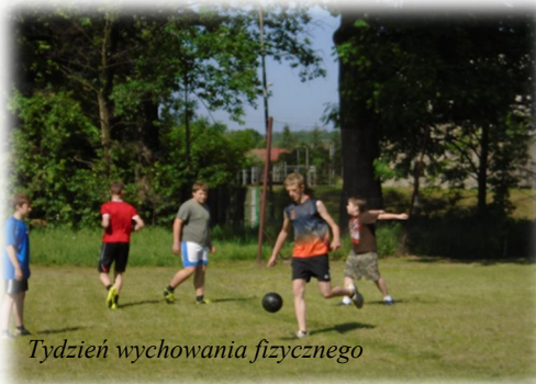
Tydzień wychowania fizycznego