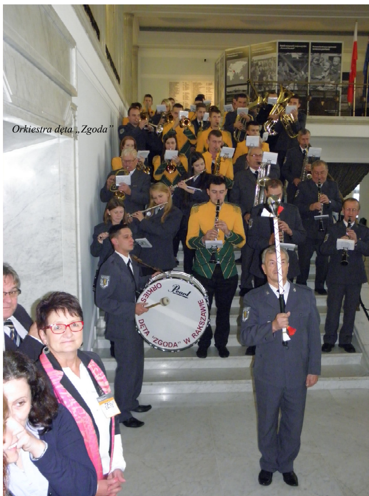
Orkiestra dęta „Zgoda”

Na terenie Gminy Rakszawa działa Biblioteka Publiczna przy Gminnym Ośrodku Kultury i Czytelnictwa w Rakszawie oraz jej filia w Węgliskach. W latach 2011 – 2014 mieszkańcy gminy wypożyczyli ponad 40 tys. książek