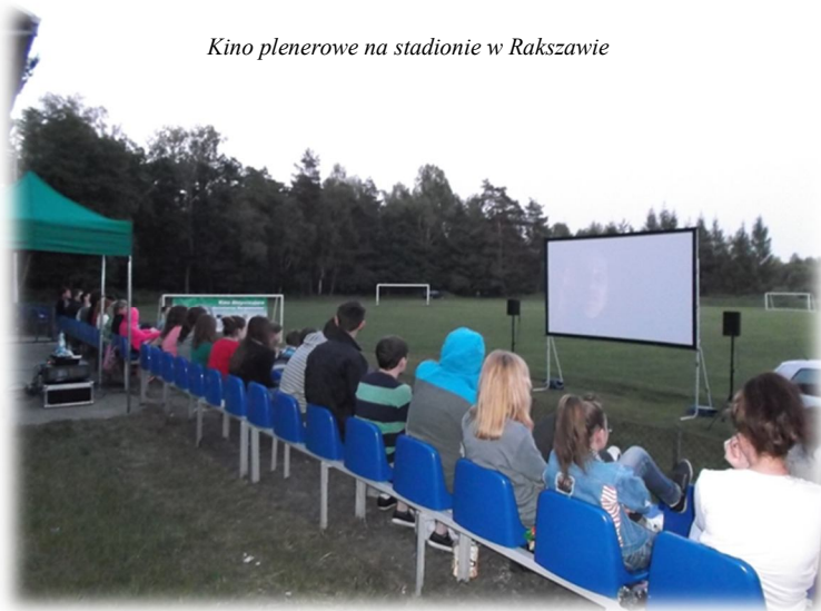
Kino plenerowe na stadionie w Rakszawie

Na terenie Gminy Rakszawa działa Biblioteka Publiczna przy Gminnym Ośrodku Kultury i Czytelnictwa w Rakszawie oraz jej filia w Węgliskach. W latach 2011 – 2014 mieszkańcy gminy wypożyczyli ponad 40 tys. książek