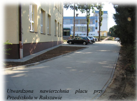
Utwardzona nawierzchnia placu przy Przedszkolu w Rakszawie

Ponadto we wszystkich szkołach przeprowadzono remonty sal lekcyjnych, zakupiono wyposażenie, materiały dydaktyczne, sprzęt i meble.