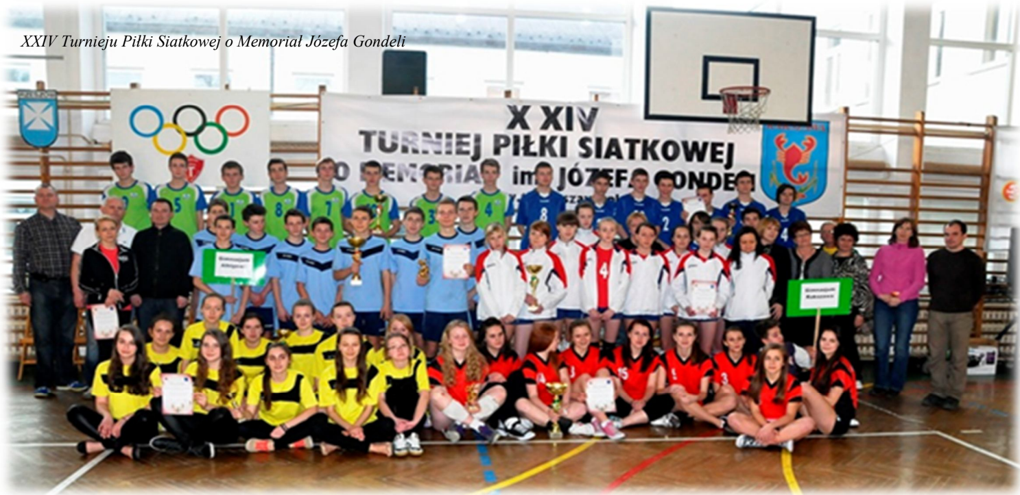
XXIV Turnieju Piłki Siatkowej o Memorial Józefa Gondeli

W dniach 2-6 czerwiec 2014r. w naszym gimnazjum w ramach projektu „Kolorowo