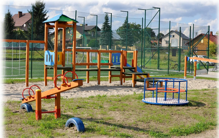
Plac zabaw w Rakszawie Środkowej