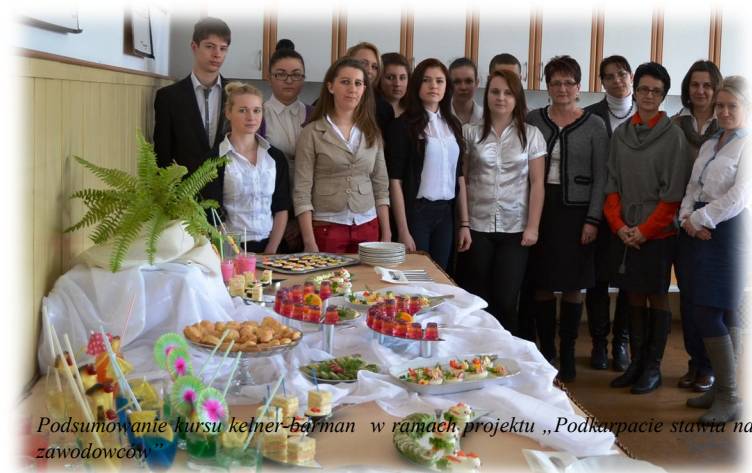
Podsumowanie kursu kelner-barman w ramach projektu „Podkarpacie stawia na zawodowców”

Otrzymaliśmy 130 tys. zł (100%) na realizację projektu „Podkarpacie stawia na zawodowców” w Zespole Szkół Tekstylno-Gospodarczych w Rakszawie. W ramach projektu 64 uczniów otrzymało wsparcie w postaci dodatkowych zajęć wyrównawczych, opieki psychologiczno-pedagogicznej, doradztwa zawodowego. 28 uczniów brało udział w miesięcznych stażach zawodowych. 26 uczniów podnosiło swoje kwalifikacje uczestnicząc w kursach: kelner-barman, baristy, prawo jazdy kat. B. Wyposażyliśmy pracownię gastronomiczną i doradztwa zawodowego w nowoczesny sprzęt i pomoce edukacyjne.