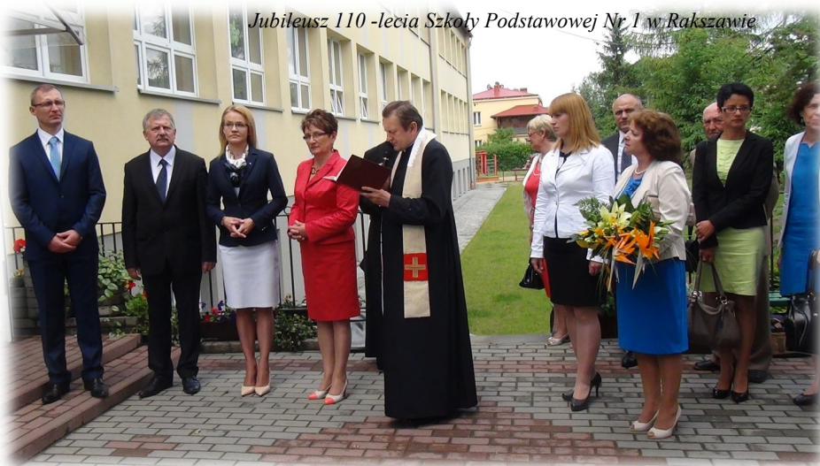
Jubileusz 110 -lecia Szkoły Podstawowej Nr 1 w Rakszawie