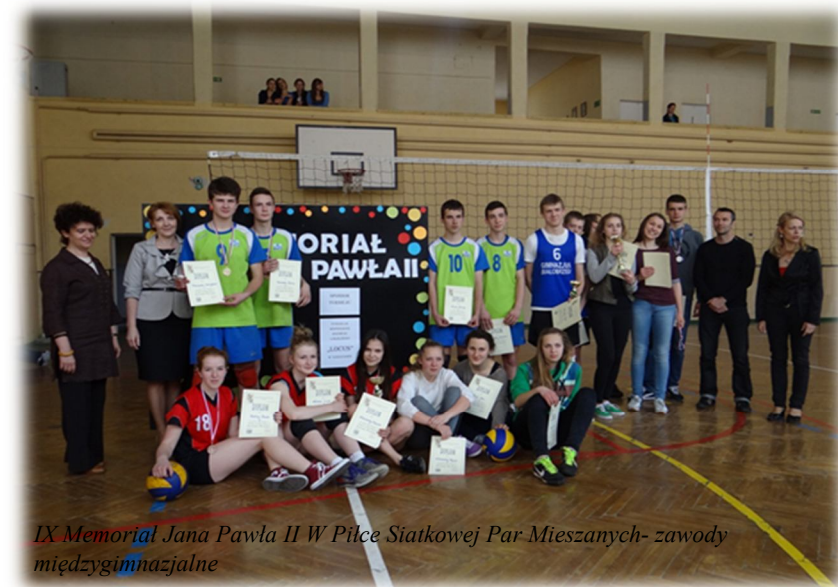
IX Memorial Jana Pawła II W Piłce Siatkowej Par-Mieszanych- zawody międzygimnazjalne

W dniu 21 marca 2014r. w hali Łańcuckiego MOSiR odbył się Półfinal Wojewódzki w Aerobiku , nasi reprezentanci zajęli V miejsce .