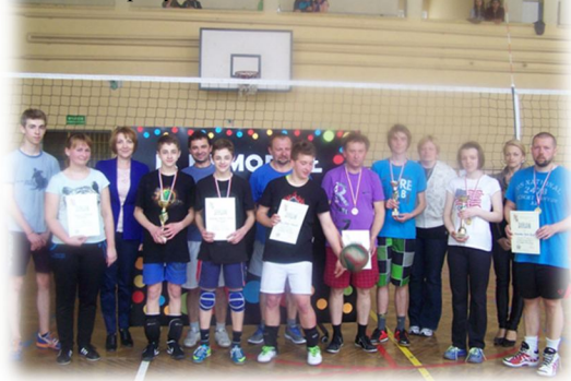
Rodzinne pary siatkarskie