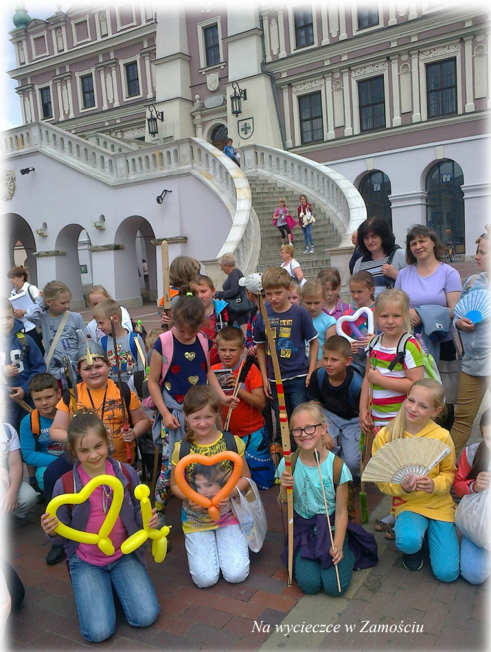
Na wycieczce w Zamościu

W ubiegłym roku szkolnym uczniowie ze Szkoły Podstawowej nr 1 w Rakszawie realizowali program TalentowiSKO, zorganizowany przez Banki Spółdzielcze.