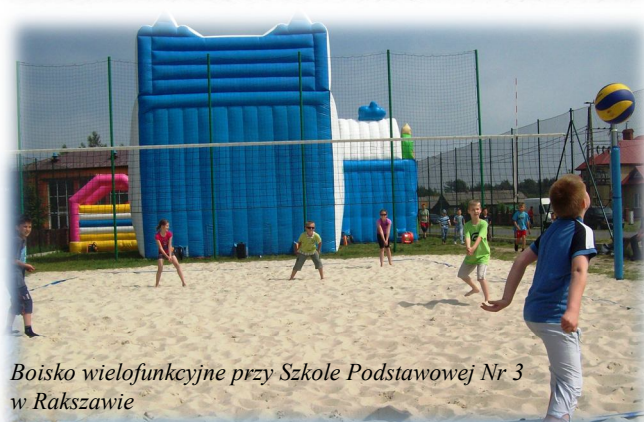
Boisko wielofunkcyjne przy Szkole Podstawowej Nr 3 w Rakszawie