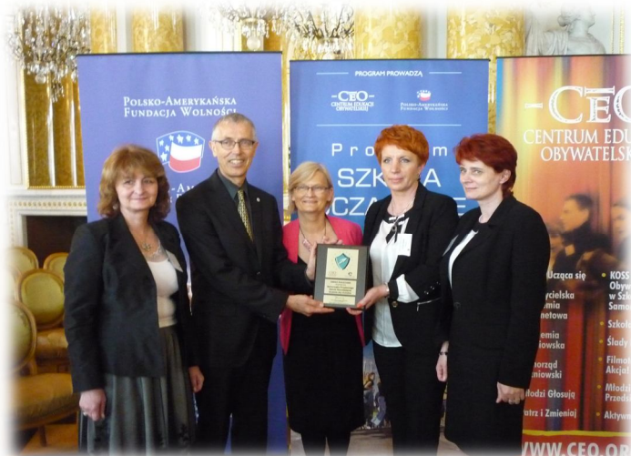
Gmina Rakszawa-Samorząd Przyjazny Szkole Rozwijającej Uczenie się Uczniów