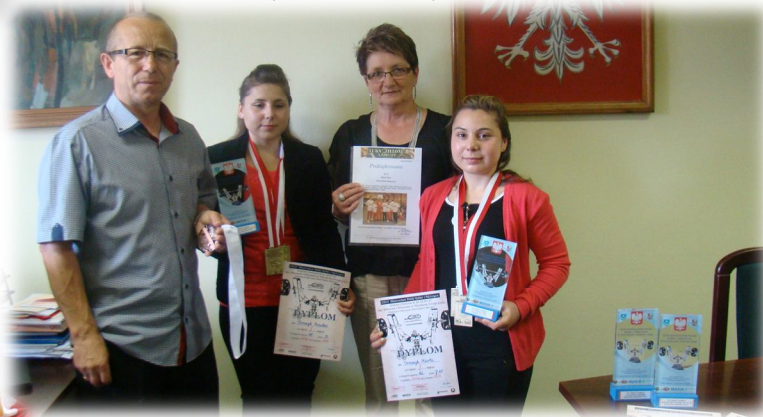
Nadanie imienia Jana Pawła II Szkole Podstawowej Nr 3 w Rakszawie;