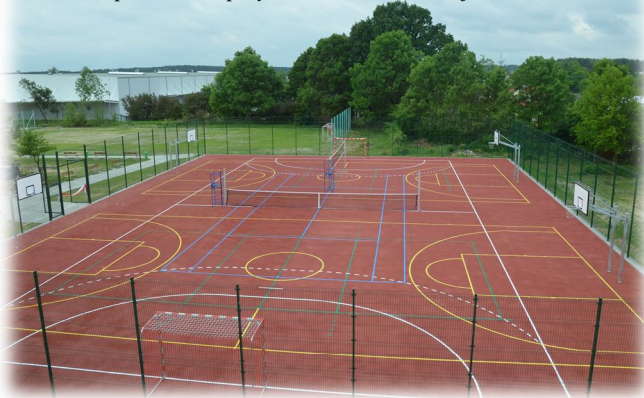
Kompleks boisk przy Szkole Podstawowej Nr 1 w Rakszawie

Finansujemy Kluby Sportowe: Towarzystwo Kultury Fizycznej w Rakszawie, Klub Sportowy „Włókniarz”, wspieramy sportowców z Gminy Rakszawa.