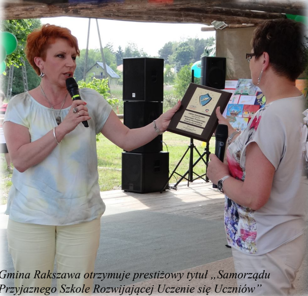
Gmina Rakszawa otrzymuje prestiżowy tytuł „Samorządu Przyjaznego Szkole Rozwijającej Uczenie się Uczniów”