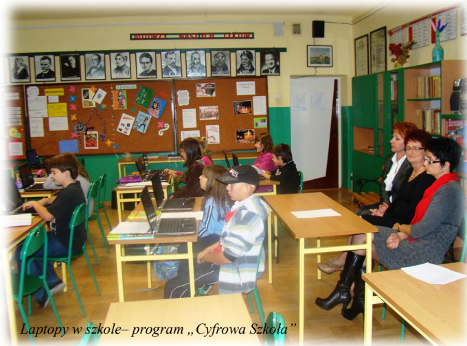
Laptopy w szkole – program „Cyfrowa Szkoła”

W ramach programu „Cyfrowa Szkoła” gmina otrzymała dotację w kwocie 180 tys. zł na zakup 52 laptopów i sprzętu multimedialnego do Szkoły Podstawowej Nr 2 i 3 w Rakszawie. Sprzęt o wartości 225 tys. zł wykorzystywany jest w ramach zajęć szkolnych, a także w czasie wolnym od zajęć dydaktycznych.