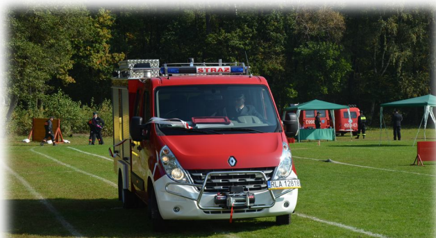
Nowy samochód ratowniczo-gaśniczy dla OSP Rakszawa

W trakcie ćwiczenia zrealizowano zadania wymagające uruchamiania procedur i przedsięwzięć z planów zarządzania kryzysowego, oraz zadania operacyjne w ramach osignięcia gotowości obronnej czasu kryzysu. Stopień przygotowań obronnych oraz poziom wyszkolenia zespołów zadaniowych Wójta Gminy Rakszawa, najlepiej odzwierciedla ocena realizacji zadań, jaką gmina Rakszawa otrzymała od Wojewody Podkarpackiego w piśmie ZK III.657.6.2011r z dnia 29 września 2011r; „Pomimo ograniczonego wykorzystania sił i środków osiągnięto założony cel w zakresie praktycznego rozwinięcia akcji kurierskiej w jednostkach samorządu terytorialnego szczebla powiatowego i gminnego, a także w zakresie przygotowania do funkcjonowania zespołu zastępczych miejsc szpitalnych w Gminie Rakszawa, gdzie zaprezentowane rozwiązania mogą służyć jako wzorzec dla innych samorządów realizujących takie zadania. ”