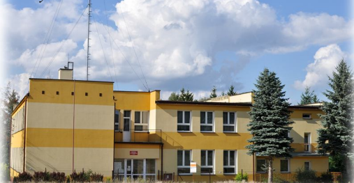
Nowa elewacja na budynku Szkoły Podstawowej w Wydrzu

Ocieplenia podmurówki budynku szkolnego, wykonanie ogrodzenia placu zabaw, wybrukowanie placu przed szkołą, wymiana instalacji C.O w Szkole Podstawowej w Wydrzu