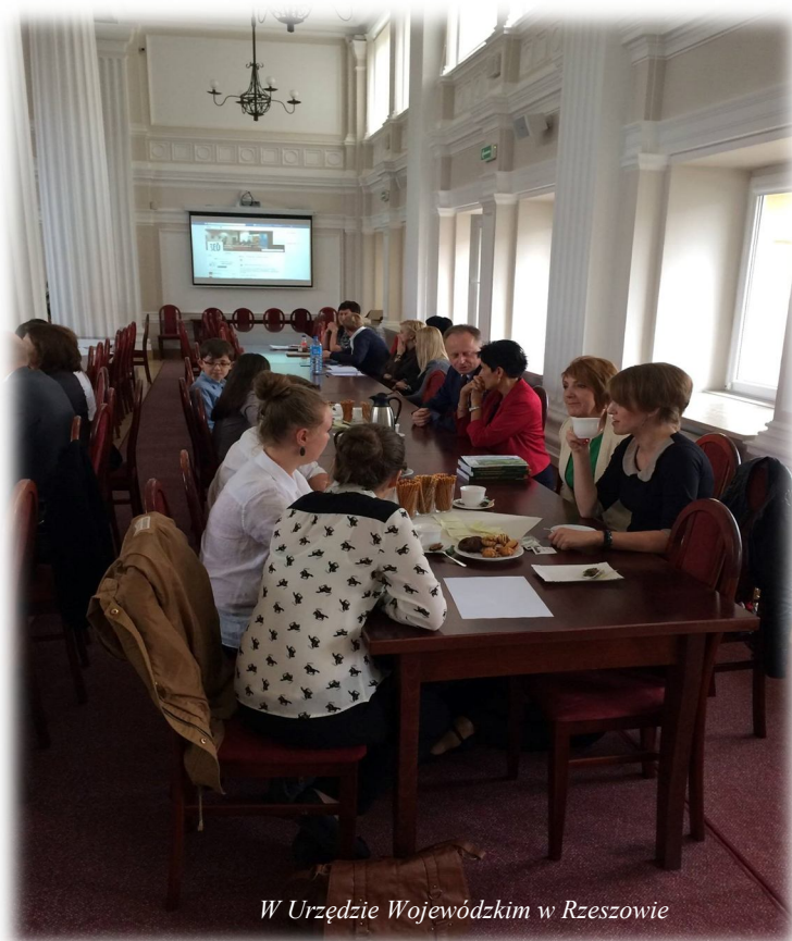
W Urzędzie Wojewódzkim w Rzeszowie

Publiczne Gimnazjum na konferencji „Uczenie się w mikroskopie” w Urzędzie Wojewódzkim w Rzeszowie