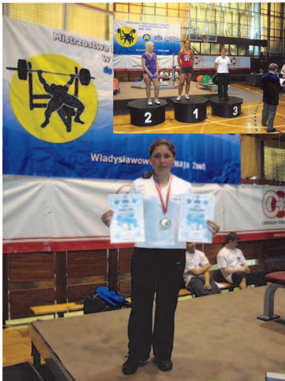
Fot: Mistrzostwa Polski we Władysławowie.

Z a wybitne osiągnięcia sportowe w 2009 roku otrzymała Nagrodę Podkarpackiego Stowarzyszenia Samorządów Terytorialnych dla najzdolniejszej młodzieży województwa podkarpackiego.