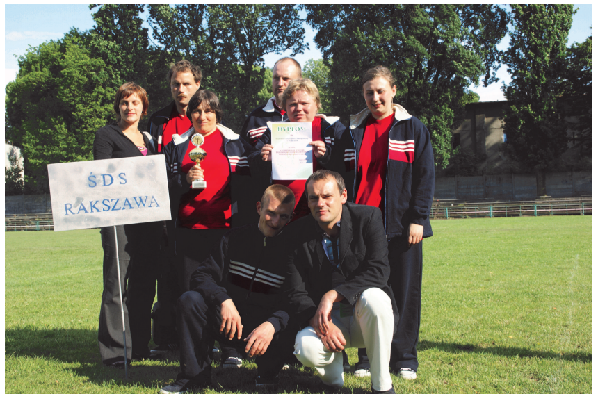
Fot; Wychowankowie Środowiskowego Domu Samopomocy w Rakszawie.

17 czerwca 2009 roku, wychowankowie Środowiskowego Domu Samopomocy w Rakszawie wzięli udział w XI Spartakiadzie Środowiskowych Domów Samopomocy Województwa Podkarpackiego w Jarosławiu. Organizatorem imprezy był Podkarpacki Urząd Wojewódzki, Polskie Stowarzyszenie na Rzecz Osób z Upośledzeniem Umysłowym Koło w Jarosławiu oraz Środowiskowy Dom Samopomocy Koła PSOUU w Jarosławiu. Na Stadionie Miejskim Ośrodka Sportu i Rekreacji zebrało się 350 zawodników z 53 Środowiskowych Domów Samopomocy pod czujnym okiem blisko 100 trenerów i opiekunów. Rozegrano 12 sportowych konkurencji. Wszyscy zawodnicy otrzymali pamiątkowe dyplomy i puchary. Po zmaganiach sportowych uczestnicy mieli okazję zwiedzić Opactwo Sióstr Benedyktynek znajdujące się w Jarosławiu oraz Ratusz.