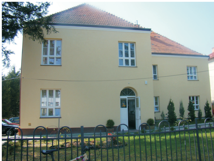
Fot: Przedszkole Nr 1 w Rakszawie-wrzesień 2009.