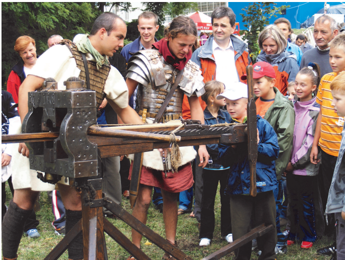
Fot : Żołnierze rzymscy przy maszynie obłężniczej.

O tym jak sporządzano tkaniny zainteresowani dowiedzieli się dzięki pokazowi tkactwa przy użyciu rekonstrukcji pionowego krosna tkackiego. Jakie buty nosił Kaligula? W czym chodzili niewolnicy a w czym Sokrates? Odpowiedzi na te i inne pytania usłyszeliśmy na stanowisku kaletnika. O tym jak z wątroby ofiarnego zwierzęcia odgadywano zamiary bogów i na czym polegała różnica między magią „państwową” a „ludową” opowiadał augur, czyli kapłan-urzędnik. Takie rekwizyty jak: haltery używane przy skoku w dal, rzemieńne rękawice, skrobaczki można było zobaczyć a przy okazji spróbować swoich sił w trudnym rzucie kamiennym dyskiem na stanowisku sportowym. Barbarzyńcy zaprezentowali typowe uzbrojenie, stroje, barwy wojenne, opowiedzieli o metodzie wyboru wodza na czas wyprawy wojennej oraz przeprowadzili wiec. Rozszerzeniem tego stanowiska były warsztaty obróbki bursztynu i kości. Ogromne emocje wzbudziły improwizowane starcia legionistów rzymskich z Barbarzyńcami oraz pokaz musztry legionowej.