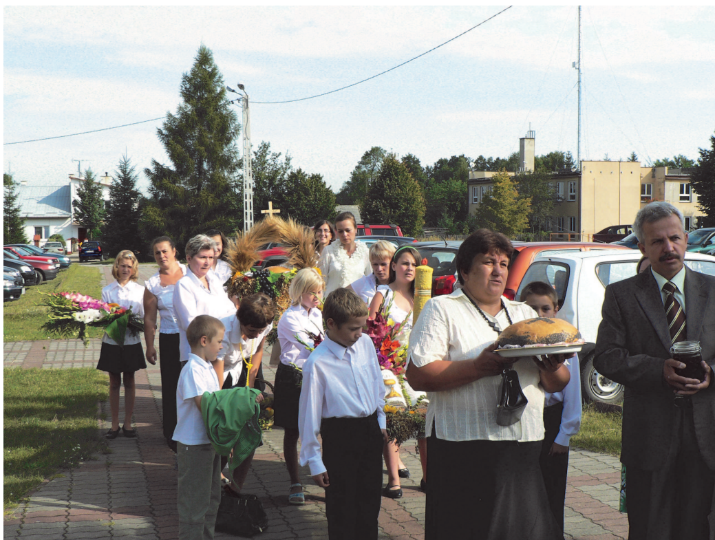
Fot; Na przedzie szli starostowie ..... (Korowód dożynkowy z Wydrza).