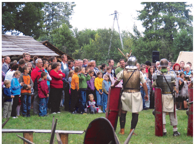
Fot: Legioniści rzymscy.

Opr. Agnieszka Rzepka Dyrektor GOKiC w Rakszawie