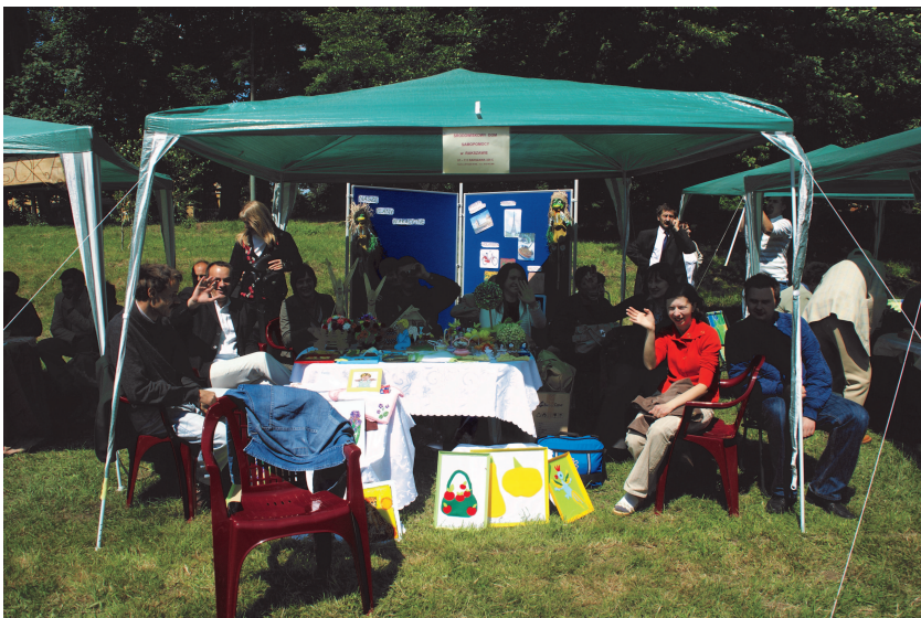
Fot; Wychowankowie Środowiskowego Domu Samopomocy w Rakszawie.

Środowiskowy Dom Samopomocy w Rakszawie funkcjonuje od poniedziałku do piątku w godzinach: 7.00 do 15.00 . Dom mieści się na terenie kompleksu budynków Szkoły Włókienniczej w Rakszawie. Ośrodek aktualnie posiada wolne miejsca i może przyjąć kolejnych Uczestników. Szczegółowe informacje można uzyskać osobiście lub telefonicznie pod numerem: (017) 224 93 60 .