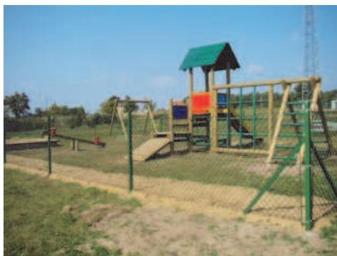
Fot: Plac zabaw przy Szkole Podstawowej w Węgliskach -2009.