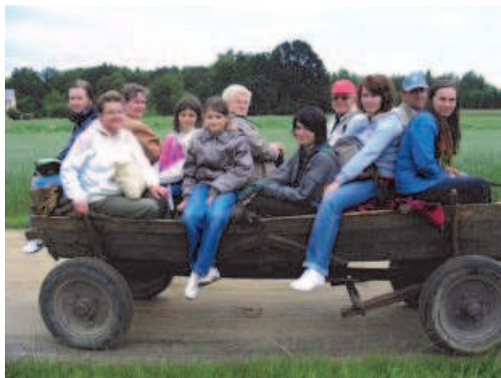
Fot; Przejażdżka na konnej bryczce.

P odczas realizacji w/w projektu w okresie od 1 lutego do 30 czerwca br. odbył się kurs na animatora turystycznego Rakszawy, wytyczono i oznakowano dwie ścieżki dydaktyczne: „Las Dąbrowski – pod Grabiną” i „Wilczelyko”, poprawiono oznakowanie ścieżki dydaktycznej „Żelazny szlak”, wydano przewodnik po Gminie Rakszawa, który obecnie można nabyć w GOKiC.