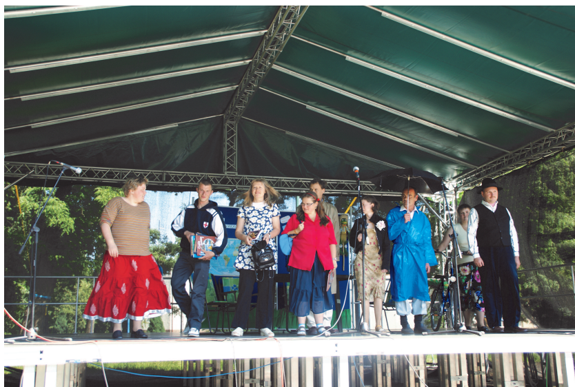
Fot; Wychowankowie Środowiskowego Domu Samopomocy w Rakszawie.

S trosta Łańcucki wręczył wszystkim uczestnikom dyplomy, upominki i złote medale.....bo w tym dniu nie było przegranych.