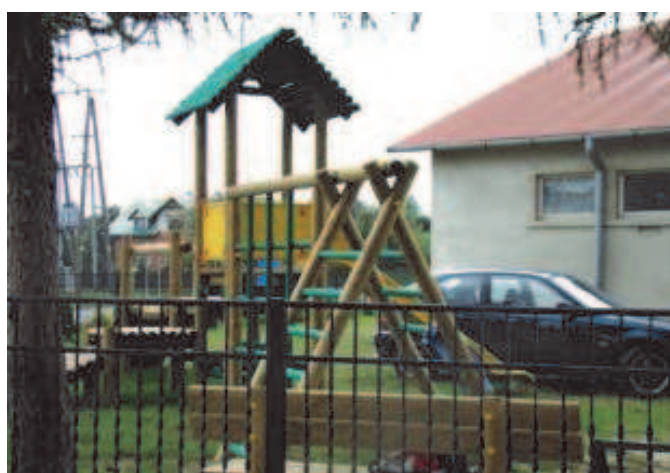
Fot: Plac zabaw przy Szkole Podstawowej Nr 3 w Rakszawie -2009.