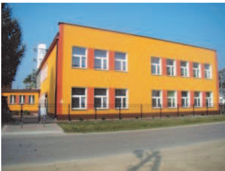
Fot: Szkoła Podstawowa Nr 3 w Rakszawie- wrzesień 2009.

D o końca października 2009 będą trwać prace związane wykonaniem utwardzenia placu przy kościele w miejscowości Wydrze-koszt inwestycji 66 316, 46 zł i placu przy kościele w Rakszawie Górnej- koszt inwestycji 199 838, 90 zł .