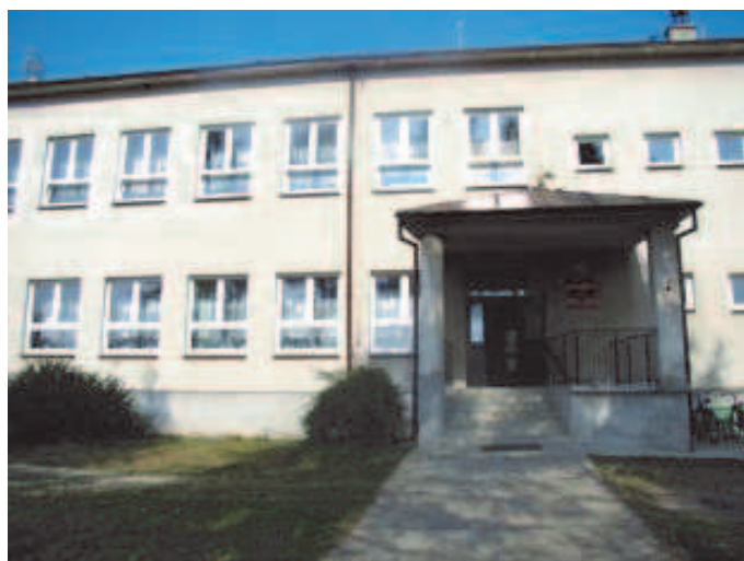
wrzesień 2009.