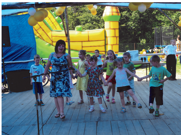
Fot: Festyn Rodzinny w Wydrzu.

W dniu 28 czerwca 2009 roku na terenie Szkoły w Wydrzu został zorganizowany FESTYN RODZINNY, w którego powstanie i przebieg zaangażowała się Rada Rodziców, uczniowie, absolwenci, Stowarzyszenie Absolwen-