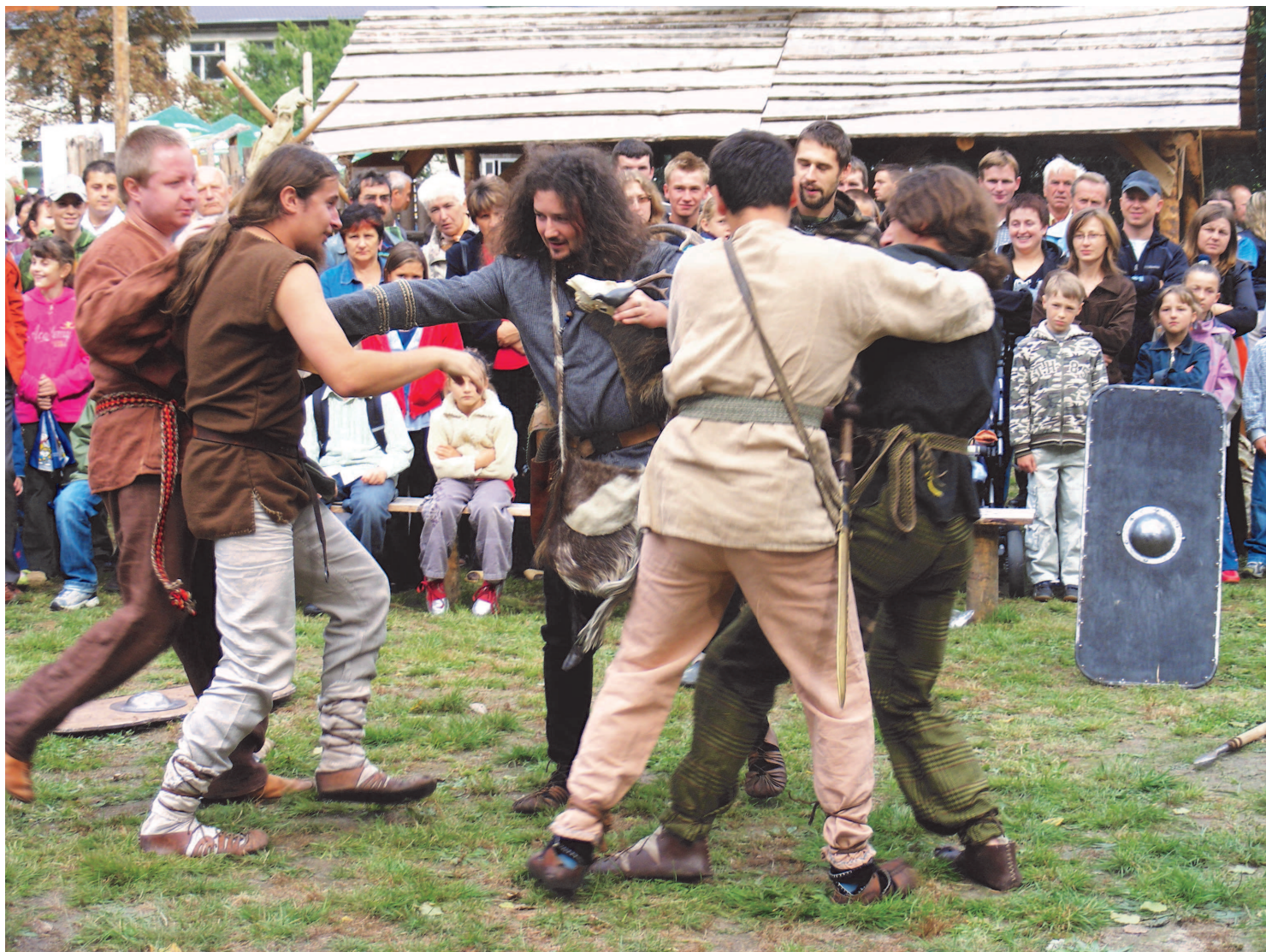
Fot: Walki Barbarzyńców na Osadzie Rakiszawa.

W dniu 6 września 2009 roku Gminny Ośrodek Kultury i Czytelnictwa w Rakiszawie podczas Pikniku Historycznego w Osadzie Rakiszawa wprowadził mieszkańców wsi w obyczajowość świata Antycznej Grecji, Rzymu i Barbarzyńców. W życie codzienne III w. p.n.e. wprowadzili nas członkowie Stowarzyszenia Hellas et Roma i Proantica z Lublina, grupa Barbarzyńców z Rzeszowa oraz lokalni pasjonaci historii. W Osadzie Rakiszawa została zaimprovizowana antyczna wioska, podczas jej zwiedzania można było przekonać się jak wyglądała codzienność ludzi antyku i jakiego kunsztu wymagały rzemiosła. Zwiedzający mogli wszystkiego dotknąć, sami przekonać się jak ciężka do udźwignięcia była lekytka, czy jak trudno było wykonać