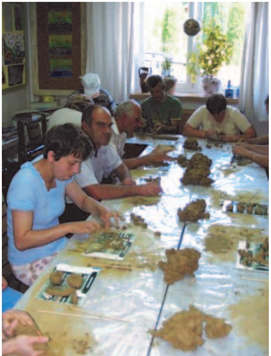
Fot: Zajęcia z rzeźbienia w glinie.