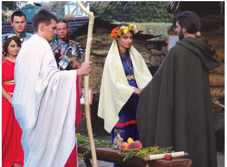
Fot: Zaślubiny rzymskie.

Te i inne atrakcje czekały na mieszkańców Rakszawy w samej Osadzie. A poza nią na terenie boiska sportowego dzieci dały upust swoim emocjom na dmuchanej zjeżdżalni, trampolinie, torze samochodowym oraz jeżdżąc na kucyku.