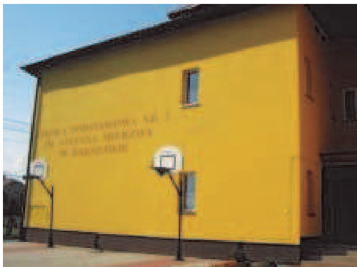
Fot: Szkoła Podstawowa Nr 2 w Rakszawie -wrzesień 2009.