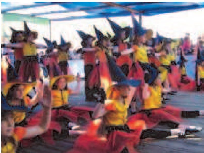
Fot: Występ „Małego Figielka” z Gminy Czarna.

Jednym z założeń planu rozwoju Szkoły Podstawowej Nr 2 w Rakszawie, jest dążenie do integracji całego środowiska związanego z naszą placówką. Staramy się podejmować takie działania, aby rodzice nie tylko czuli się, ale byli w rzeczywistości współgospodarzami szkoły. Postanowiliśmy, że w każdym roku oprócz programowych spotkań z rodzicami typu – wywiadówki warsztatowe i imprezy szkolne, organizować będziemy festyny rodzinne.