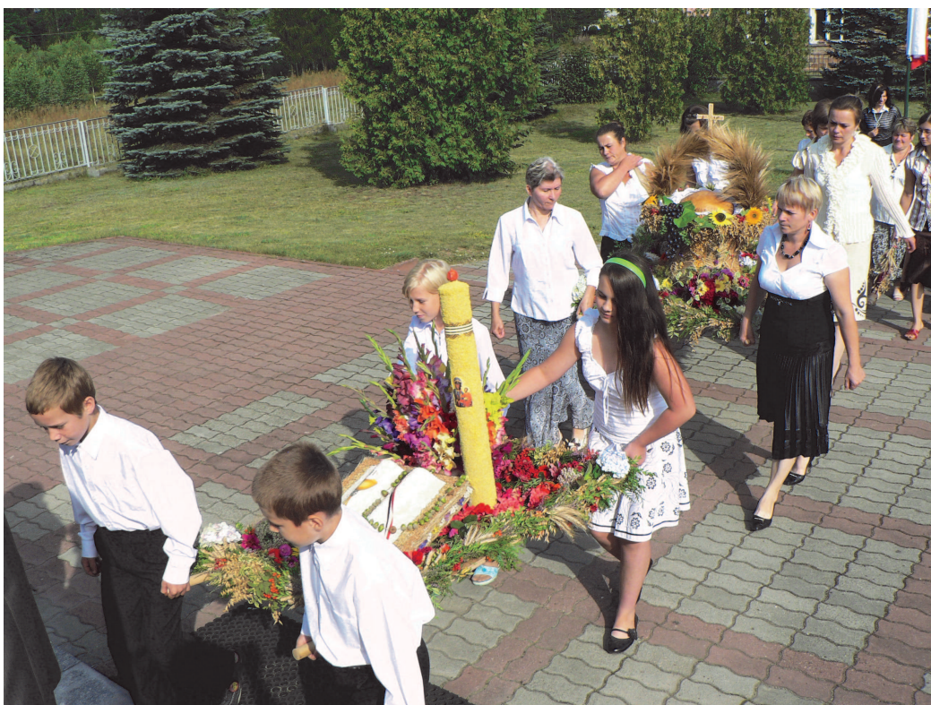
Fot: Barwny korowód wyruszył w stronę Kościoła.