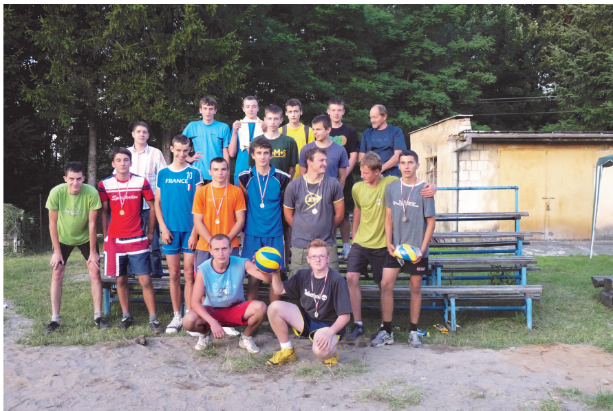
Fot: Uczestnicy Plenerowego Turnieju piłki siatkowej w Wydrzu.

Rozgrywki były bardzo zacięte i na wysokim poziomie, a finał dostarczył wiele emocji gdyż uczestniczyła w nim drużyna z Wydrza. Pogoda dopisała, a organizatorzy przygotowali zimne napoje i lody dla ochłody. Wszyscy uczestnicy turnieju otrzymali od organizatorów poczęstunek