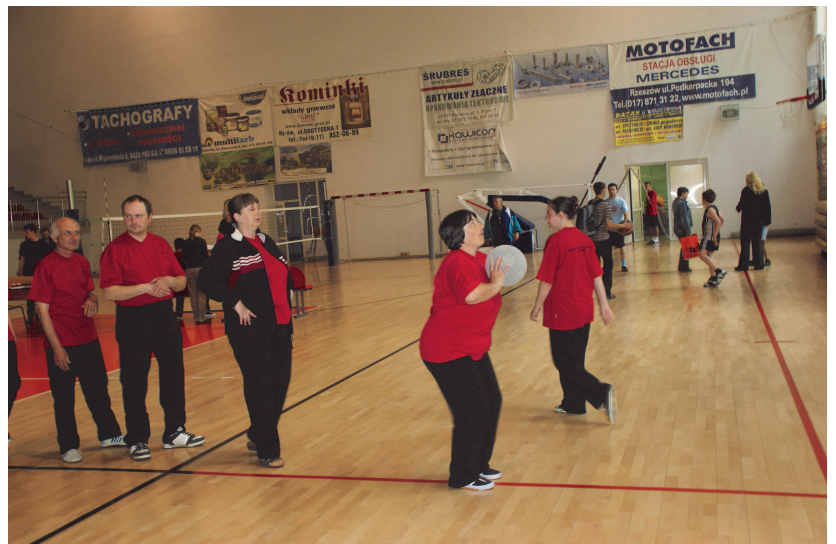
Fot; Wychowankowie Środowiskowego Domu Samopomocy w Rakszawie.