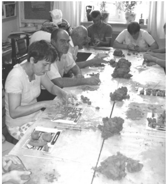
Fot: Zajęcia rękodziela artystycznego.

Z ajęcia terapeutyczne są prowadzone w następujących pracowniach: