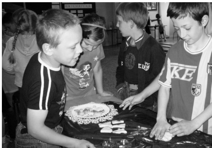
Fot.; Projekt edukacyjny.

w całym procesie nauczania. Główne punkty kodeksu to: bezpieczeństwo w sieci, korzystanie ze źródeł i prawa autorskie oraz wykorzystywanie sieci do komunikacji w szkole. Nacisk będziemy kłaść na pracę z uczniami metodą projektów edukacyjnych wykorzystujących nowe technologie . Chcielibyśmy, aby nasz program przyczynił się do popularyzacji tych atrakcyjnych dla uczniów - a zarazem skutecznych sposobów nauczania. Na stronie programu dostępna jest też platforma blogów . To miejsce, gdzie uczniowie mogą wziąć udział w dyskusji na temat kodeksu, komentować swoje doświadczenia związane z realizacją projektów i dzielić się swoimi pasjami, rozwijając talenty literackie. Program (współpraca z Polsko-Amerykańską Fundacją Wolności specjalizującą się m.in. w wyrównywaniu szans edukacyjnych, Fundacją Agory, Wydawnictwem Pedagogicznym OPERON oraz Fundacją Orange) realizuje idee zawarte w projekcie Podstawy Programowej Kształcenia Ogólnego, przygotowanym przez Ministerstwo Edukacji Narodowej. Współorganizator programu „Gazeta Wyborcza” informuje opinię publiczną o działaniach uczniów, publikuje wybrane materiały