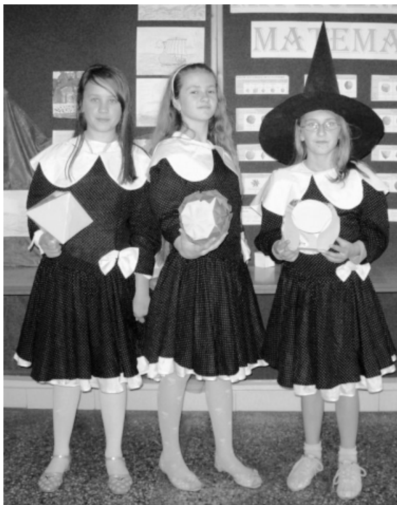
Fot.: Magiczna kwadratowa matematyka

S zkoła Podstawowa Nr 3 w Rakszawie, jako jedna z nielicznych w województwie podkarpackim, uczestniczy od roku szkolnego 2008/2009 w programie Szkoła Myślenia (już trzeci rok z kolei). Pomyślnie program zrealizowało i dyplom uczestnictwa otrzymało prawie 800 nauczycieli z całej Polski, w tym nasi nauczyciele (Wanda Babiarz, Barbara Komorowska, Lucyna Golenia i Wiesław Wawrzaszek). Dokumentacją ich pracy są opisy projektów realizowanych w ramach programu i prezentowanych na szkolnych festiwalach nauki (czerwiec 2009 i 2010). Nauczyciele koordynując prace uczniów nad projektami musieli w niekonwencjonalny sposób podejść do kierowania samodzielną pracą uczniów.