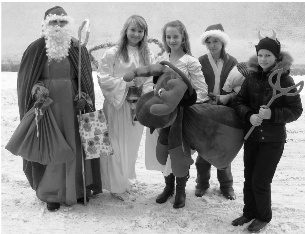
Fot: Odwiedziny Św. Mikołaja