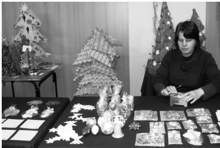
Fot: Kiermasz Świąteczny, fot. Aleksandra Tymińska.