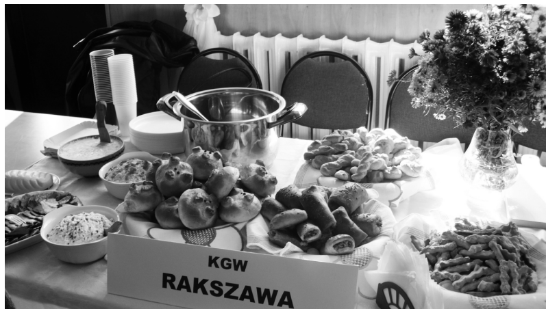
Fot.: Obchody „Święta Chleba” w Albigowej.

W przyszłości prosimy o dalszą współpracę.