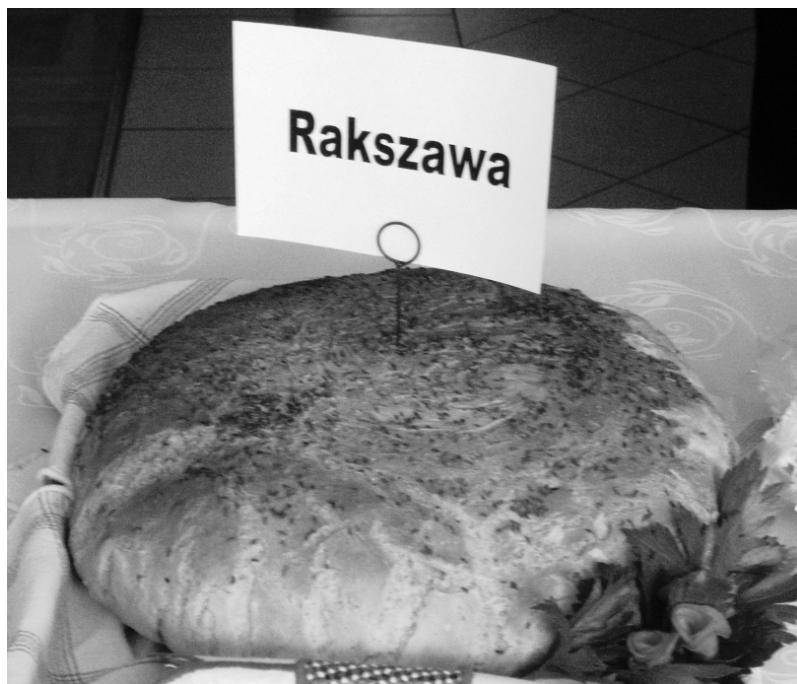
Fot.: Obchody „Święta Chleba” w Albigowej.

P odsumowując tegoroczną działalność Koła Gospodyń Wiejskich z Rakszawy stwierdzamy że jednak „Tak”. Pragniemy przywrócić do życia tradycje ludowe i kulinarne. Zapału nam nie brakuje, pomysłów mamy też bardzo dużo. Pragniemy zachęcić nowe członkinie do pracy i zabawy. Nasze koło jest otwarte, zapraszamy zainteresowane panie do wstąpienia w nasze szeregi.