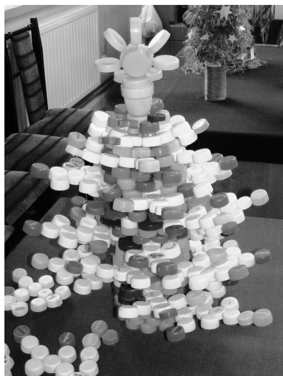
Fot: „Choinkowe wariacje II”.

W dniu 22 listopada w pracowni plastycznej odbył się kolejny już kurs filcowania wełny. Zajęcia odbyły się w grupie pięcioosobowej. Każda z uczestniczek wykonała trzy prace: kwiatek do płaszcza, torby, czy nakrycia głowy, roladkę filcową i kulki filcowe do wykorzystania w biżuterii.