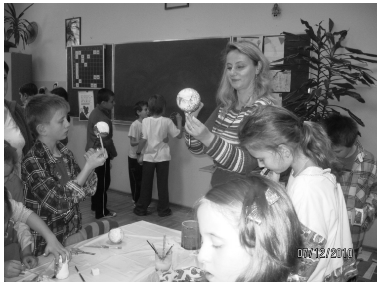
Fot.: Warsztaty plastyczne

Nasze dzieci aktywnie uczestniczą w zawodach sportowych, godnie reprezentując szkołę. Odnoszą liczne sukcesy na szczeblu gminnym i powiatowym: dziewczynki: Im. w Gminnym Turnieju Piłki Ręcznej, IVm. w Powiatowym Turnieju Piłki Ręcznej, IIIIm. w Powiatowych Biegach Sztafetowych. chłopcy: IIIIm. w Gminnym Turnieju Piłki Ręcznej, IVm. w Powiatowych