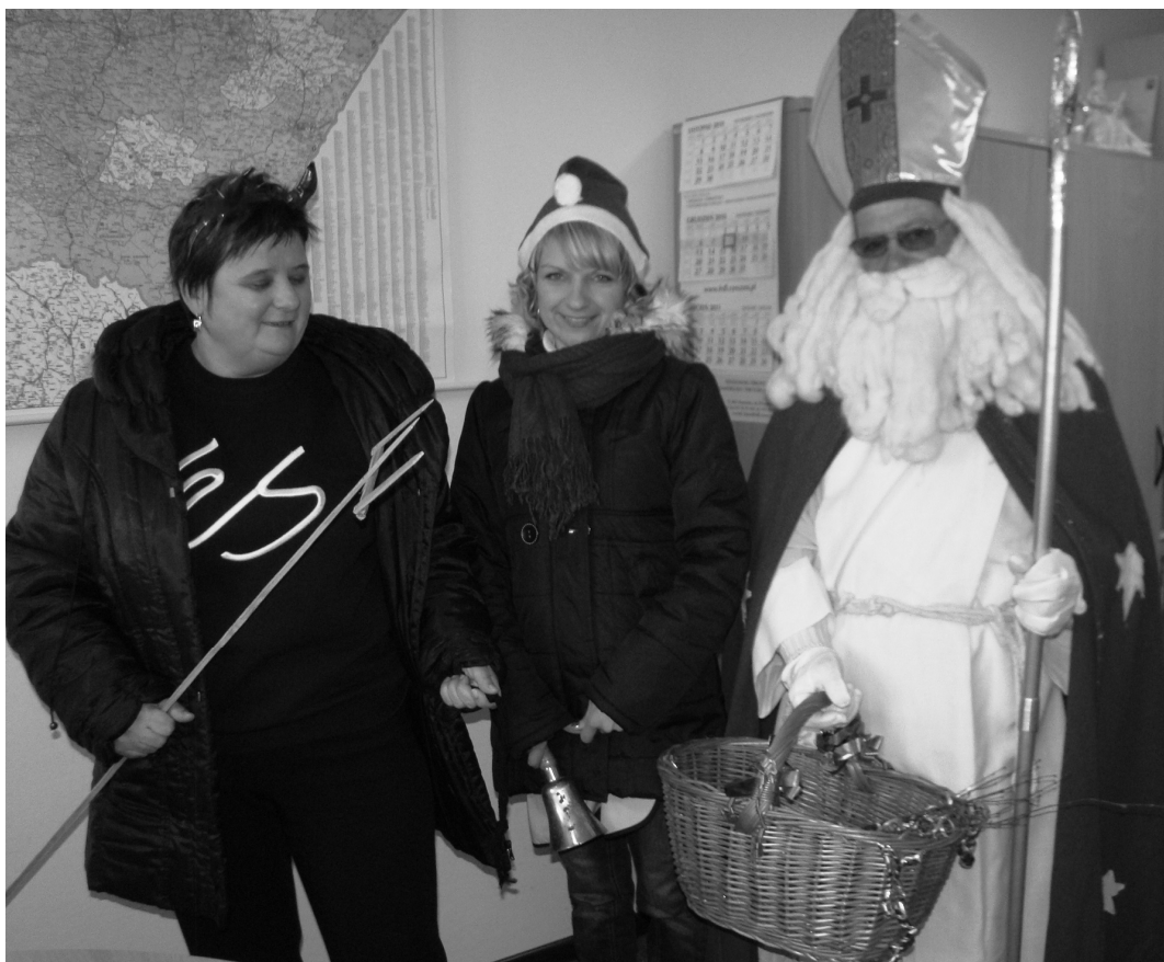
Fot: Odwiedziny Św. Mikołaja