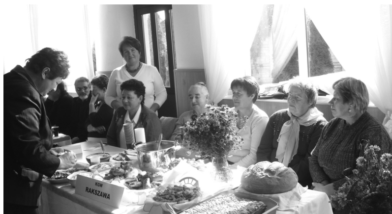
Fot.: Obchody „Święta Chleba” w Albigowej.

W dniu 9 października KGW reprezentowało Gminę Rakszawa w obchodach „Święta Chleba” w Albigowej.