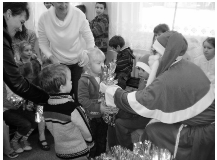
Fot: Mikołaj z wizytą w Szkole Podstawowej w Węgliskach.

Ostatnio nasz Klub zorganizował Mikołajkową zbiórkę zabawek, słodczy oraz przyborów szkolnych dla dzieci objętych opieką Podkarpackiego Hospicjum dla Dzieci. Udało nam się zebrać i dostarczyć na miejsce sporą ilość paczek.