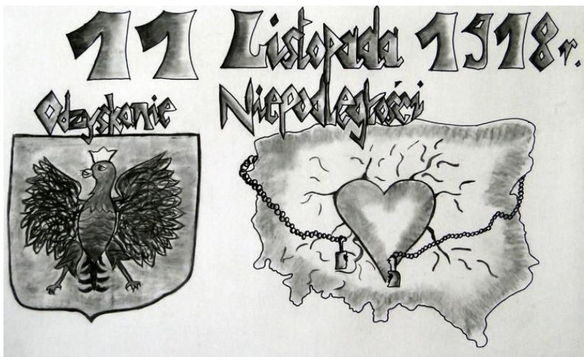
Fot.: Zwycięska praca w konkursie na plakat pt. „Święto Niepodległości”.