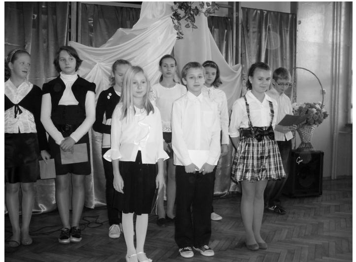
Fot.: Dzień Patrona

N a wywiadówce rodzice uczniów klasy pierwszej zostali zapoznani z istotą i celami projektu oraz koncepcją inteligencji wielorakich Howarda Gardnera. Rodzice uzupełnili karty, pomagające określić profil inteligencji dziecka.