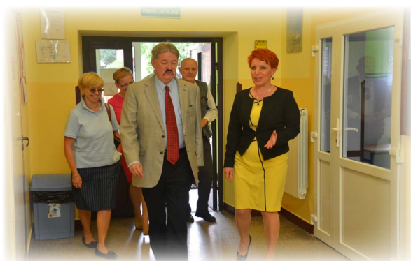
Zaproszeni goście zwiedzają szkołę.