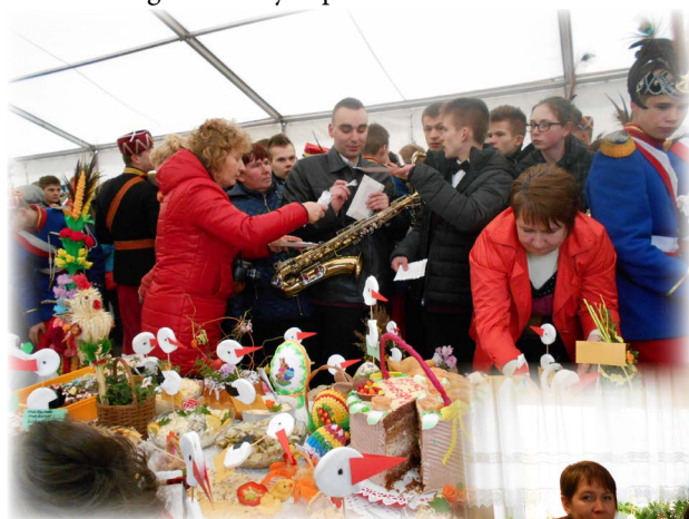
W Gniewczynie Trynieckiej na finale „Konkursu wielkanocnego”