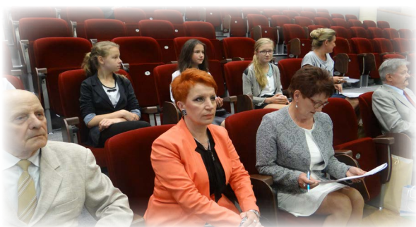
Obrady X Sesji Sejmiku Województwa Podkarpackiego.

FUNDACJA KOŚCIUSZKOWSKA została ustanowiona dnia 10 listopada 2010 roku przez Fundatora – The Kosciuszko Foundation, Inc. z siedzibą w Nowym Jorku. Celem Fundacji jest prowadzenie, wspieranie i promowanie wymiany intelektualnej, kulturalnej i edukacyjnej pomiędzy Rzeczpospolitą Polską a Stanami Zjednoczonymi Ameryki Północnej.