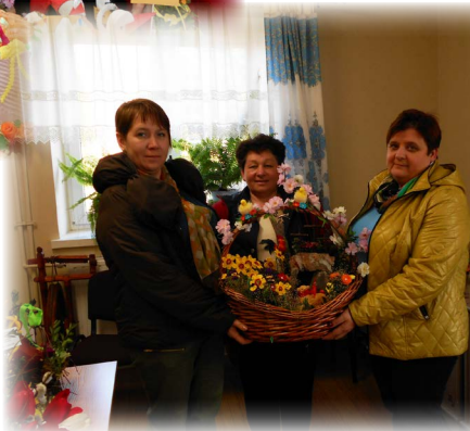
II miejsce za skroik wielkanocny