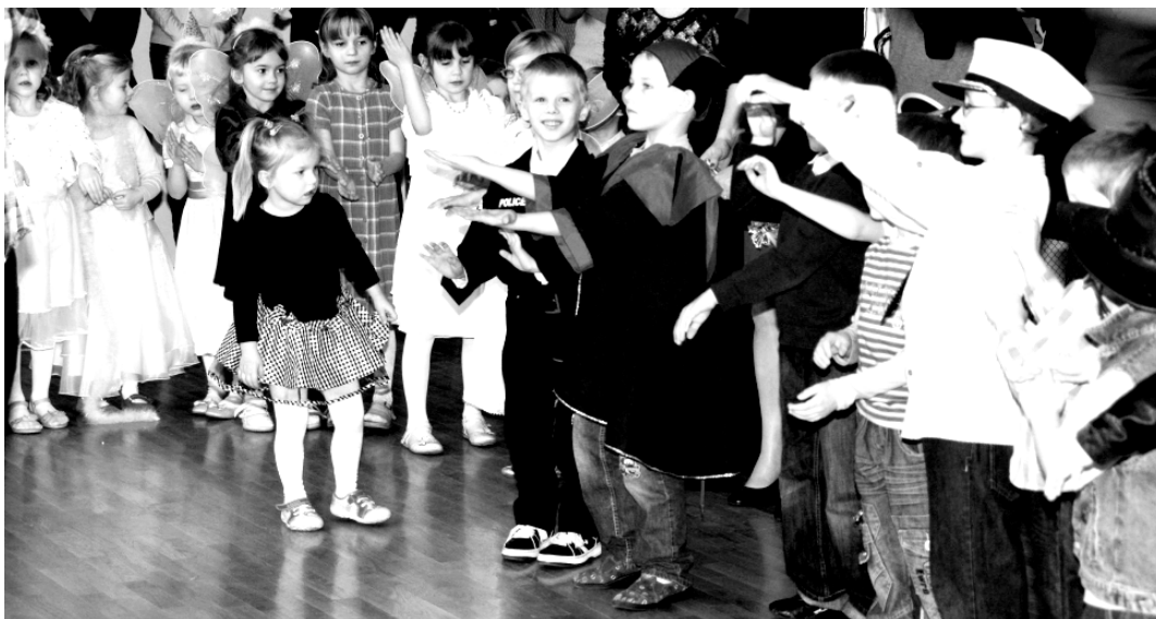
Fot; Przedszkolaki na balu karnawałowym.

D ziecko dojrzałe emocjonalnie cechuje pewna równowaga psychiczna i umiejętność reagowania adekwatnie do sytuacji. Dojrzałość ta jest niejednokrotnie ważniejsza od dojrzałości umysłowej. Dziecko dojrzałe emocjonalnie nie wpadnie w panikę, czy histerię z błahego powodu. Dzieci nie zrównoważone emocjonalnie z mało istotnych powodów wybuchają, złością się, płaczą albo wycofują się i unikają kontaktów z rówieśnikami.