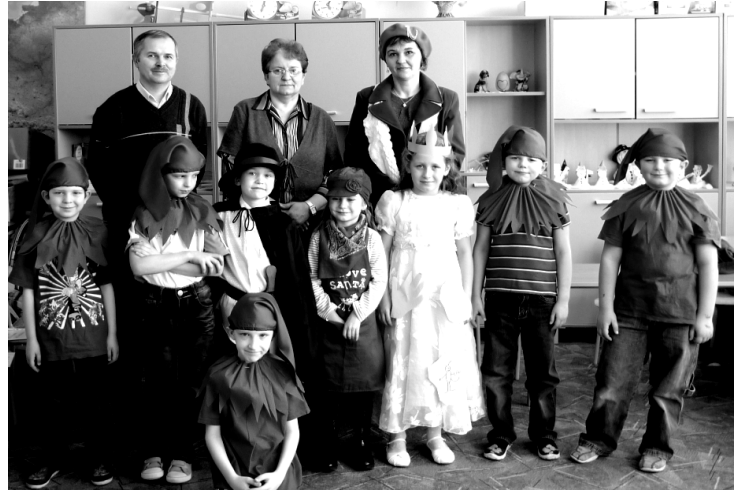
Fot; Pasowanie na Czytelnika.

F erie zimowe to czas odpoczynku dla uczniów ze Szkoły Podstawowej w Węgliskach. Jeżeli aura pogoda sprzyja, jest to czas beztrudnych zabaw na śniegu, jazdy na sankach, łyżwach i nartach. Nie wszystkie jednak dzieci miały możliwość wyjazdu na zorganizowany wypoczynek, większość z nich spędzała ferie w domu. Aby zachęcić naszych podopiecznych do aktywnego, a zarazem bezpiecznego wypoczynku nasza placówka przygotowała ciekawą ofertę spędzenia wolnego czasu. Uczniowie mieli do wyboru różnorodne formy zajęć poprzez ćwiczenie zarówno ciała jak i umysłu. W ramach cotygodniowych lekcji pływania dwukrotnie zorganizowaliśmy grupowy wyjazd na basen do Łańcuta. Dla tych dzieci, które preferują ruch i ćwiczenia sprawnościowe przygotowaliśmy zabawy z wykorzystaniem różnorodnych przyborów sportowych. Chętni uczniowie przychodzili do szkoły aby wziąć udział w zmaganiach umysłowych takich jak: szachy, warcaby, gry memory, puzzle, loteryjki edukacyjne, itp. Jeden z feryjnych dni był poświęcony na „spotkanie” z historią.