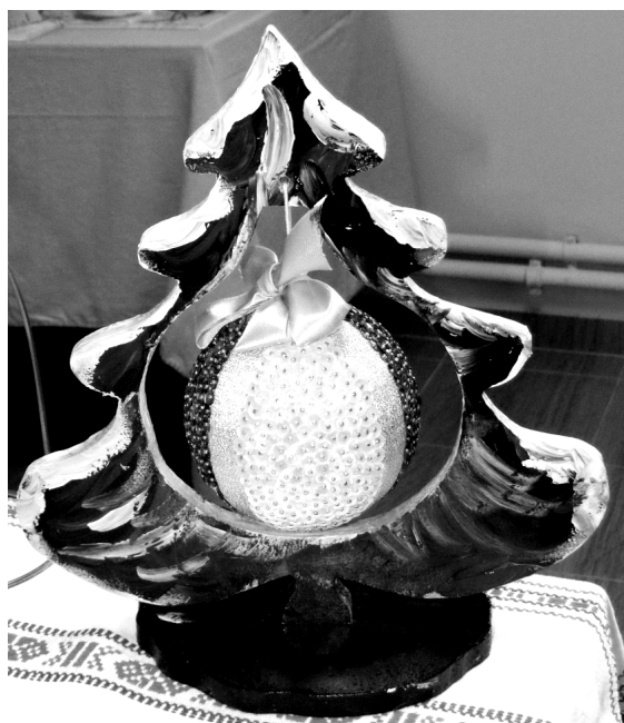
Fot; Wyróżniona bombka w konkursie bożonarodzeniowym - Środowiskowy Dom Samopomocy w Rakszawie.