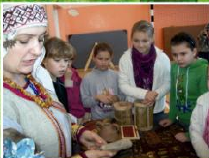
Warsztaty historyczne