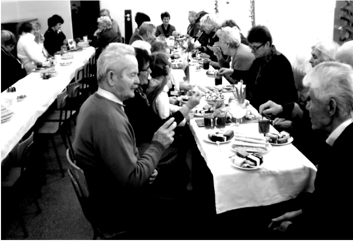
Fot. Dzień Babci i Dziadka w Szkole Podstawowej w Węgliskach.