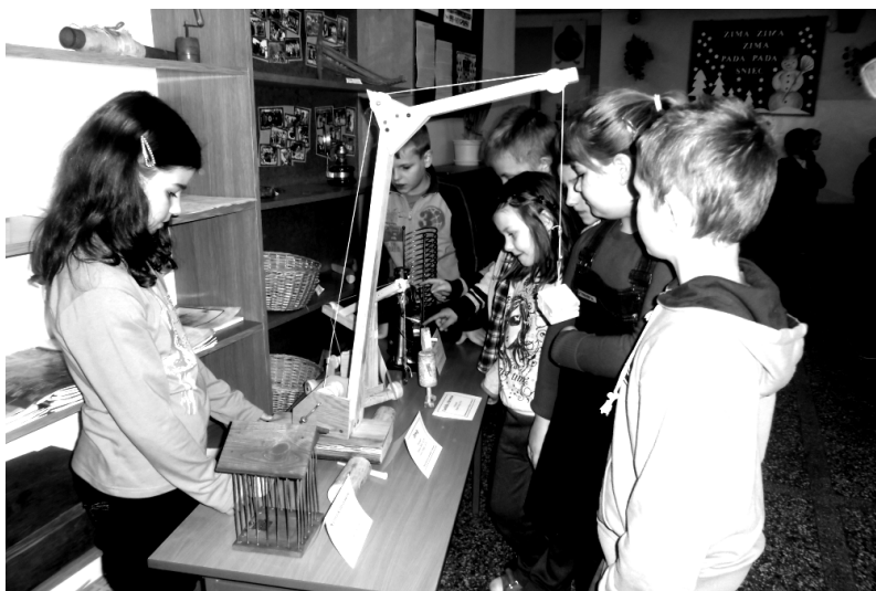
Fot; Konkurs „Mój wynalazek, który chciałbym mieć w swoim domu”.

Ś wiadomość odpowiedzialności za ciekawe i nowatorskie zadania twórcze spowodowało, że uczniowie poczuli się dorośli, a wdrażanie nowych pomysłów rozbudziło ich ogólnotechniczne zainteresowania.