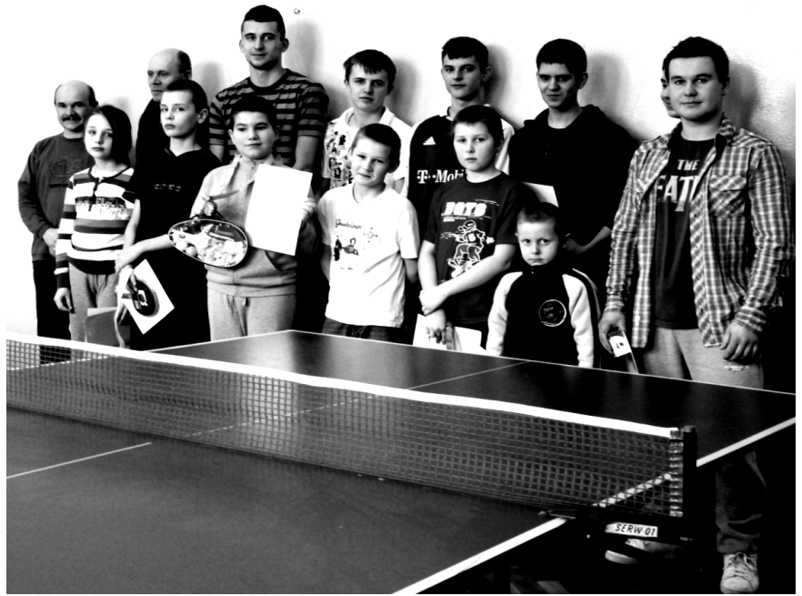
Fot; Turniej tenisa stołowego dla mieszkańców społeczności lokalnej.

P ierwszego tygodnia ferii na uczniów Szkoły Podstawowej w Wydrzu czekało wiele atrakcji. Poniedziałek przebiegł pod hasłem różnego rodzaju gier. Do wyboru dzieci miały: gry logiczne, ruchowe i planszowe. Niektórym szczególnie spodobały się Scrabble, gra językowa ćwicząca logiczne myślenie. Uczniowie brali także udział w warsztatach plastycznych. Ferie w naszej szkole odbyły się również pod znakiem sportu. We wtorek uczniowie klas 4-6 pojechali na basen do Sokołowa Małopolskiego pod opieką rodziców, nauczycieli i pana dyrektora. Natomiast czwartkowy wyjazd na basen zorganizowano dla uczniów młodszych klas. Nie odstraszyła ich nawet bardzo mroźna pogoda (-20°C). W trakcie ferii z zorganizowanych zajęć sportowych mogli korzystać nie tylko uczniowie naszej szkoły, ale również mieszkańcy Wydrza. Szkoła Podstawowa w Wydrzu we współpracy ze Stowarzyszeniem Absolwentów i Przyjaciół Szkoły Podstawowej w Wydrzu zorganizowała turniej tenisa stołowego dla mieszkańców społeczności lokalnej.