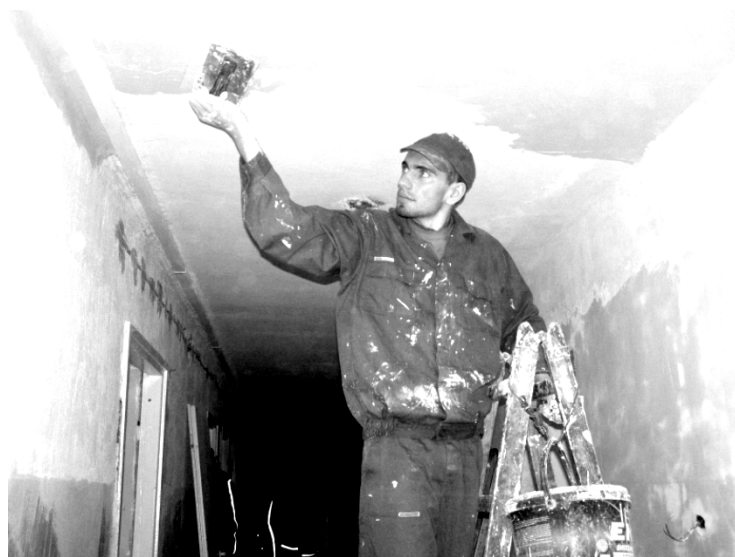
Fot; Remont korytarza w Schronisku Młodzieżowym.