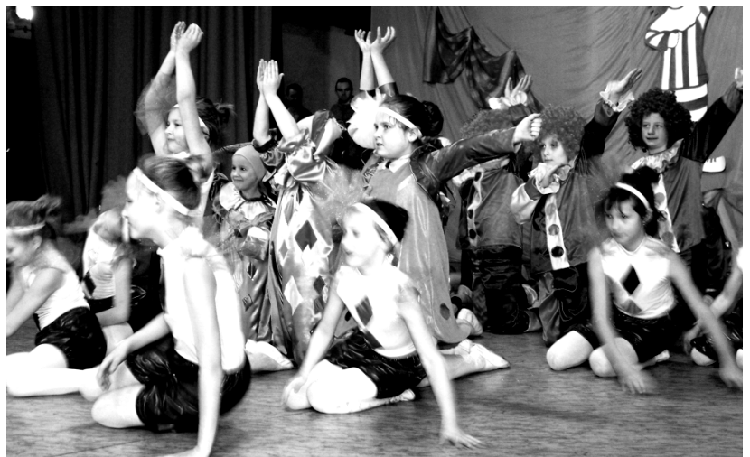
Fot: I miejsce- „Małe Tokio” z Rakszawy.