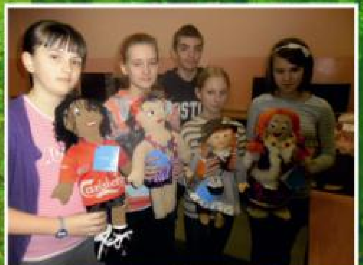
Uczniowie Szkoły Podstawowej Nr 2 w Rakoniewicach w projekcie edukacyjnym pod patronatem UNICEF Wszystkie Kolory Świata