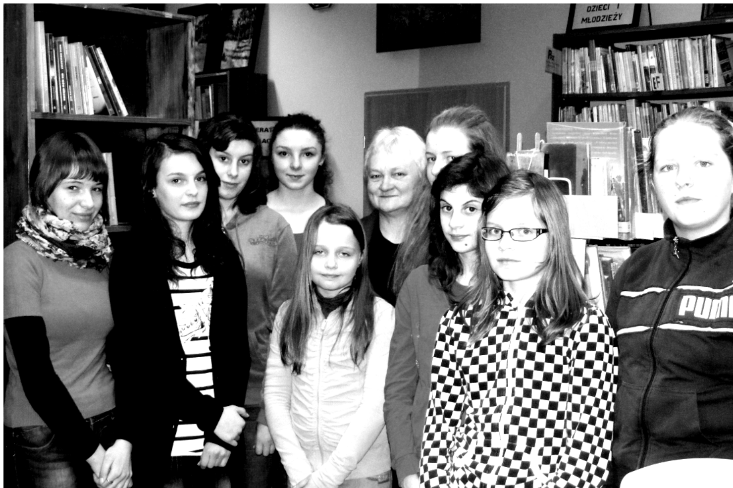
Fot; Najlepsi czytelnicy w 2011 roku.