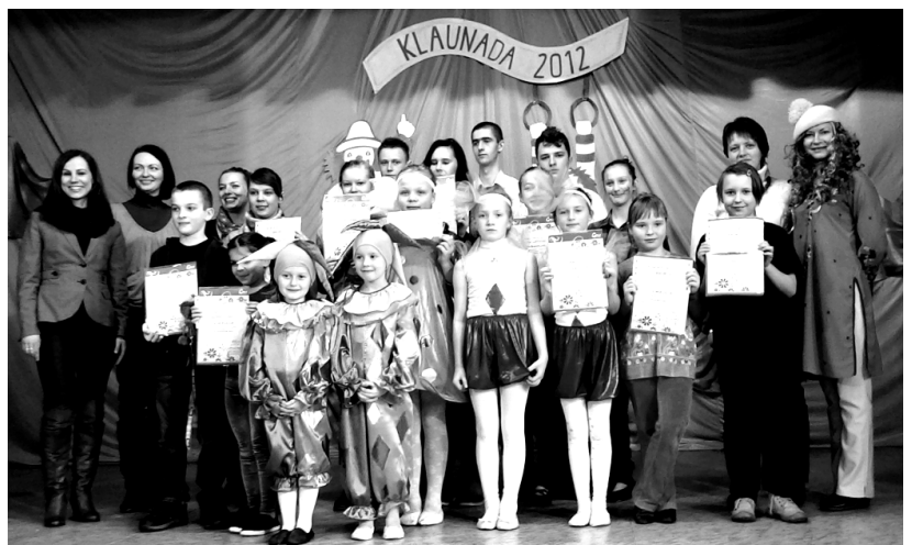
Fot: Laureaci IX Przeglądu Zespołów Tanecznych Klaunada 2012.