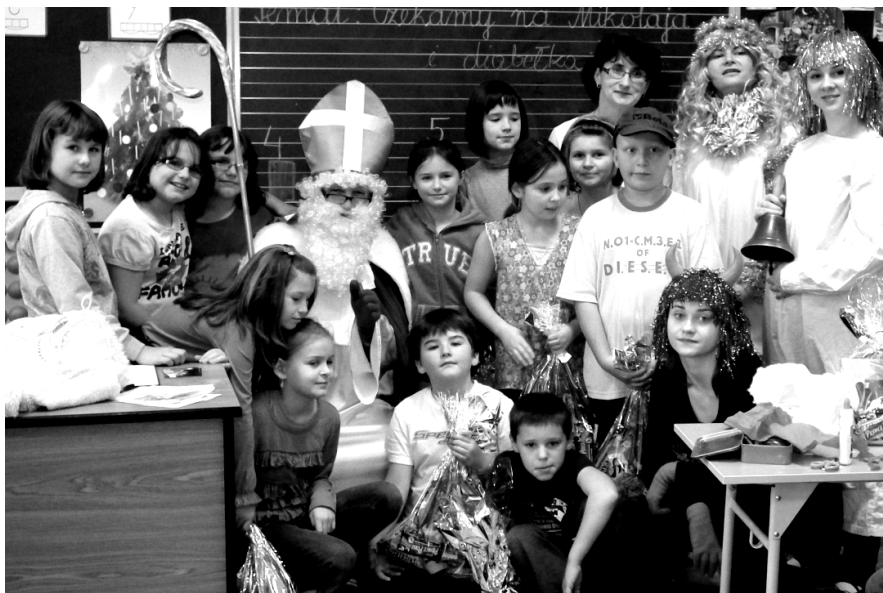
Fot; Odwiedziny Św. Mikołaja w Szkole Podstawowej Nr 2 w Rakszawie.