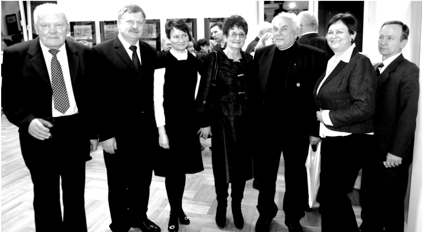
Fot; Promocja albumu poświęconego Fabryce Sukna w Rakszawie-19 luty 2012r.