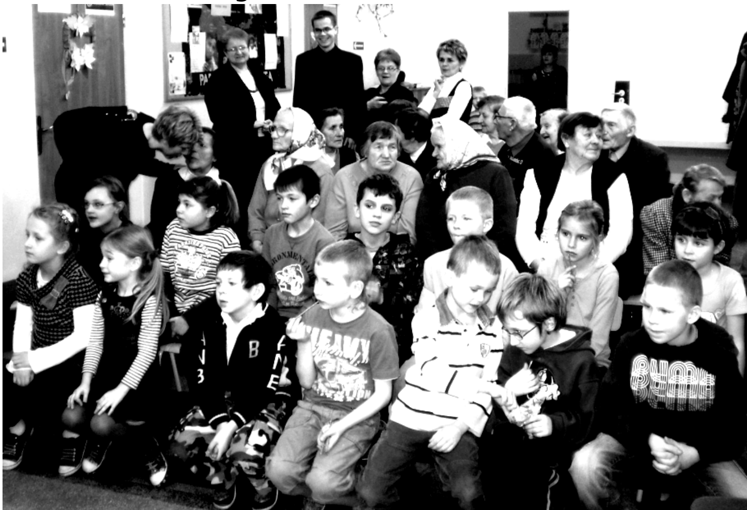
Opr. Wigilia dla osób samotnych w Szkole Podstawowej w Węgliskach.