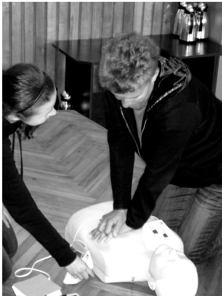
Fot: Kurs pierwszej pomocy.