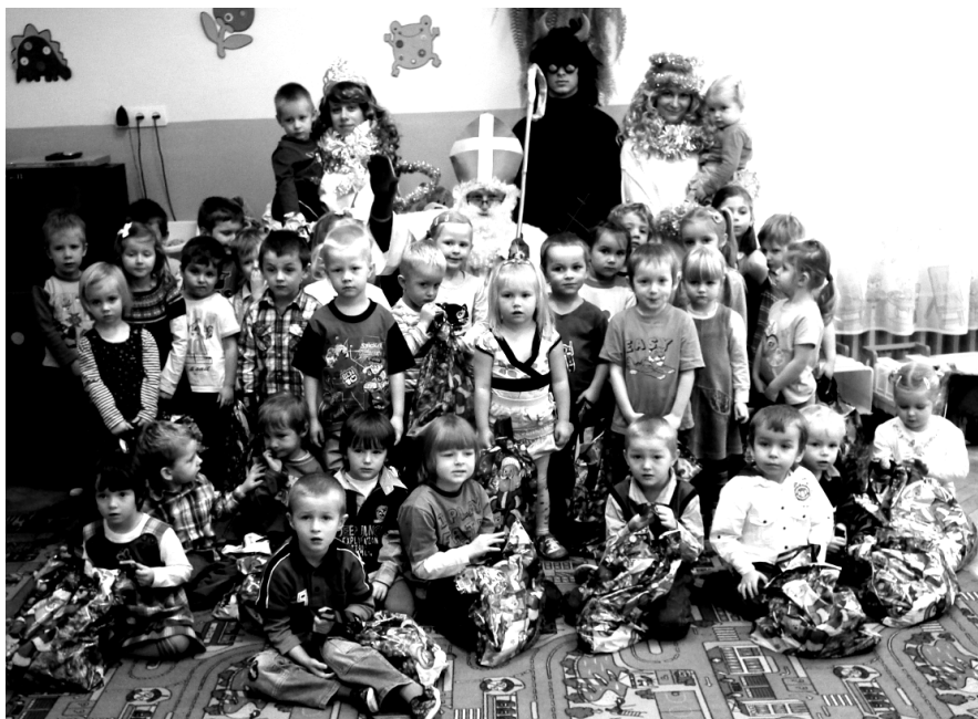
Fot; Odwiedziny Św. Mikołaja w przedszkolu w Rakszawie.