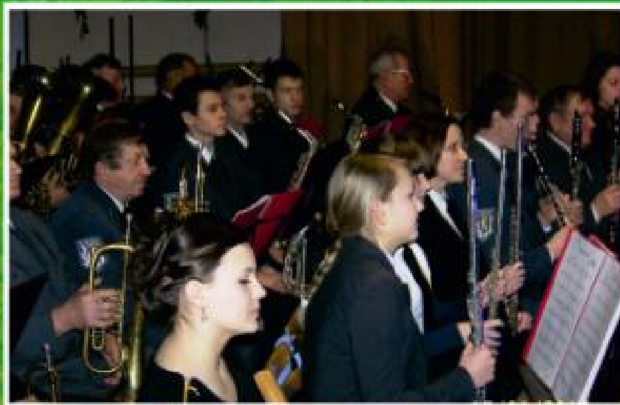
Orkiestra Dęta Zgoda - podczas Koncertu Kolęd- Raduj się