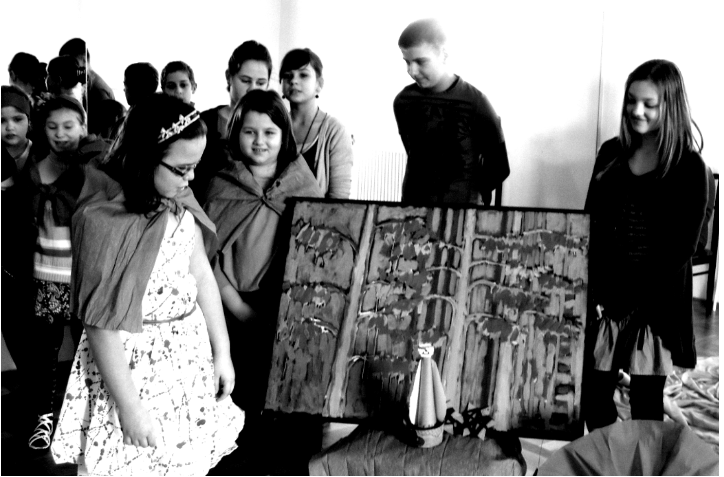
Fot; Bal Karnawałowy przeprowadzony w formie interaktywnej zabawy „Ćwierćland” - drużyna NIEBIESKICH.