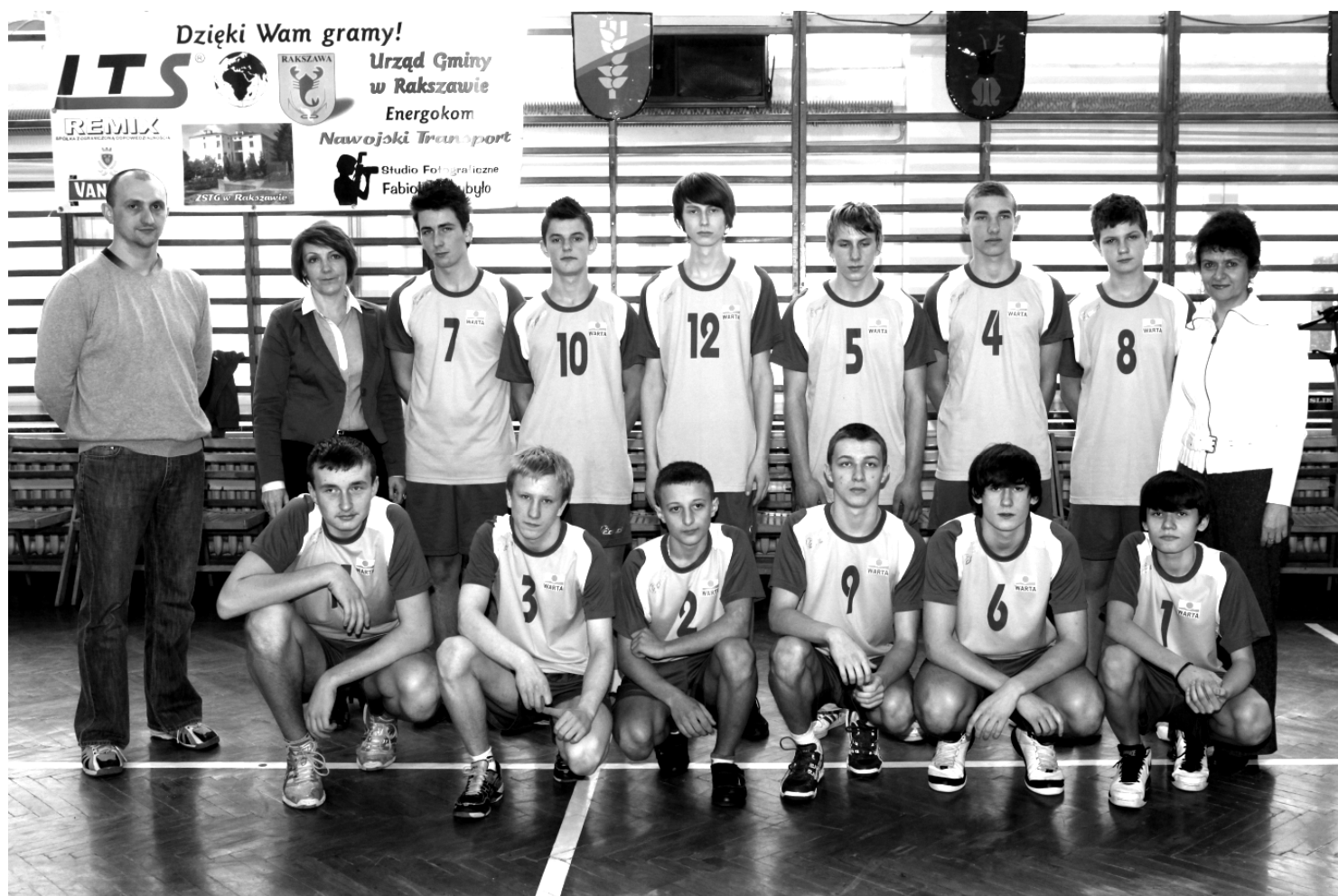
Fot; 1 miejsce w kategorii szkół gimnazjalnych - Publiczne Gimnazjum w Rakaszawie.