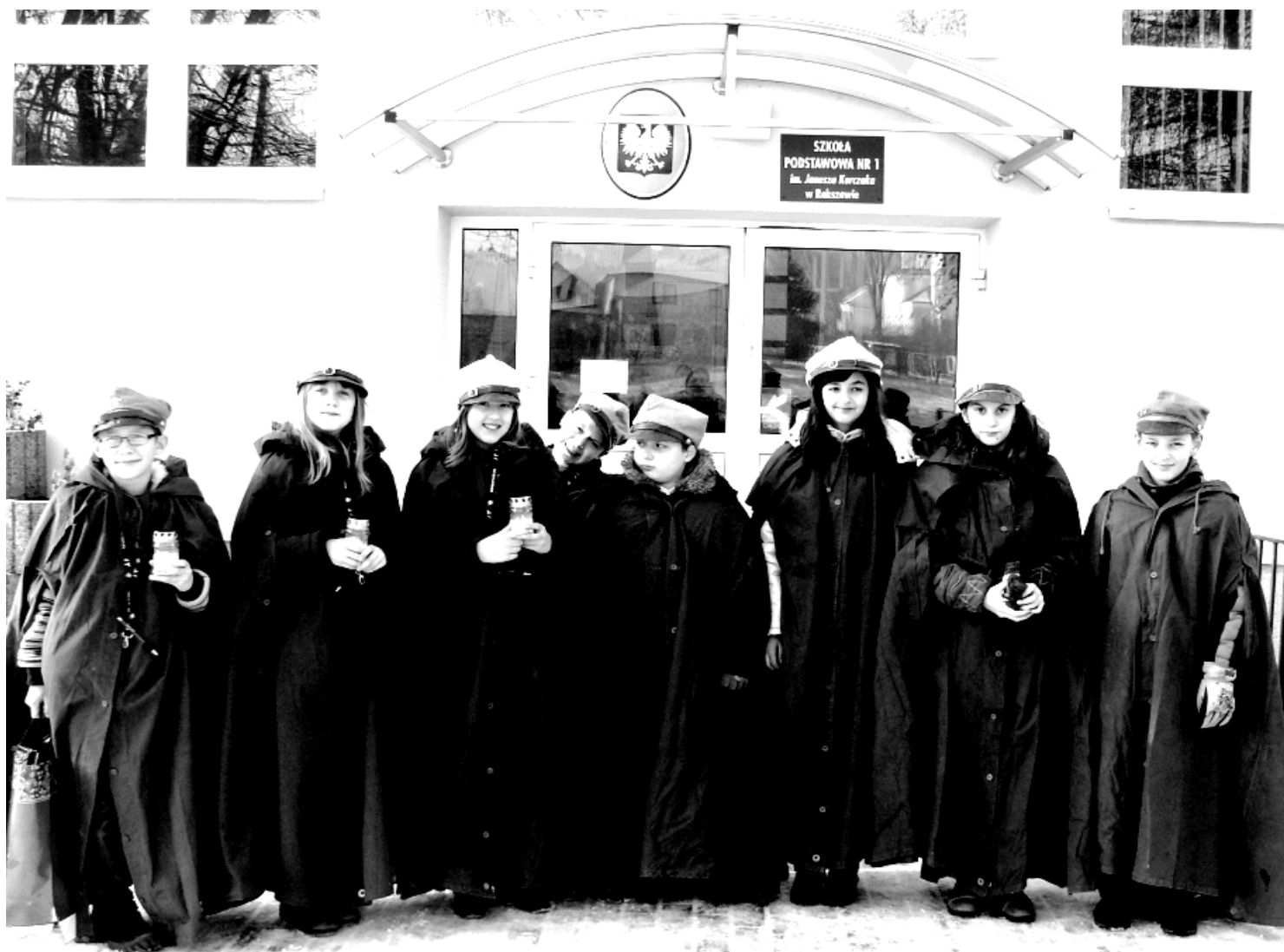
Fot; Światelko betlejemskie.