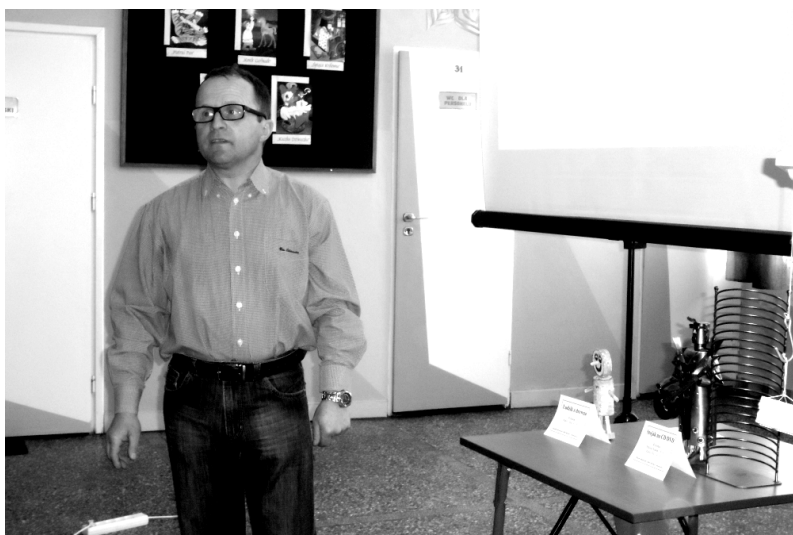
Fot; Wiesław Wawrzaszek autor innowacji „Mali odkrywcy i wynalazcy”.

U czniowie chętnie przychodzili na zajęcia i zaangażowani byli w realizację programu. Dużą satysfakcję sprawiała im działalność praktyczna, czego efektem były wytwory, takie jak: dźwigi, ludzik, klatka dla ptaszka, stojak na płyty DVD i projekt teoretyczny „Super łóżko”.