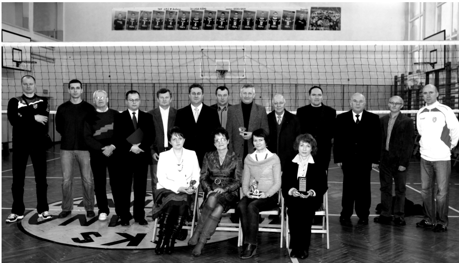
Fot; Goście i Sponsorzy XXII Memoriału Józefa Gondeli.