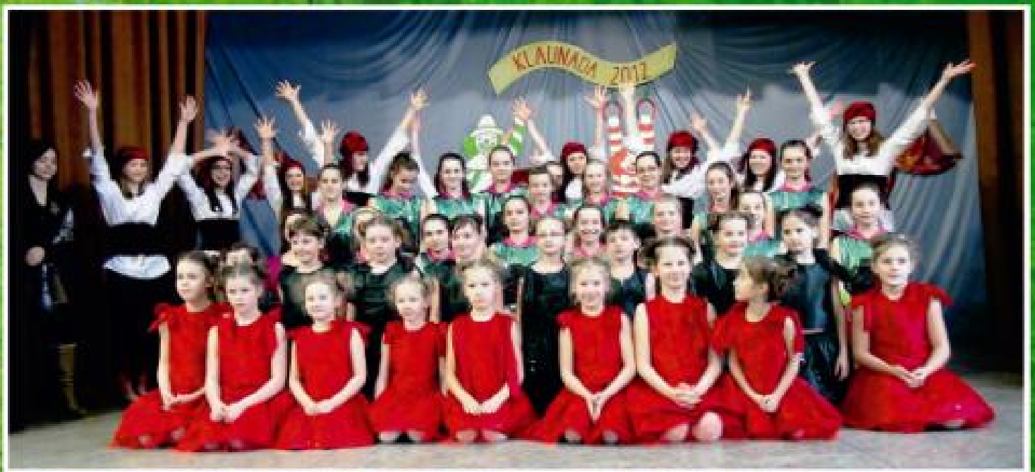
Klaunada 2012