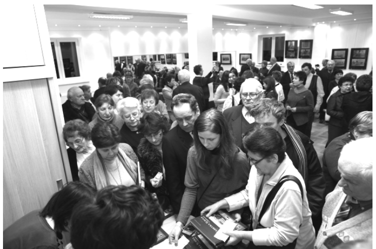
Fot; Promocja albumu poświęconego Fabryce Sukna w Rakszawie.

Opr. Agnieszka Rzepka – Dyrektor GOKiC w Rakszawie