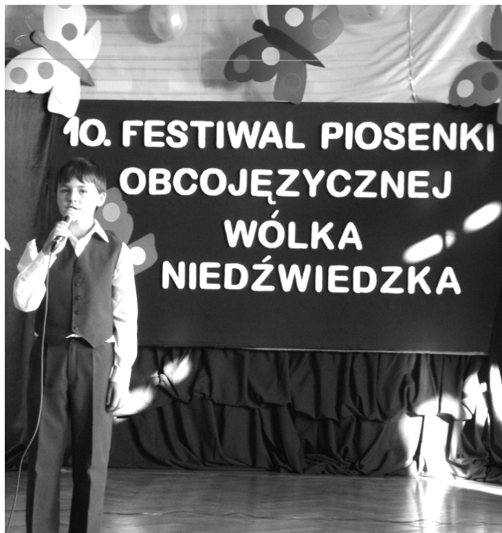
Fot: Artur Pudło na X Festiwalu Piosenki Obcojęzycznej w Wólce Niedźwiedzkiej.