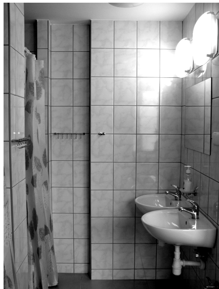
Fot; Wyremontowana łazienka.