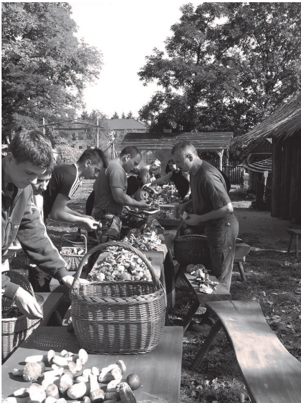
Fot; Komisyjne liczenie grzybów w Osadzie Rakszawa.

W ramach obchodów Dni Powiatu Łańcuckiego w dniach 25 - 29 września 2009 roku z inicjatywy Samorządu Uczniowskiego przy Zespole Szkół Tekstylny - Gospodarczych im. Bolesława Żardeckiego w Rakszawie w dniu 28 września odbyły się II Powiatowe Międzyszkolne Zawody w Grzybobraniu.