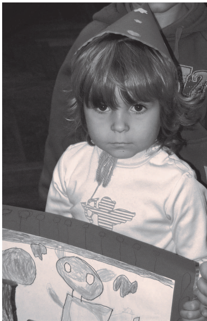
Fot: Wręczenie prezentów Kubusowi Puchatkowi.

A by tradycji stało się zadość urodzinowe przyjęcie otwarło wręczenie prezentów, które dzieci przygotowały specjalnie dla Puchatka. Takie małe co nieco – laurki, portrety Kubusia, misiove smakołyki czyli baryłki miodu. Było mnóstwo życzeń i uścisków oraz wierszyków i piosenek. Po składaniu życzeń wszyscy wysłuchali jednej z przygód gromadki przyjaciół Puchatka oraz wzięli udział w konkursach zręcznościowych. Ponadto dzieci opowiadały o przyniesionych przez siebie na urodziny ulubionych pluszowych przytulankach. Całości dopełniały zabawy z postaciami z bajek. Na zakończenie Miś obdarował wszystkich wspaniałym tortem urodzinowym.