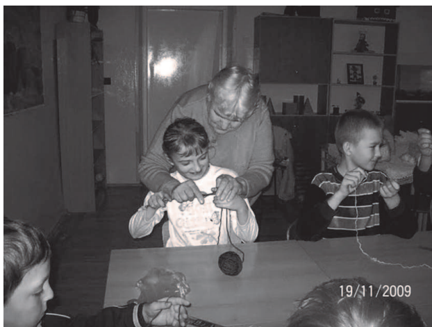
sztuka ręcznego wykonywania dzianin.

W spółczesne życie oparte na pośpiechu, konsumpcjonizmie, utracie więzi rodzinnych poprzez wyjazdy zarobkowe i małą wrażliwość na drugiego człowieka, wymaga od szkoły i rodziny kultuwowania tego wszystkiego, co wzbogaca naszą tożsamość z miejscem naszego urodzenia i życia. Jest to po pierwsze rodzina, później szkoła i środowisko, w którym mieszkamy i dalej ojczysty kraj.