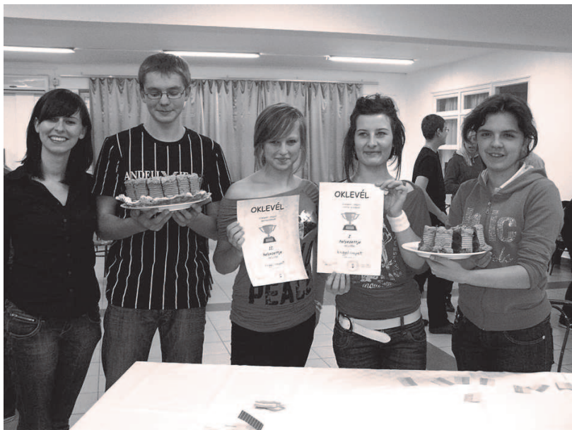
Fot: W nagrodę dyplomy i tort dla uczestników projektu „Polak – Węgier dwa bratanki ...”

W dniach od 12 do 17 października 2009 roku już po raz trzeci gościliśmy w Jaszapati na Węgrzech w ramach międzyszkolnego projektu „Polak – Węgier dwa bratanki ...”. Dla kolejnej grupy uczniów Zespołu Szkół Tekstylno-Gospodarczych w Rakszawie wyjazd na Węgry był bardzo ciekawym i ekscytującym doświadczeniem.