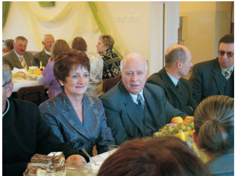
Fot: Zaproszeni goście na uroczystość jubileuszową szkoły.