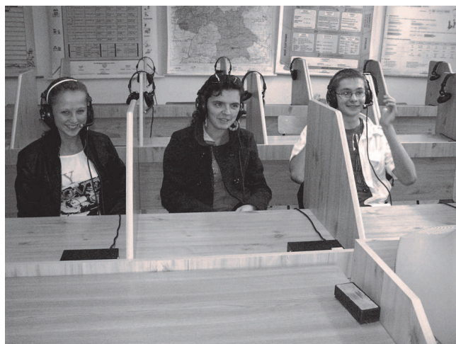
Fot: Lekcja języka angielskiego na Węgrzech.

W ostatnim dniu pobytu Węgrzy przygotowali wiele ciekawych i śmiesznych konkursów i zabaw integracyjnych których uwieńczeniem była wspólna dyskoteka.