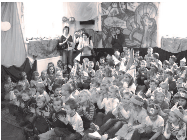
Fot: Zaproszeni goście przez Kubusia Puchatka.

J eszcze po uczcie dzieci przedstawiały Puchatkowi jego wizerunki. Cudowna atmosfera, jaką udało się stworzyć, wróży, że takich urodzinowych spotkań będzie jeszcze więcej. Jak udało się przyjęcie o tym można przekonać się z zamieszczonych zdjęć.