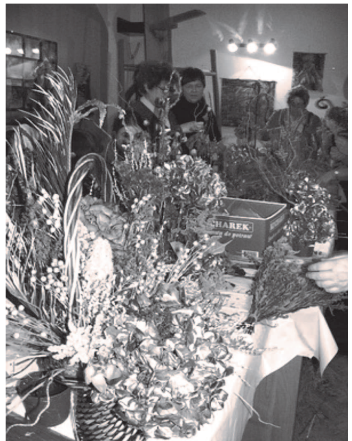
Fot: Warsztaty florystyczne.

Opr. Agnieszka Rzepka Dyrektor GOKiC w Rakszawie