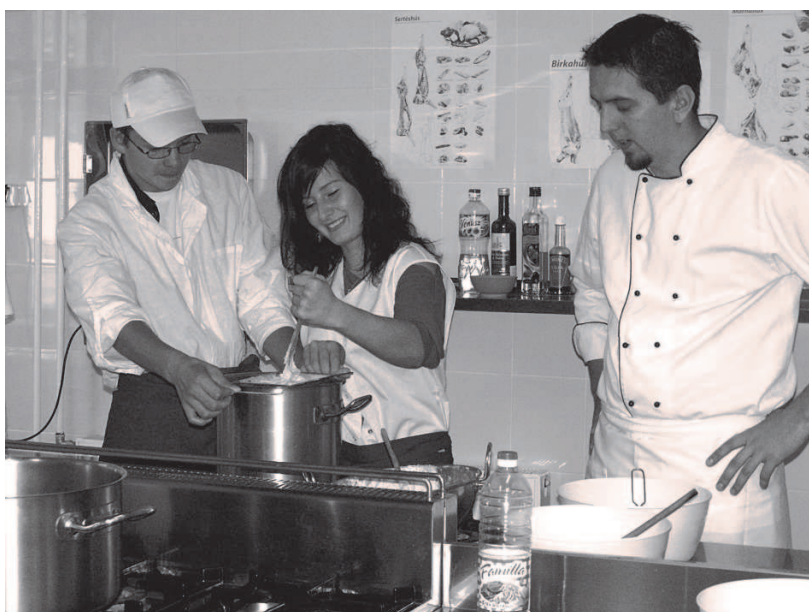
Fot: W trakcie przygotowywania węgierskich kluszczyk.

P ięć dni w węgierskiej szkole to nie tylko nauka, ale również poznawanie tradycji i kultury węgierskiej. Ze względu na specyfikę naszej i węgierskiej szkoły tematem przewodnim naszego pobytu była tradycyjna kuchnia węgierska.