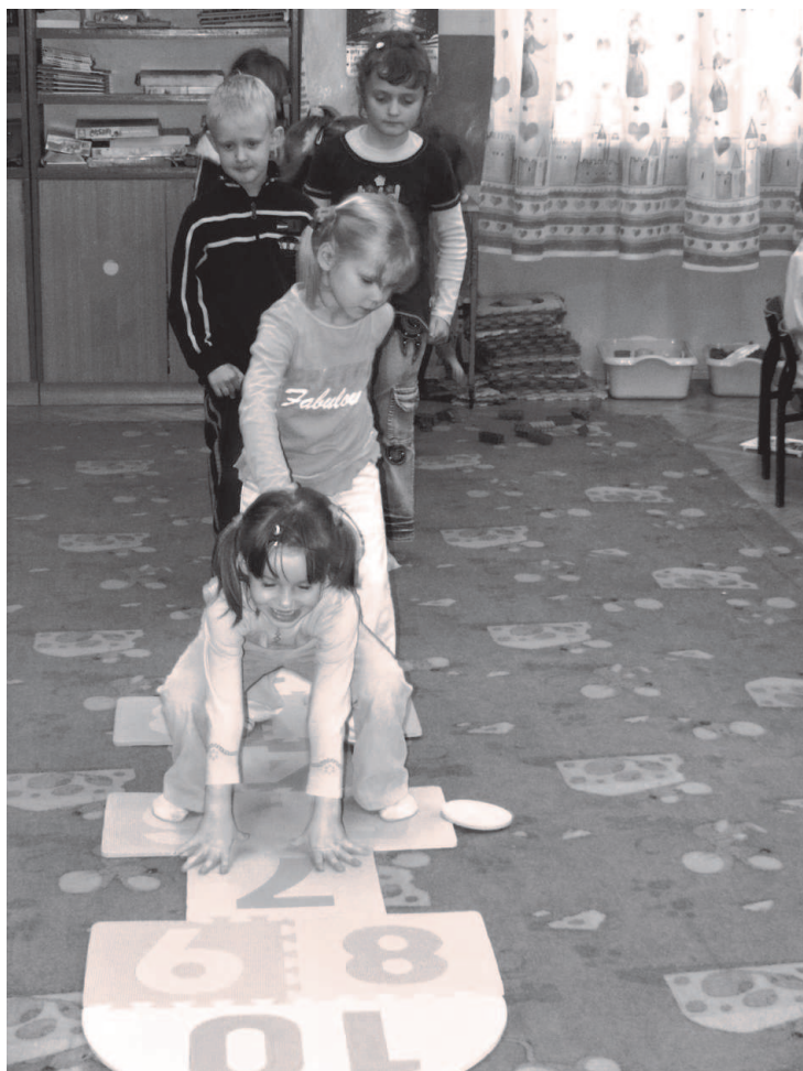
Fot: Przedszkolaki z Przedszkola Nr 1 w Rakszawie.

kowych zajęć pozalekcyjnych opartych o własny autorski pomysł nauczyciela.