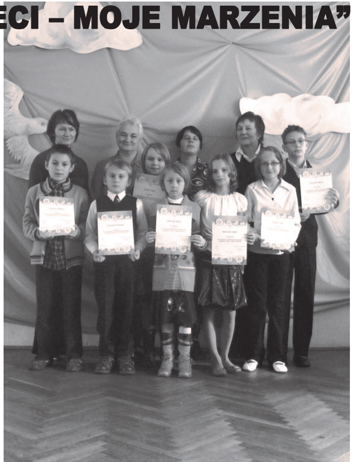
Fot: Laureaci XVI Gminnego Konkursu Recytatorskiego.

Opr. Agnieszka Rzepka Dyrektor GOKiC w Rakszawie