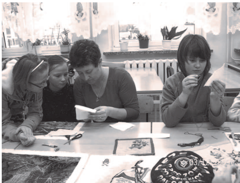
rękodzieło ludowe.