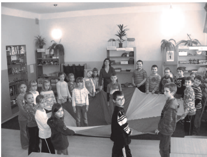
Fot: Uczniowie Zespołu Szkoły Podstawowej Nr 1 i Przedszkola w Rakszawie.

W Szkole Podstawowej Nr 1 w tym roku rozpoczęła się realizacja trzyletniego projektu unijnego „Pierwsze uczniowskie doświadczenia drogą do wiedzy”. Jego celem jest wieloaspektowe wspieranie rozwoju umysłowego, emocjonalnego, społecznego, fizycznego i motorycznego dzieci rozpoczynających naukę szkolną, w oparciu o teorię inteligencji wielorakich Howarda Gardnera. Wykorzystanie tej teorii umożliwia dzieciom działanie we wszystkich dziedzinach aktywności: językowej, matematyczno – przyrodniczej, artystycznej, ruchowej, komunikacyjno – informacyjnej oraz społecznej. W projekcie uczestniczy 22 dzieci. Zajęcia prowadzone są w ramach podstawy programowej i dodat-