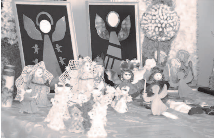
Fot; Ozdoby świąteczne przez Wychowanków ze Środowiskowego Domu Samopomocy w Rakszawie.