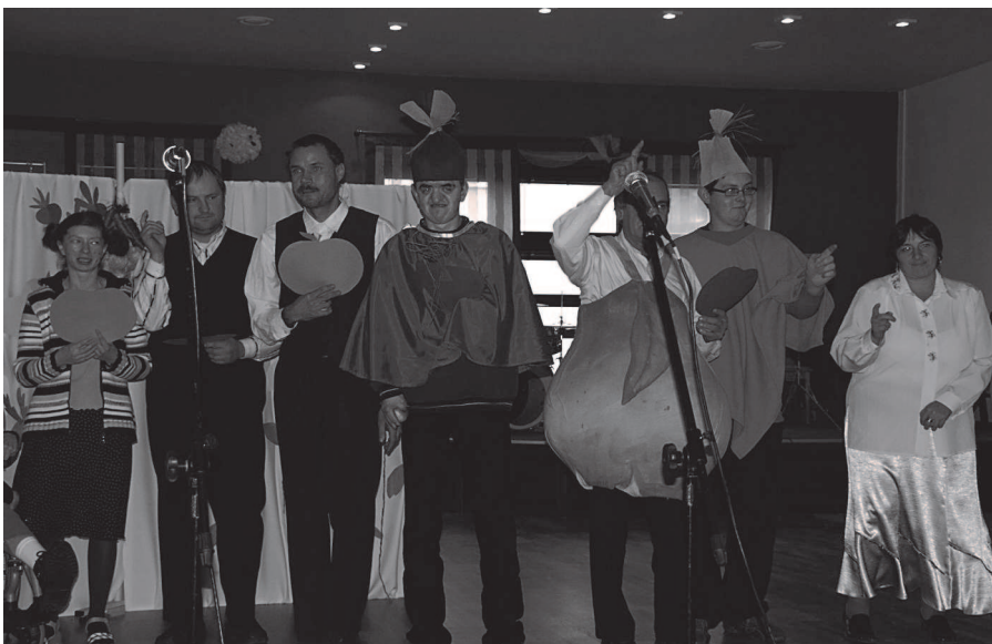
Fot; Wychowankowie ze Środowiskowego Domu Samopomocy w Rakszawie.

P odopieczni Środowiskowego Domu Samopomocy często biorą udział w wernisażach i przeglądach twórczości artystycznej osób niepełnosprawnych.