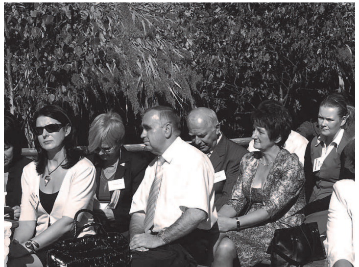
Fot: Uczestnicy Konferencji pt. „Kreowanie Nowej Tożsamości Wsi Polskiej”.

Oprawę artystyczną zapewnił zespół ludowy „Piganecki” z Pigan (powiat przeworski) i kapela Leonarda Wermińskiego z Sieniawy. W przygotowaniach i obsłudze Konferencji wzięła udział społeczność Rakszawy, OSP w Rakszawie, jak również młodzież z Zespołu Szkół Tekstylno- Gospodarczych im. Bolesława Żardeckiego w Rakszawie i Zespołu Szkół Nr 2 im. Jana Kochanowskiego w Łańcucie.