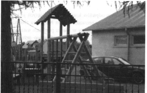
Fot: Plac zabaw przy Szkole Podstawowej Nr 3 w Rakszawie.