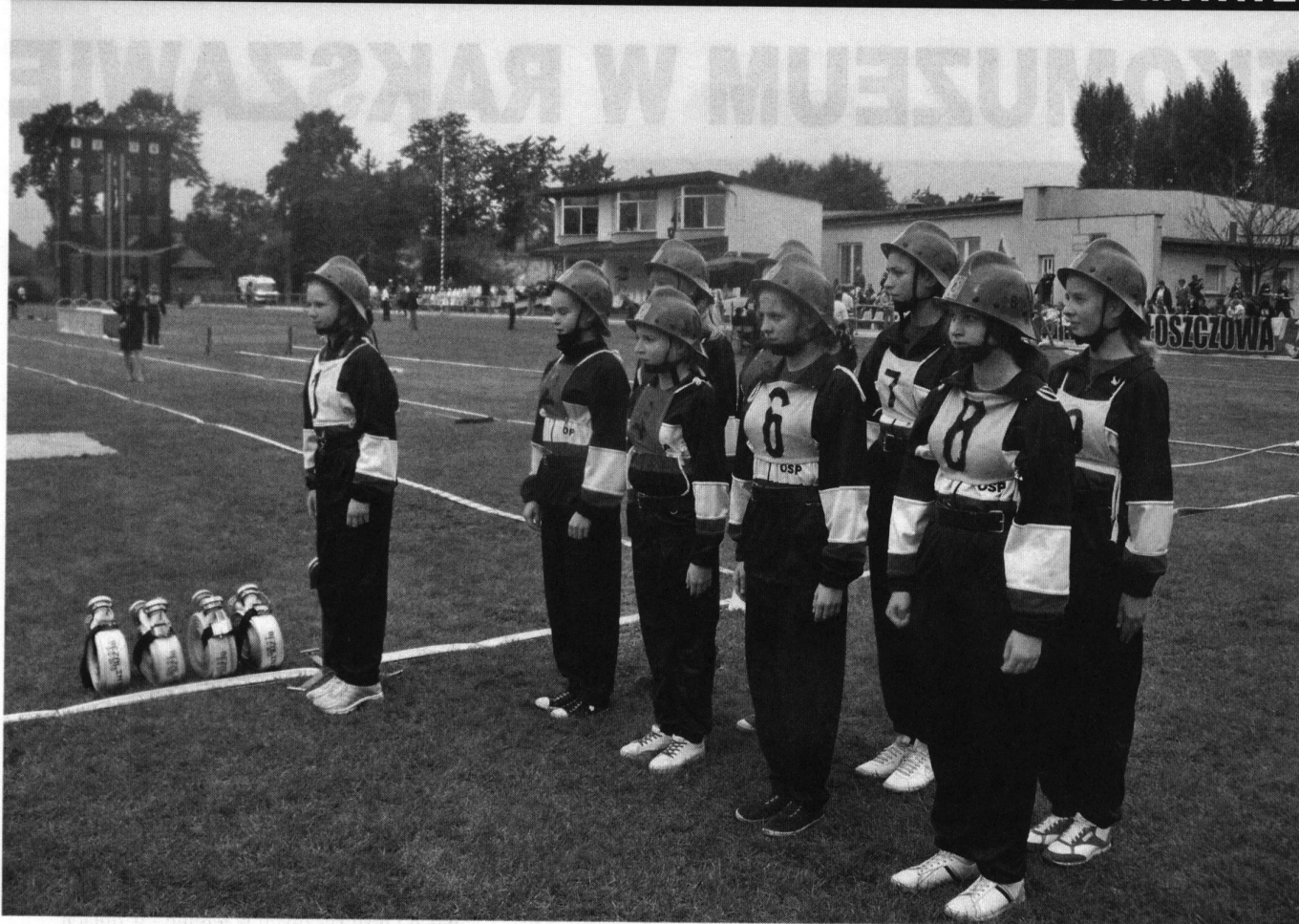
Fot; MDP przy OSP w Rakszawie gotowa do ćwiczeń bojowych na IX Mistrzostwach Polski w Częstochowie.

Bardzo dobra była także sztafeta -77,94 s. Średnia wieku naszej wynosiła 14 lat i ten właśnie element zdecydował o punktacji końcowej. ( Do I miejsca zabrakło zaledwie 0,82 s ! ).