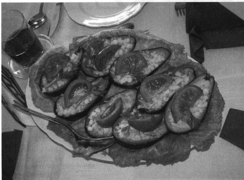
Fot: Warsztaty kulinarne, avokado z nadzieniem.