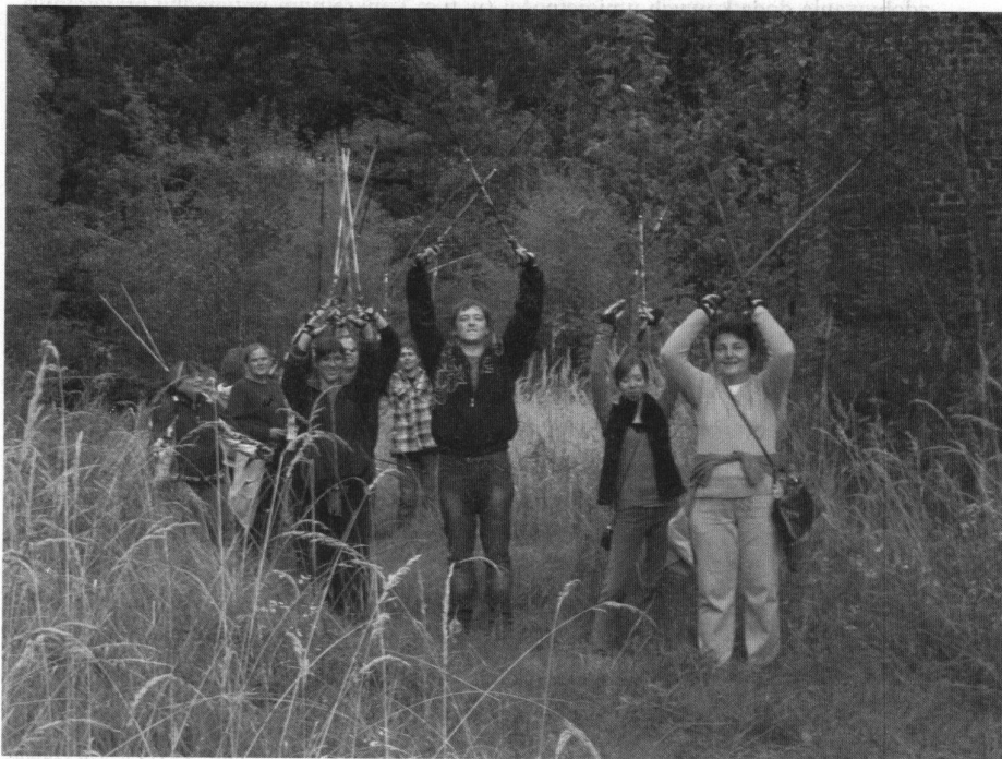
Fot: Marsz nordic walking, fot. Bogumiła Babiarz.

Z kolei druga przejechała ścieżką „Las Dąbrowski- pod Grabiną”. Przewodnikiem po tej ścieżce była Anna Skoczyła.