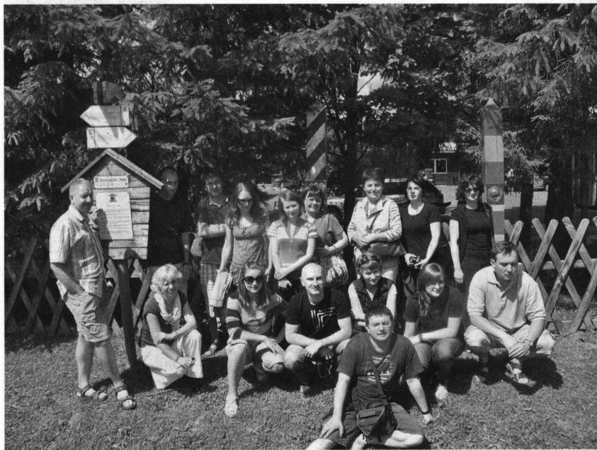
Fot: Warsztaty szkoleniowe w Bieszczadach - Ekomuzeum Hole - grupa z Frysztaka i Rakszawy- fot. Jan Jabłoński.

Czy jesteśmy gotowi na wysiłek, aby nasza miejscowość i nasza gmina stała się atrakcyjną i przyjazną, zarówno dla własnych mieszkańców, jak i gości chcących wypocząć i miło spędzić czas? Myślę, że tak. Mam takie odczucie wraz z grupą osób, która zebrała się podczas realizacji projektu „Ekomuzeum Osada Rakszawa”. W II połowie czerwca 2010r. został ogłoszony konkurs na wsparcie szkoleniowo - doradcze wybranych obszarów ekomuzealnych w województwie podkarpackim. Do konkursu przystąpił GOKiC w Rakszawie z inicjatywą utworzenia takiego ekomuzeum w oparciu o dość dobrze rozwijającą się Osadę Rakszawa. Konkurs ten, stanowi część projektu pn. „ Ekomuzea, zintegrowane obszary agroturystyczne i klastry jako narzędzia rozwoju i promocji regionów atrakcyjnych historycznie, kulturowo i przyrodniczo ”, dzięki wsparciu udzielonemu przez Islandię, Lichtenstein i Norwegię poprzez dofinansowanie ze środków Mechanizmu Finansowego Europejskiego Obszaru Gospodarczego oraz Norweskiego Mechanizmu Finansowego, a także budżetu Rzeczypospolitej Polskiej w ramach Funduszu dla Organizacji Pozarządowych w ramach Komponentu II – Ochrona środowiska i zrównoważony rozwój w obszarze tematycznym - Działania na rzecz poprawy świadomości społecznej.