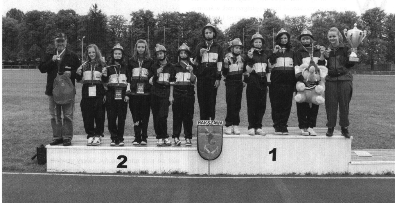
Fot: Dziewczeta z Rakszawy na podium wśród najlepszych MDP w czasie IX Ogólnopolskich Zawodów Sportowo -Pożarniczych w Częstochowie.

W spaniały sukces odniosły dziewczęta z Młodzieżowej Drużyny Pożarniczej przy OSP w Rakszawie, które startując na IX Ogólnopolskich Zawodach Sportowo-Pożarniczych MDP udowodniły, że należą do najlepszych w naszym kraju.