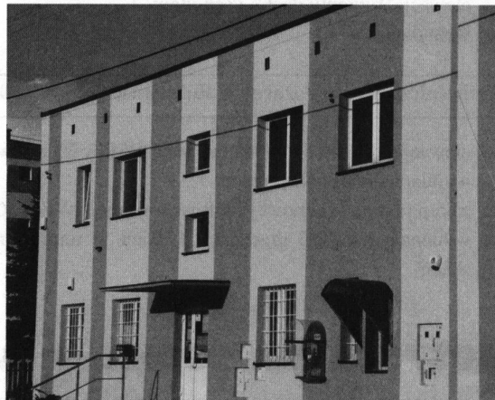
Fot: Budynek poczty w Rakszawie.