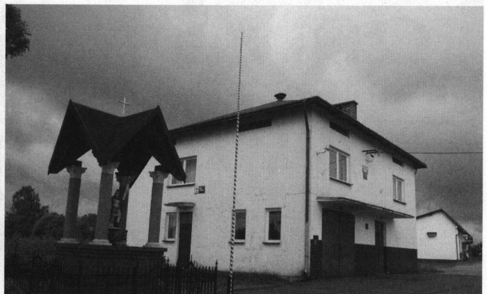
Fot: Remiza strażacka w Węgliskach.

II miejsce i Wicemistrzostwo Polski -drużyna dziewcząt (Mistrzostwa Polski Młodzieżowych Drużyn Pożarniczych w Częstochowie).