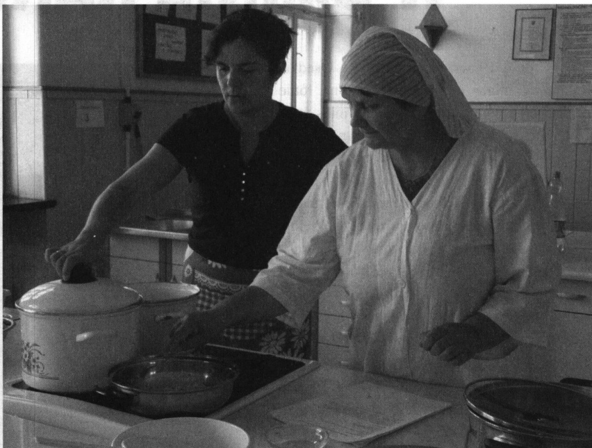
Fot: Warsztaty kulinarne, fot; Jacek Nicpoń.

P ragniemy czytelnikom biuletynu bardziej szczegółowo scharakteryzować zakończone już „Warsztaty dziedzictwa kulinarnego”. Celem przewodnim ww. warsztatów był wzrost aktywności lokalnych organizacji poza-