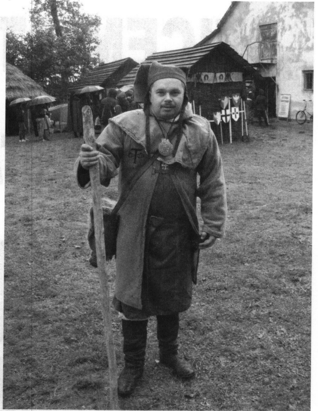
Fot: Piknik Historyczny fot; Aleksandra Tymińska.

W tym miejscu należy podziękować grupie rekonstrukcyjnej za jej zaangażowanie i zlekceważenie deszczu jak to przystało na prawdziwych rycerzy. Podziękowania kierujemy również do tych mieszkańców, którzy przybyli na piknik i na których zawsze możemy liczyć pomimo dobrej czy złej pogody.