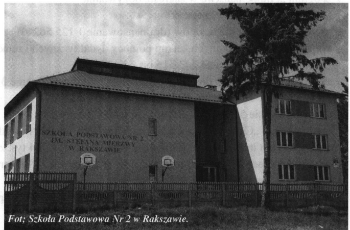
Fot: Szkoła Podstawowa Nr 2 w Rakszawie.