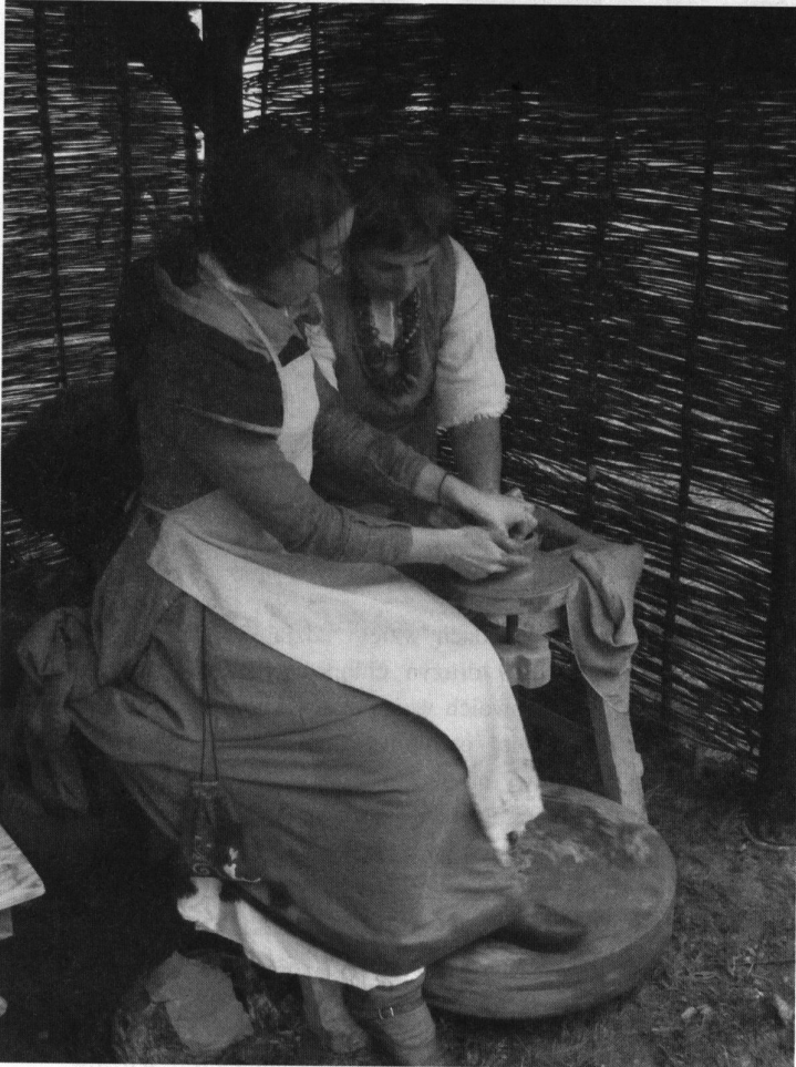
Fot; Piknik historyczny - nauka toczenia na kole garncarskim fot; Aleksandra Tymińska.

W idowiskowy początek miał miejsce w niedzielne popołudnie kiedy został napadnięty pielgrzym. W scenie tej goście przedstawili historię pielgrzymek w średniowieczu oraz nawiązali do ubioru niewiast i mężczyzn. Kolejna scena to „dwa nagie miecze”, której zapewne nie trzeba komentować. Takich scen rodzajowych było kilkanaście. Niestety nie wszystkie mogły być zaprezentowane ze względu na niesprzyjającą pogodę.