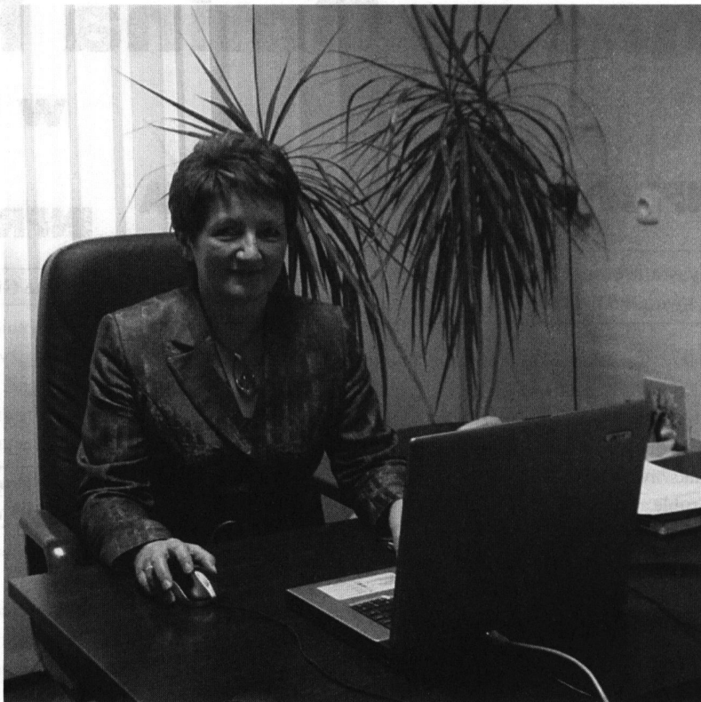
Fot: Wójt Gminy Rakszawa Maria Kula.

W szelkie działania były podejmowane w myśl zasad przezroczności i gospodarności, a kierunek postępowania wytyczały nam uchwały podejmowane przez Radę Gminy, opinie mieszkańców, Rad Sołeckich i organizacji społecznych.