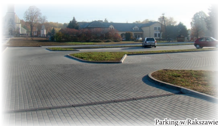
Parking w Rakszawie