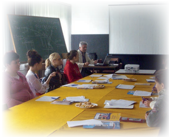
Projekt realizowany przez GOPS

Ponadto Ośrodek Pomocy Społecznej w Rakszawie jest realizatorem usług opiekuńczych w miejscu zamieszkania. Potrzeby mieszkańców w zakresie pomocy w formie usług opiekuńczych stale rosną. W roku 2015-2018 liczba osób korzystająca z tej formy pomocy wynosiła 41 osób, a obecnie zapewniamy pomoc usługową dla 23 osób. W ciągu 4 lat wydatkowaliśmy 952 tys. zł na ten cel. W razie konieczności zapewnienia całodobowej opieki Ośrodek Pomocy Społecznej, kieruje do Domu Pomocy Społecznej. W latach 2015-2018 wydatkowaliśmy na tę formę pomocy 913 tys. zł . Liczba rodzin korzystających z pomocy w Gminnym