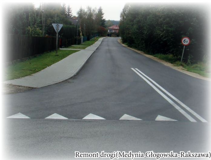
Remont drogi(Medynia Głogowska-Rakszawa)