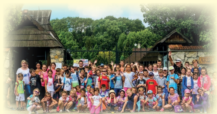
Wakacje w GOKiC - Bolestraszyce

wy, konkurs czytelniczy, konkurs na najaktywniejszego czytelnika – miłośnika książek. Dużym zainteresowaniem cieszą się wszelkiego rodzaju warsztaty artystyczne. W dalszym ciągu podtrzymywane są ze względu na niesłabnące zainteresowanie: Jarmark Bożonarodzeniowy połączony z odwiedzinami św. Mikołaja, wystawy artystyczne, akcje „Ferie zimowe w GOKiC” i półkolonia „Wakacje w GOKiC”, akcja czytelnicza pn. „Cała Polska czyta dzieciom”, poranki z bajką dla dzieci przedszkolnych i uczniów I i II klasy szkoły podstawowej, spotkania z ciekawymi osobowościami itp.