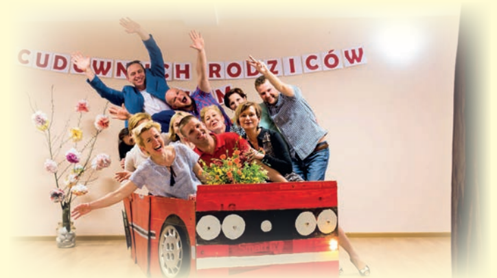
Świetlica GOKiC w Rakszawie Kąty

lokalnej historii ”, premiera teatralna, obchody Święta Konstytucji 3 Maja, „ Tydzień bibliotek ” – cykl spotkań, koncert wielopokoleniowy „ Cudownych rodziców mam ”, „ Sobótkowe Szaleństwo ” – podsumowanie roku artystycznego w GOKiC, Podsumowanie Roku Artystycznego Pracowni Plastycznej, festiwal Letnie Spotkania Teatralne „ Kołowrotek ”, „ Pasjonada – Romantyczne popołudnie ”, „ Narodowe Czytanie ”, „ Urodziny Kubusia Puchatka ”, Wspólny Śpiew Pieśni Patriotycznych – obchody Święta Niepodległości, Katarzynki-Andrzejki, Mikołajki. Wśród konkursów na uwagę zasługują: XV Gminny Konkurs Wielkanocny „ Palmy Pisanki Stroiki ”, XI Gminny Konkurs Muzyczny „ Do Re Mi ”, XXVIII Gminny Konkurs Recytatorski „ Raki ”, XIV Gminny Konkurs Bożonarodzenio-