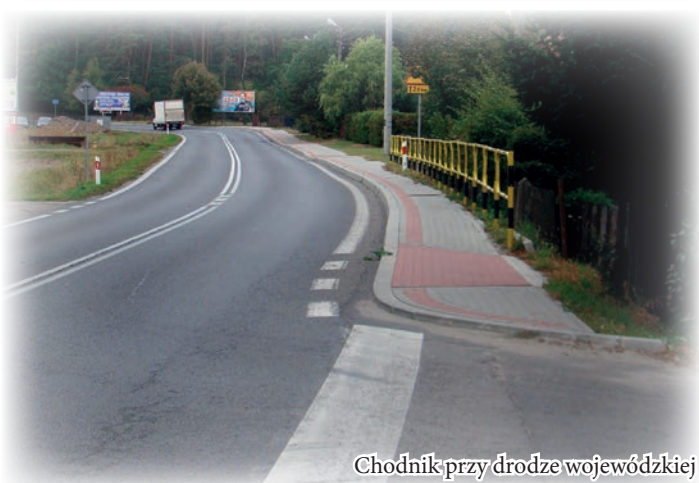
Chodnik przy drodze wojewódzkiej