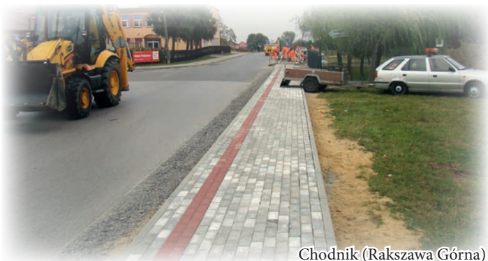
Chodnik (Rakszawa Górna)