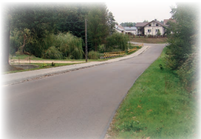
Droga (Rakszawa-Wydrze-Brzózka Stadnicka)