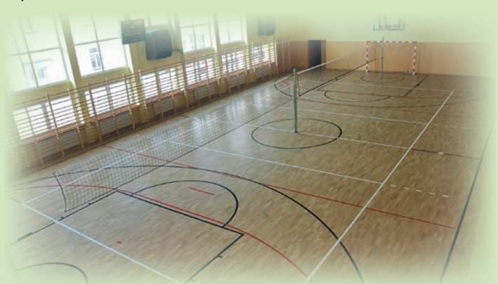
Hala w ZSTG

W 2018 roku została wykonana dokumentację projektową budowy nowej sali przy Szkole Podstawowej nr 2 w Rakszawie za kwotę 70 tys. zł . W pełni nowoczesna sala o wymiarach wewnętrznych boiska do piłki siatkowej z zapleczem sanitarno-szatniowym będzie wyposażona w system wentylacji mechanicznej.