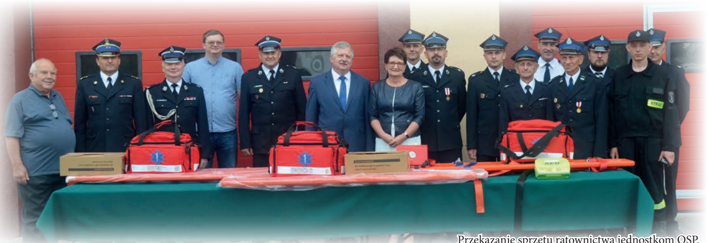
Przekazanie sprzętu ratownictwa jednostkom OSP.