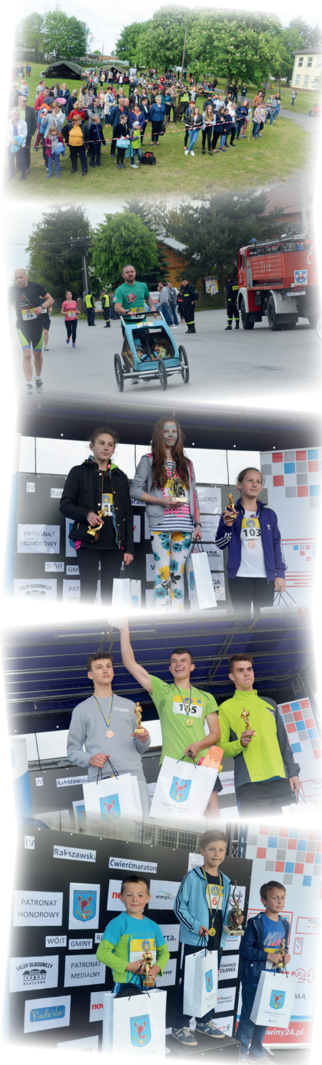
KATEGORIA: Do lat 13 - dziewczęta