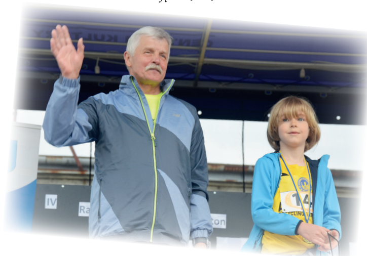
Najstarszy i najmłodszy uczestnik biegu