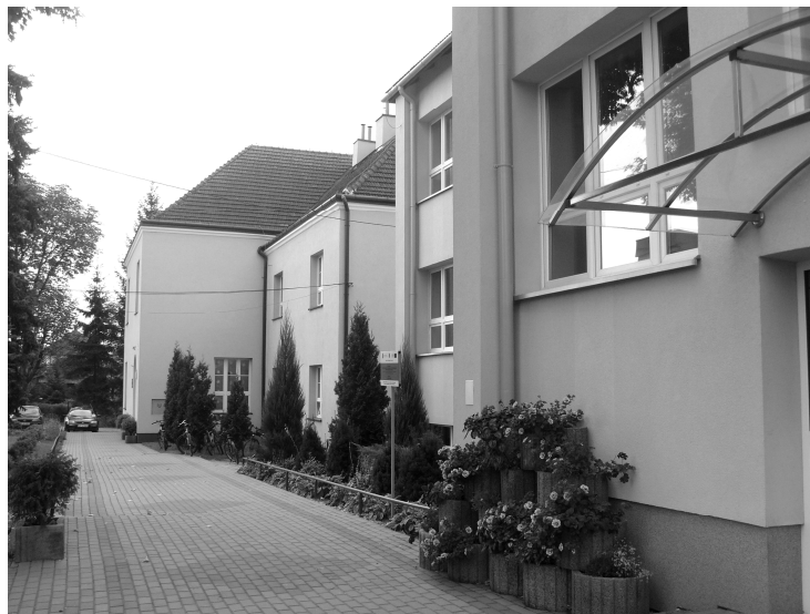
Fot; Ukwiecenie terenu wokół Szkoły Podstawowej Nr 1 w Rakszawie.

⇒ okucie kominów na budynku szkoły wraz z założeniem odgro- mienia