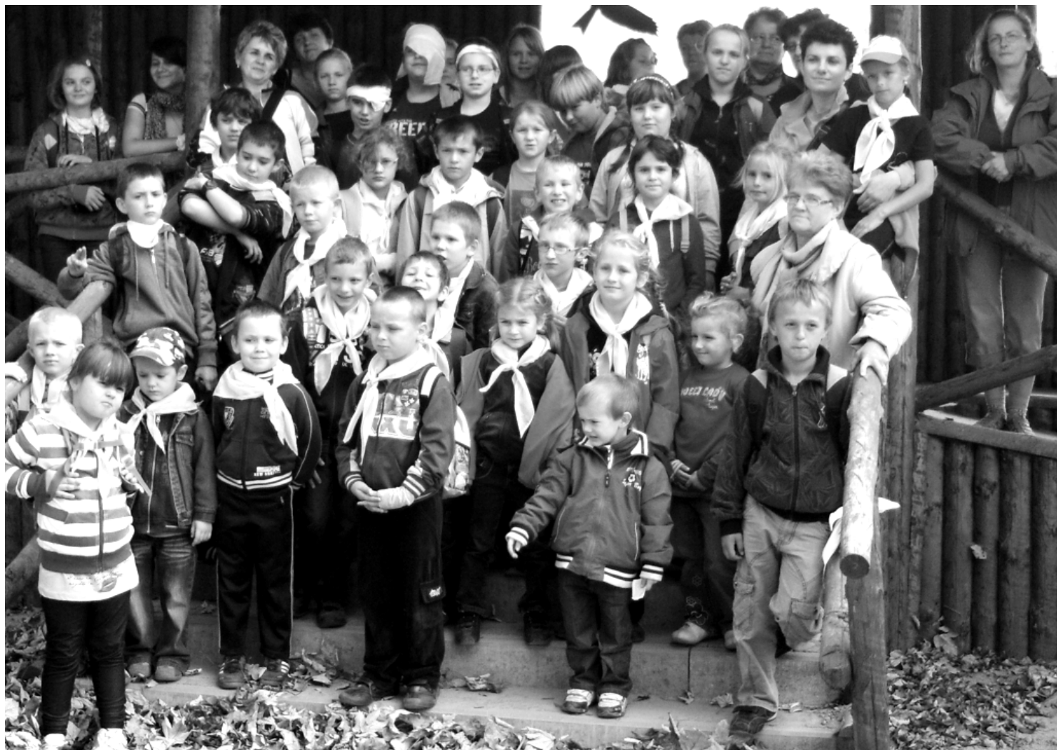
Fot; Uczestnicy wycieczki do Zamościa i Zwierzyńca organizowaną przez Szkołę Podstawową w Węgliskach.

W roku szkolnym 2011/2012 w Szkole Podstawowej w Węgliskach w dniu 6 października 2011r. została zorganizowana wycieczka do Zamościa i Zwierzyńca. Brali w niej udział chętni uczniowie i nauczyciele naszej szkoły. Program wycieczki był bardzo bogaty i urozmaicony.