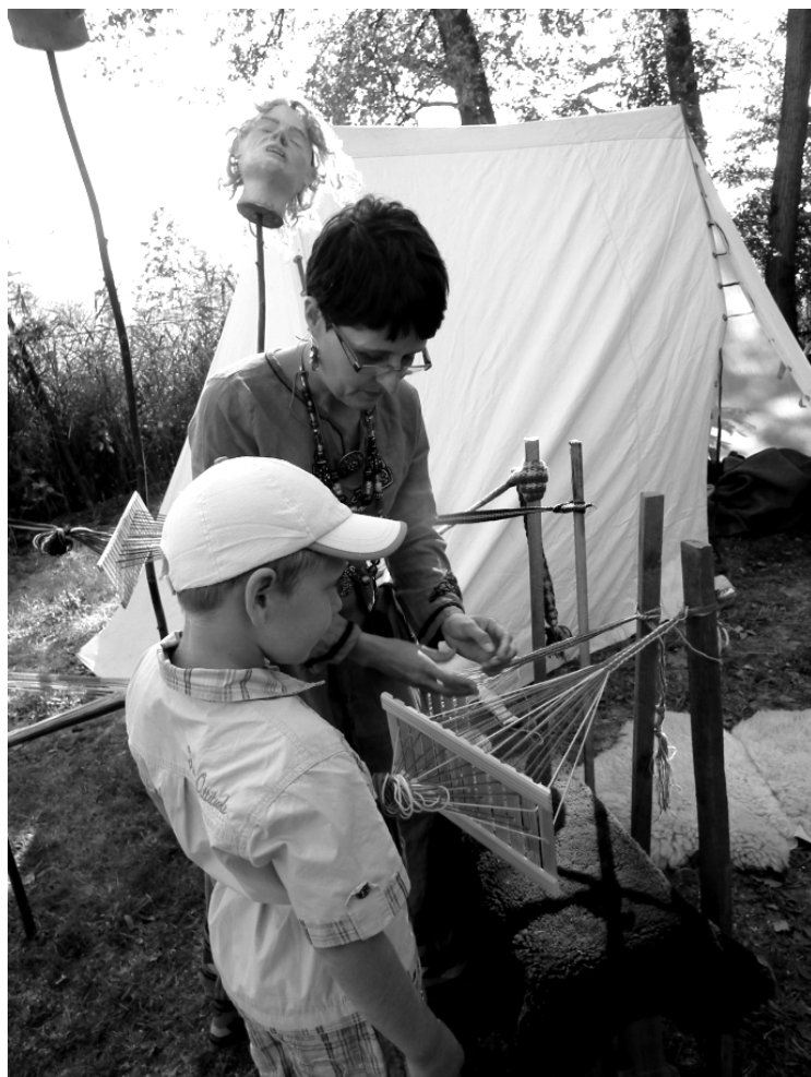
Fot; Warsztaty tkackie na Osadzie Rakszawa, fot. K. Bzdek.

Mini Flesz -piątek-14:30 – 16:00 (sala widowiskowa GOKiC)