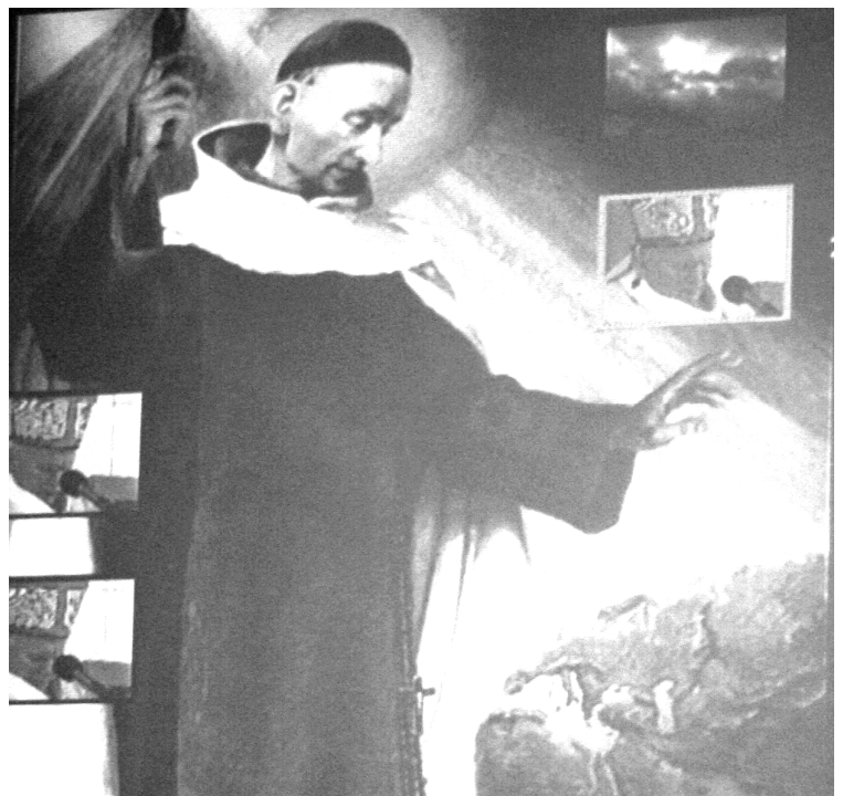
Fot; Św. Rafał Kalinowski- patron Gminy Rakszawa.

Ś w. Rafał Kalinowski uważany jest za odnowiciela Zakonu Karmelitańskiego w Polsce. Kościół, przez apostolską posługę Ojca Świętego Jana Pawła II, postawił św. Rafała u progu dziejów III Rzeczypospolitej jako Patrona i Orędownika, ukazującego swym życiem ogromne wartości duchowe, umysłowe, patriotyczne i etyczne. Św. Rafał Kalinowski żył w czasach o wiele trudniejszych niż nasze: w szkole nie mógł się uczyć w języku ojczystym, na ulicach swego miasta od najmłodszych lat widział wojskowe oddziały zaborcy; gimnazjum, w którym się kształcił, znajdowało się naprzeciw klasztoru zamienionego na więzienie polityczne, z którego wychodziło się albo na szubienicę, albo na Sybir. Sam doświadczył prawie dziesięcioletniej katorgi syberyjskiej. (źródło: Tygodnik Katolicki Niedziela).