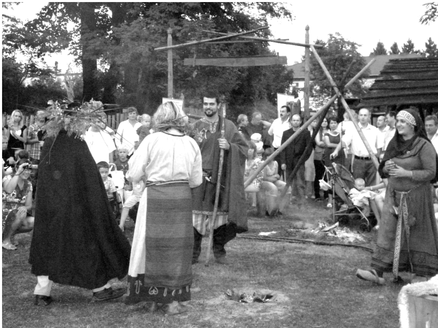
Fot; Piknik Historyczny na Osadzie Rakszawa- Drużyny Grodu Horodna z Rzeszowa, fot. B. Babiarz.

J uż po raz kolejny w dniu 4 września 2011 r. w Osadzie Rakszawa odbył się Piknik Historyczny. Wspañiała pogoda i wysoka temperatura towarzyszyła biorącym udział w zabawie. W tym roku zapoznaliśmy się z obyczajami Słowian, które przedstawiła uczestnikom pikniku grupa rekonstrukcyjna Drużyny Grodu Horodna z Rzeszowa i miejscowi rzemieślnicy.