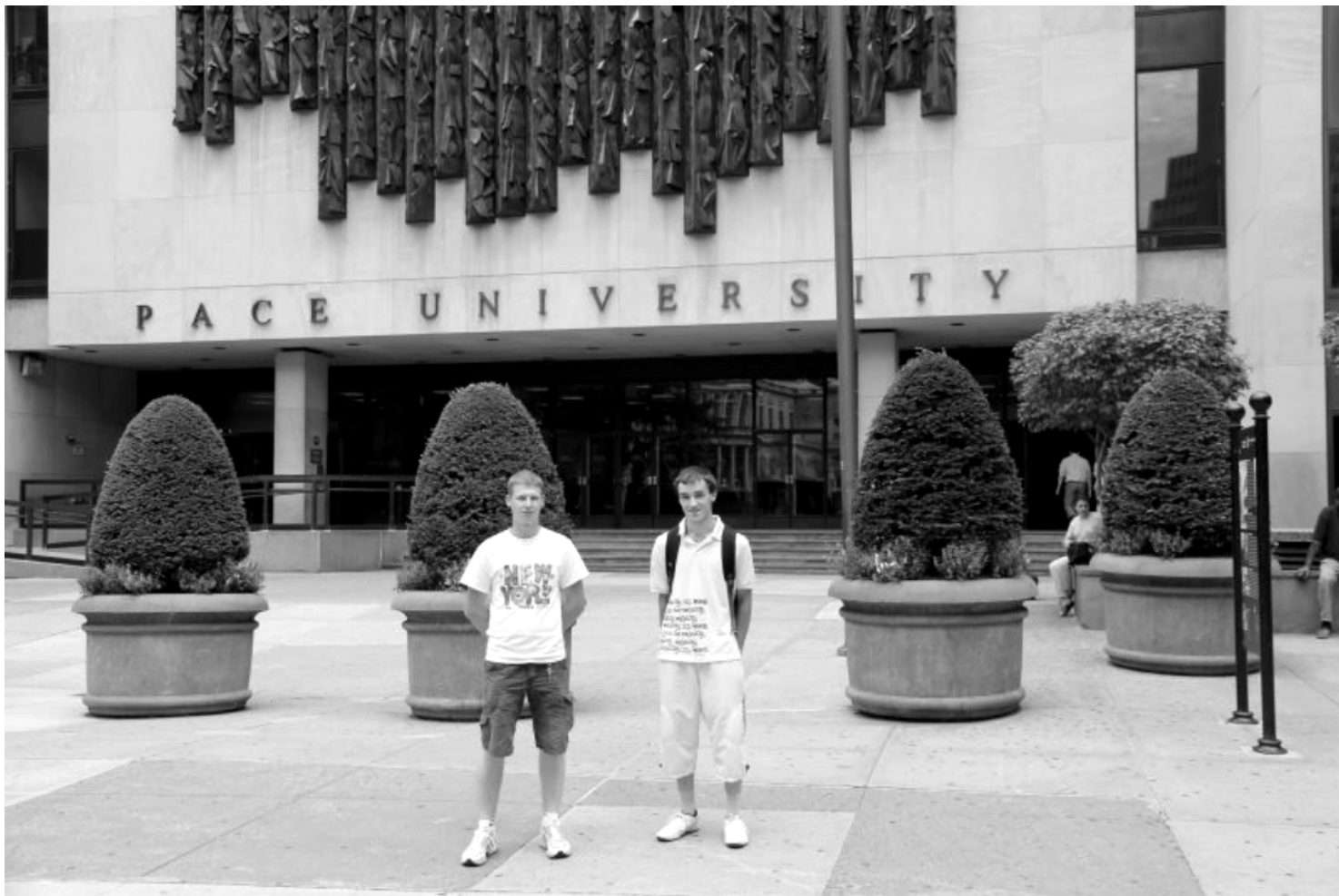
Fot; Pace University – jedna z najbardziej prestiżowych i najlepszych szkół w Nowym Jorku.

J estem wdzięczny osobom, które podejmują trud angażowania się w tak cenne inicjatywy, dla nas ludzi młodych. Mam nadzieję, że ich praca odmieni także moje życie.