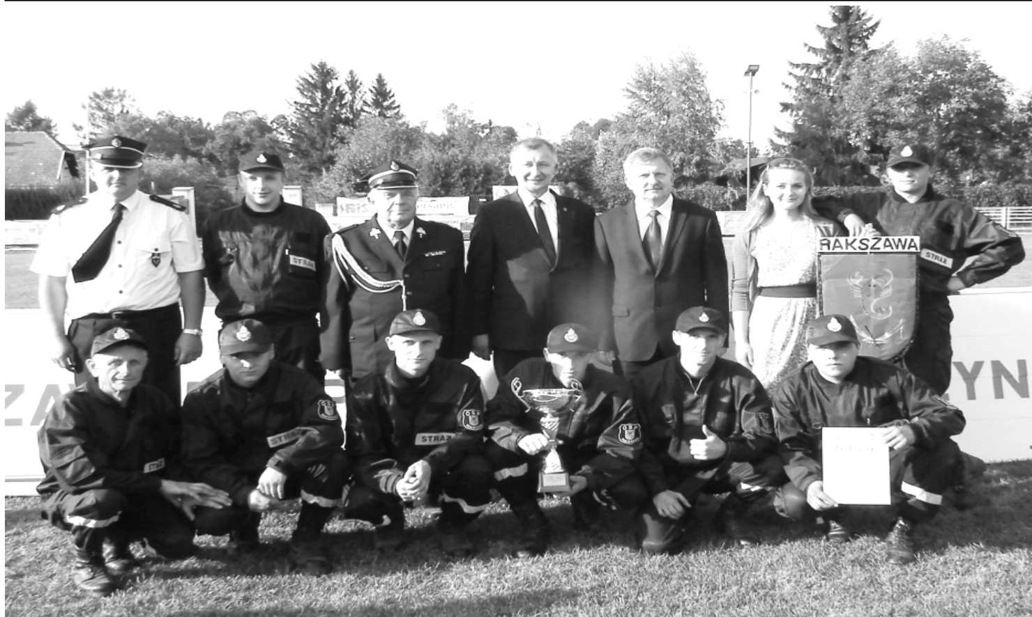
Fot; 1 miejsce-Męska Drużyna Pożarnicza- Ochotnicza Straż Pożarna w Rakszawie -Grupa A.