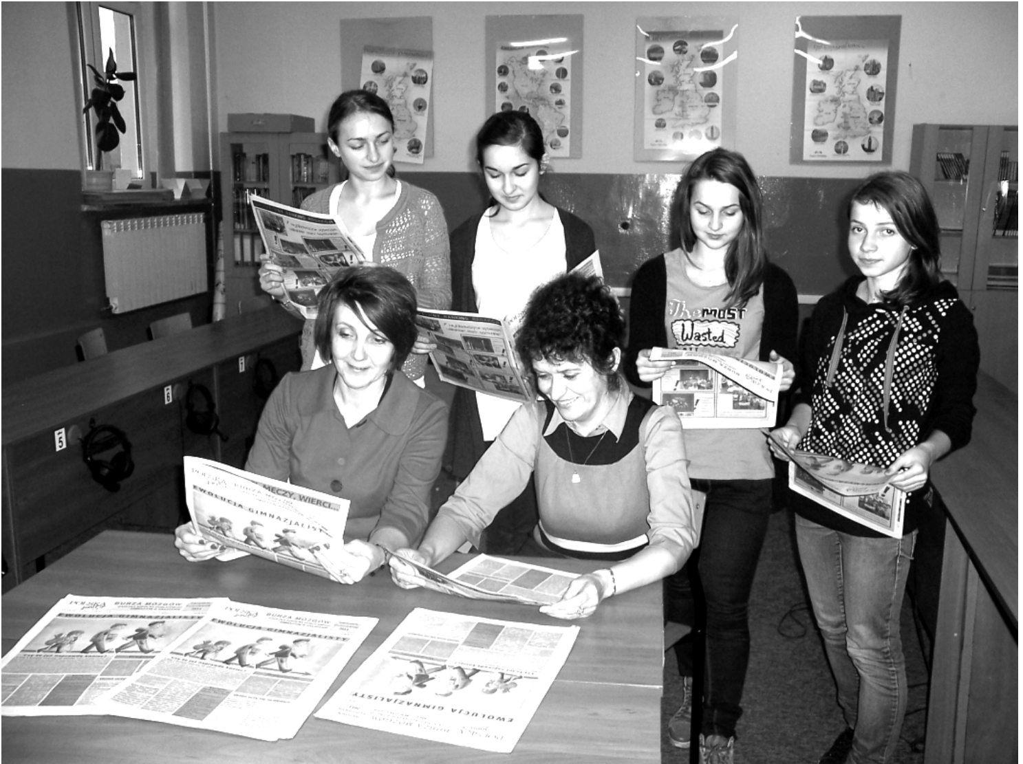
Fot; Dyrekcja Publicznego Gimnazjum w Rakszawie z redakcją gazetki „Burzy mózgow”.

W Publicznym Gimnazjum INTERBLOK jest realizowany w kl. 1 a, 1 c i 2 d. Do tej pory uczniowie między innymi wykonywali mapę hipsometryczną, wyznaczyli kierunek północny za pomocą zbudowanego przez siebie kompasu wodnego, wazyli różne przedmioty skonstruowaną przez siebie wagą (waga Leonardo Da Vinci) oraz badali substancje przewodzące prąd elektryczny. Dużym zainteresowaniem cieszyły się zajęcia poświęcone oznaczaniu zawartości skrobi w różnych produktach oraz „zabawy” cieczą nieniuetonowską.