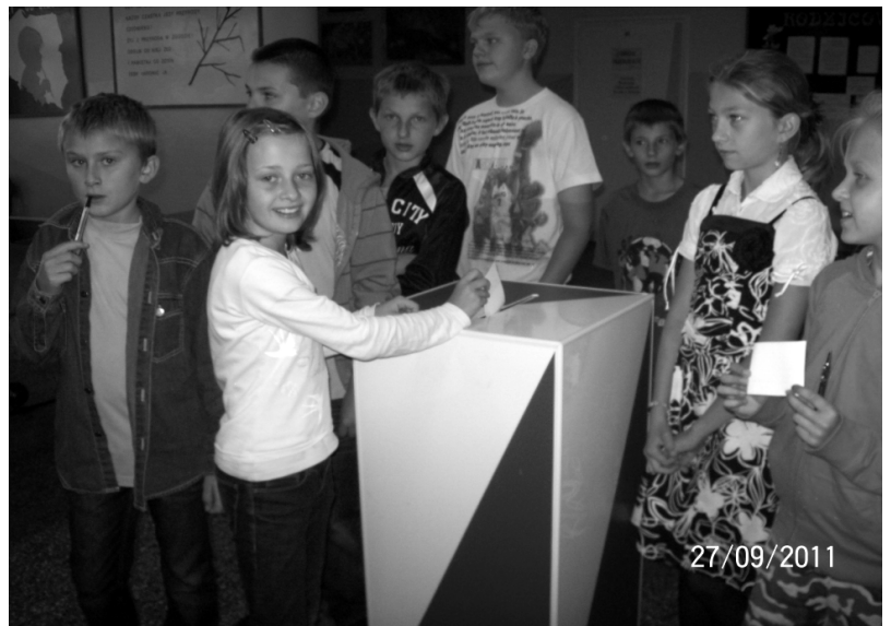
Fot; Wybory do Samorządu Uczniowskiego w SP 3 w Rakszawie.

Opr. Beata Babiarz nauczyciel języka polskiego w Szkole Podstawowej Nr 3 w Rakszawie