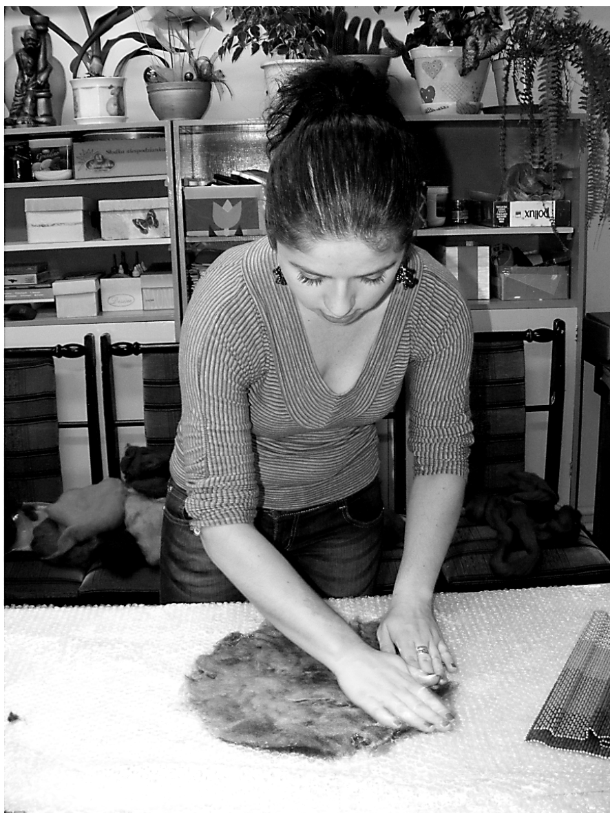
Fot; Kurs filcowania pod hasłem „Filc inspiruje”, fot. B. Skoczylas.