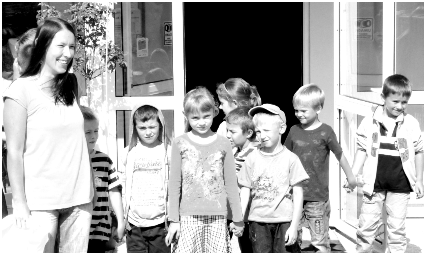
Fot; Oddział przedszkolny przy Szkole Podstawowej w Wydrzu.

W roku szkolnym 2011/2012 na wniosek rodziców i dzięki ich zaangażowaniu, obowiązek szkolny w klasie I podjęły dzieci 6-letnie i 7-letnie. Podjęcie przez dziecko obowiązku szkolnego jest ważnym etapem w jego życiu. Przechodzi ono z wieku przedszkolnego w wiek wczesnoszkolny i ulega zmianie podstawowa forma działalności dziecka. Gotowość dziecka do rozpoczęcia nauki w szkole, uzależniona jest od osiągnięcia odpowiedniego stanu rozwoju fizycznego, emocjonalno - społecznego i umysłowego, które to umożliwią sprostanie obowiązkowi szkolnym.