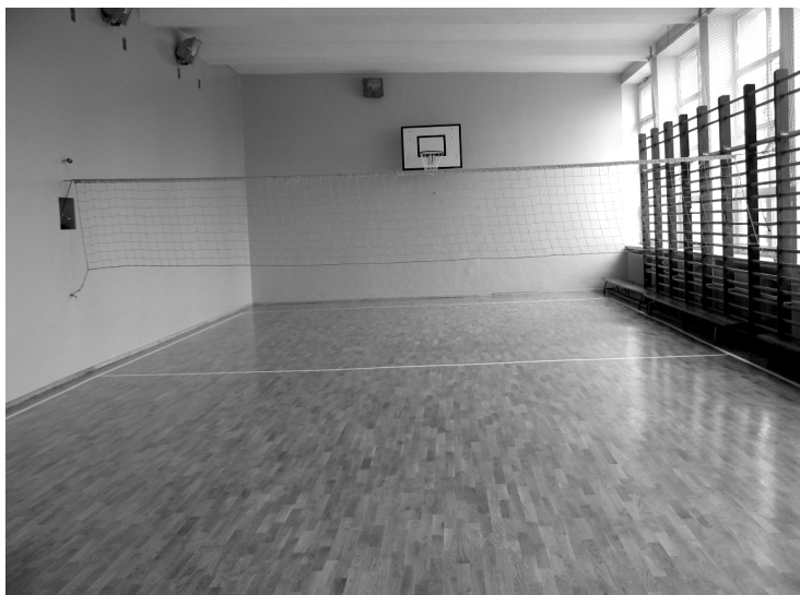
Fot; Przed remontem i po.....sala gimnastyczna w Szkole Podstawowej Nr 1 w Rakszawie.