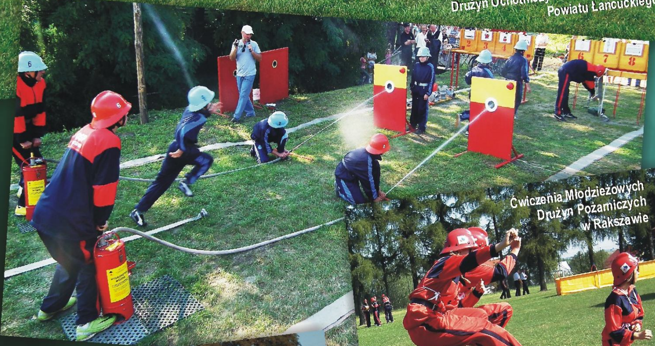
Cwiczenia Młodzieżowych Drużyn Pożarniczych w Rąkszawie