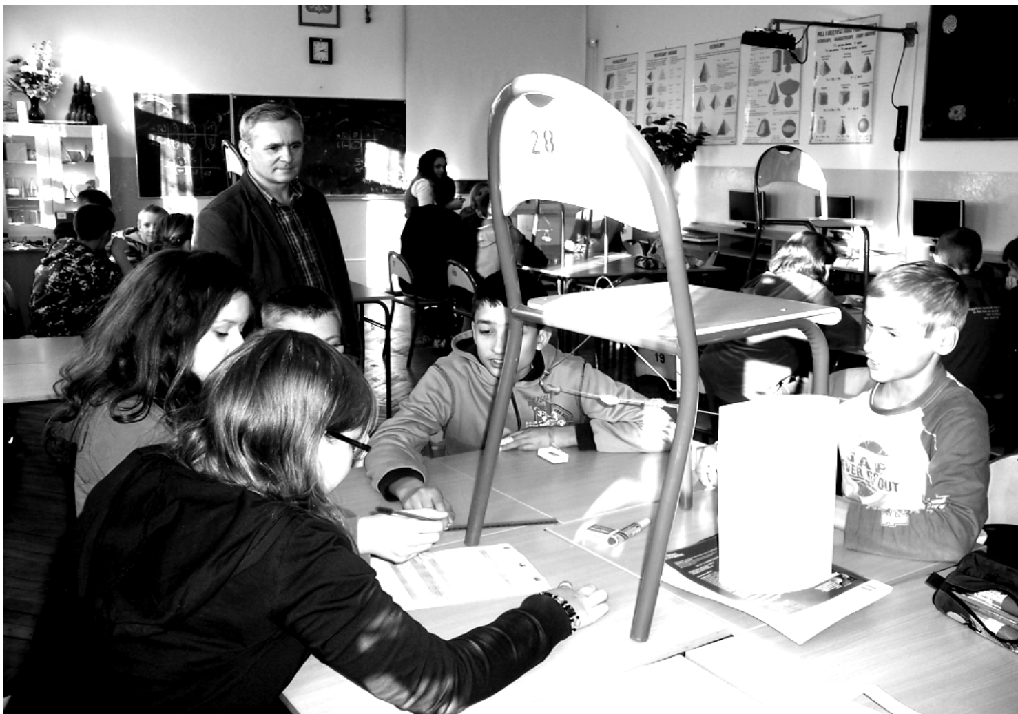
Fot; Waga Leonarda da Vinci.

W dniu 14 X 2011r odbył się Dzień Edukacji Narodowej . Samorząd Uczniowski przygotował program satyryczny pt. „W pokoju nauczycielskim”. Potem uczniowie i nauczyciele przeszli do kościoła, gdzie odbyły się obchody Dnia Papieskiego pod hasłem „Jan Paweł II – człowiek modlitwy”. Gimnazjum uczestniczyło w Mszy św. i obejrzało prezentację multimedialną przygotowaną przez księdza Grzegorza i księdza Dariusza poświęconą sylwetce błogosławionego Jana Pawła II.