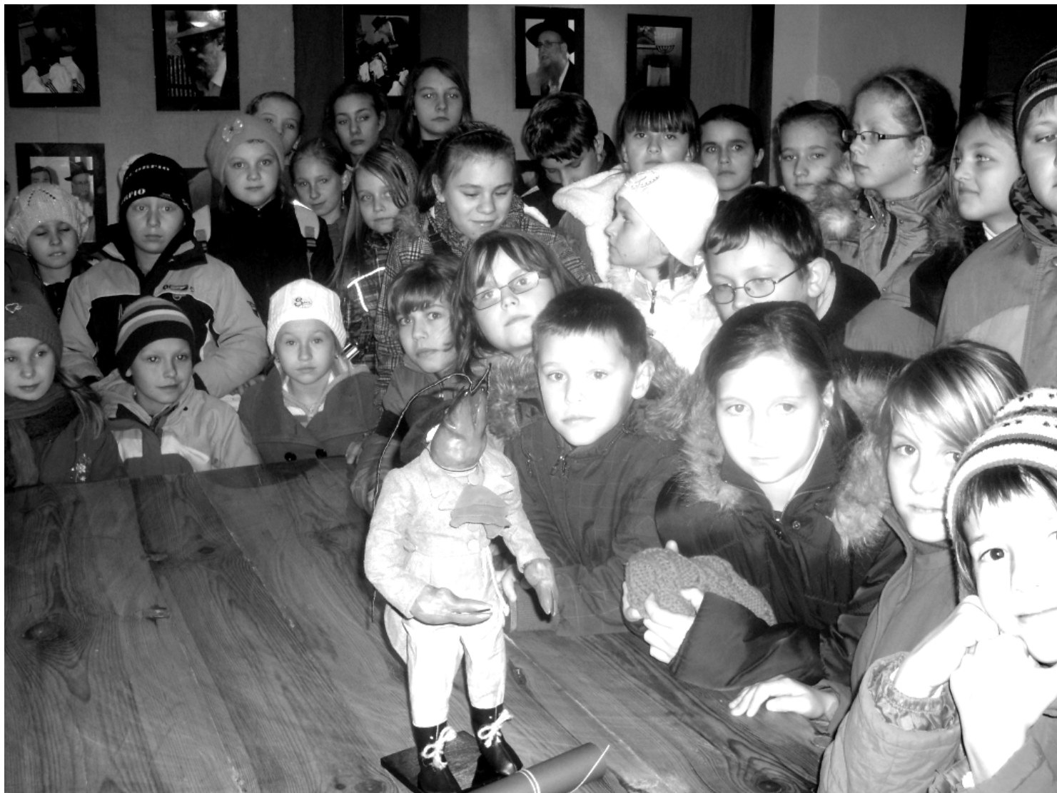
Fot; Postać Raka Szuwarka z „Legendy o powstaniu Rakszawy”.

R ok szkolny 2011/2012 to Rok Szkoły z Pasją. Podejmowane działania w ramach akcji mają na celu zapewnienie odpowiedniego do potrzeb i możliwości, rozwoju każdego ucznia. Szkoła Podstawowa Nr 2 w Rakszawie to nie tylko lekcje, ale także rozwijanie w dzieciach naturalnej ciekawości i chęci poznawania świata. Uczy kultury, życzliwości dla ludzi i tolerancji oraz wiary we własne możliwości intelektualne, artystyczne bądź sportowe. W pracy z dziećmi bierzemy pod uwagę zróżnicowane potrzeby i zdolności uczniów, dążąc do zapewnienia optymalnych warunków rozwoju każdemu z nich. Nasza placówka zapewnia wysoki poziom przekazywanej wiedzy, indywidualne podejście do każdego dziecka oraz ciekawe i zróżnicowane zajęcia pozalekcyjne.