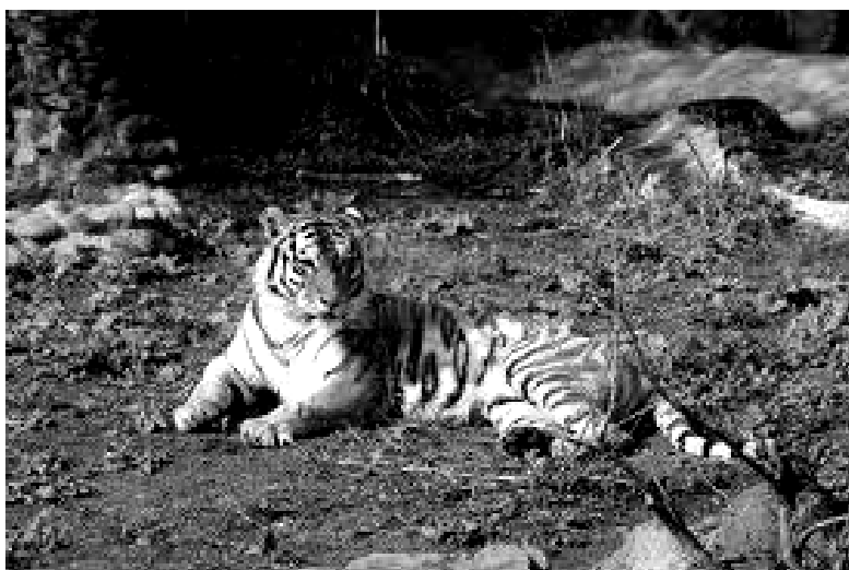
Fot; Tygrys amurski w ZOO w Zamościu.