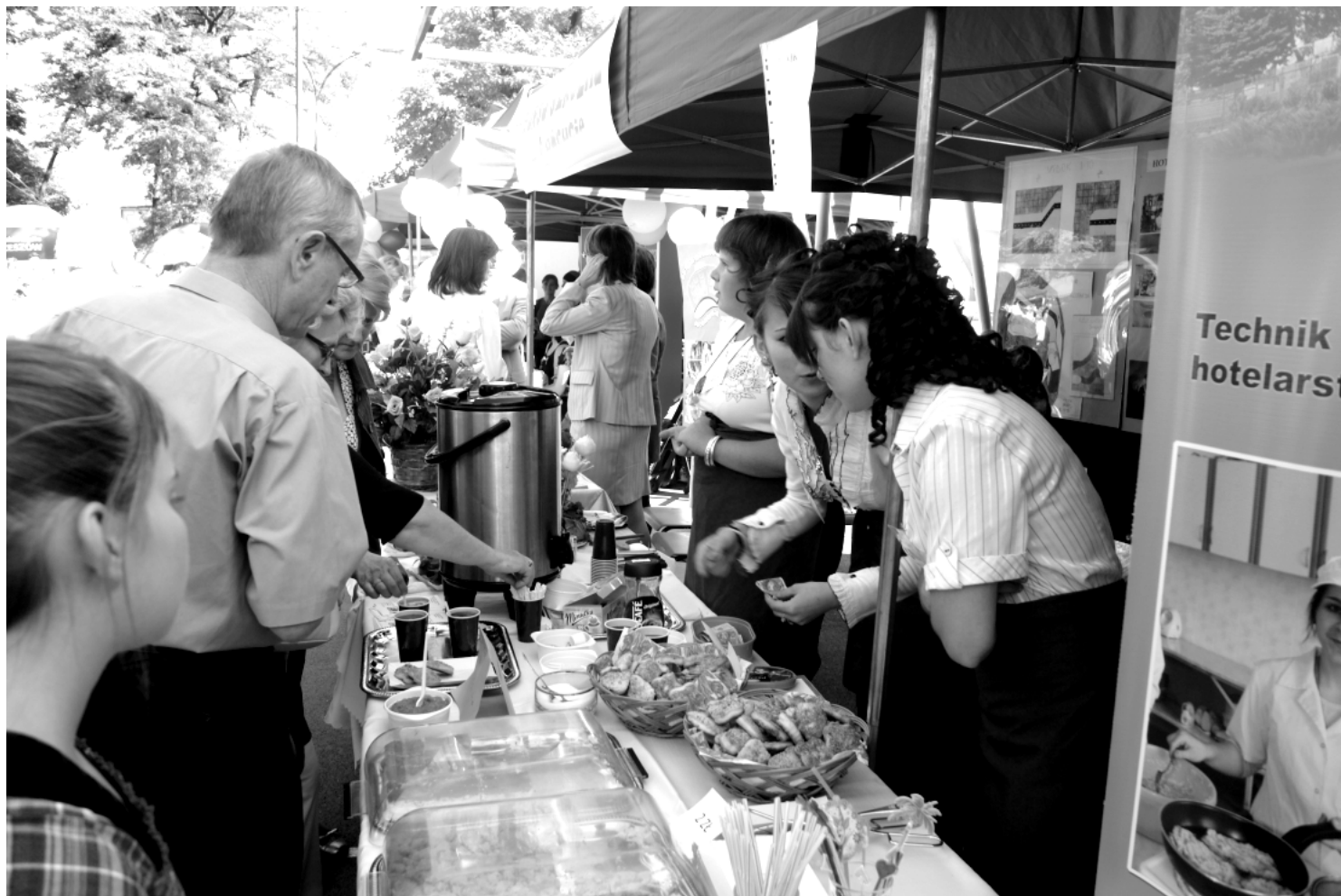
Fot.; Zespół Szkół Tekstylno – Gospodarczych w Rakszawie na Powiatowym Pikniku Rodzinnym w Łańcucie.

J ak co roku Zespół Szkół Tekstylno – Gospodarczych w Rakszawie brał czynny udział w obchodach Dni Powiatu Łańcuckiego. W niedzielę 25 września prezentowaliśmy się na Powiatowym Pikniku Rodzinnym połączonym z Jarmarkiem Świętego Michała w Łańcucie z Polskim Radiem Rzeszów. Nasze uczestnictwo poprzedzone było licznymi przygotowaniami w szkole.