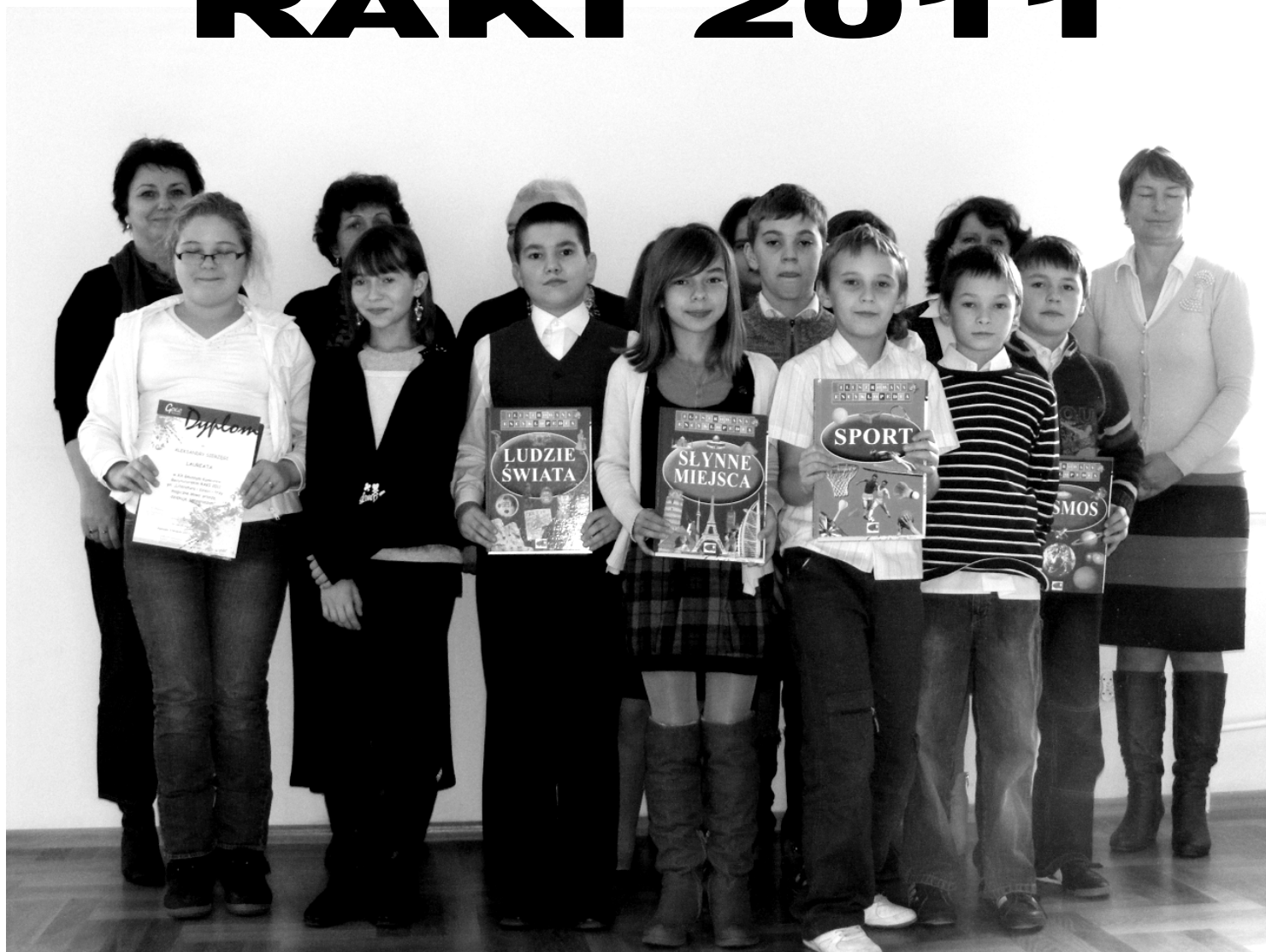
Fot; Laureaci XX Gminnego Konkursu Recytatorskiego RAKI 2011 „Literatura i Dzieci – Trzy Magiczne Słowa: proszę, dziękuję, przepraszam”.

W dniu 9 listopada 2011r. w Sali Wystawowej Gminnego Ośrodka Kultury i Czytelnictwa w Rakszawie odbył się XX Gminny Konkurs Recytatorski RAKI 2011 „Literatura i Dzieci – Trzy Magiczne Słowa: proszę, dziękuję, przepraszam”.