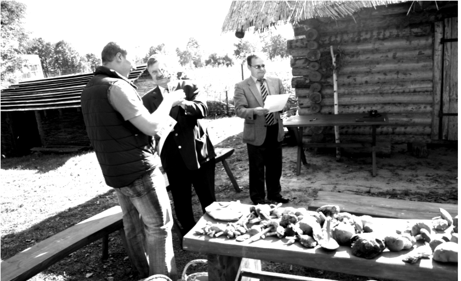
Fot; Wręczanie nagród w ramach IV Powiatowych Międzyszkolnych Zawodów w Grzybobraniu.

O rganizatorzy we wcześniej dostarczonym do szkół regulaminie podali wszystkie szczegóły związane z przebiegiem współzawodnictwa. Równo o godz. 7.00 rozpoczęto rywalizację w wyznaczonym odcinku lasu w Harasiukach. Wyznaczono również 4 godziny czasu na zgromadzenie zbiorów.