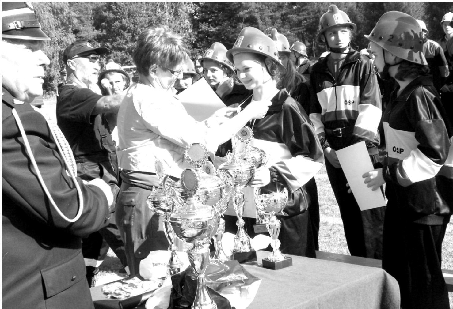
Fot; Gminne Zawody Sportowo-Pożarnicze w Rakszawie w dniu 21 sierpnia 2011r.

W dniu 18 września 2011r. (niedziela) na Stadionie MOSiR w Łąncucie odbyły się VI Powiatowe Zawody Sportowo-Pożarnicze Drużyn Ochotniczych Straży Pożarnych powiatu łańcuckiego .