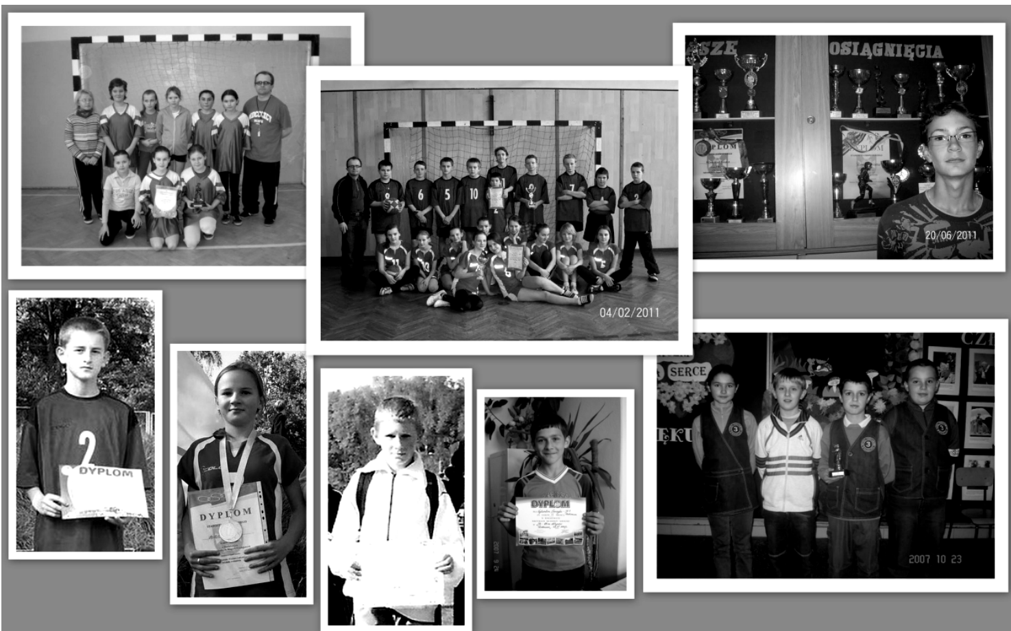
Fot.; Absolwenci i uczniowie Szkoły Podstawowej Nr 3 w Rakszawie, którzy osiągają wysokie wyniki w dyscyplinach sportowych.

Opr. mgr Wiesław Wawrzaszek nauczyciel wychowania fizycznego Szkoły Podstawowej Nr 3 w Rakszawie