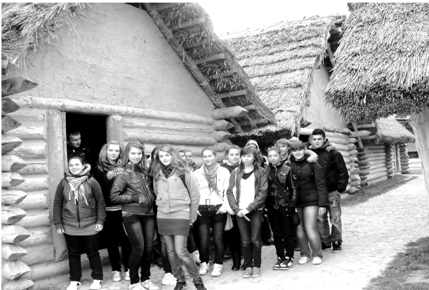
Fot; Młodzież Gimnazjum w Rakszawie w Karpackiej Troi.

W ramach programu INTERBLOK uczniowie odbywają 90 minutowe zajęcia badawcze z zakresu przedmiotów matematycznoprzyrodniczych tzw. bloki. W pierwszym roku uczniowie wykonują eksperymenty naukowe wg. przygotowanych instrukcji, w drugim otrzymują do rozwiązania problemy badawcze, sami dobierają metodę rozwiązania problemu i ją realizują. Natomiast w trzecim roku uczniowie stają się konstruktorami – projektują oraz budują prototypy urządzeń spełniające określone normy. Podczas każdego zajęcia uczniowie uczą się także przedsiębiorczości, kalkulują koszty pomocy naukowych oraz rozliczają osobogodziny pracy, biorą udział w grze ekonomicznej, a ich działania są wspierane portalem edukacyjnym.