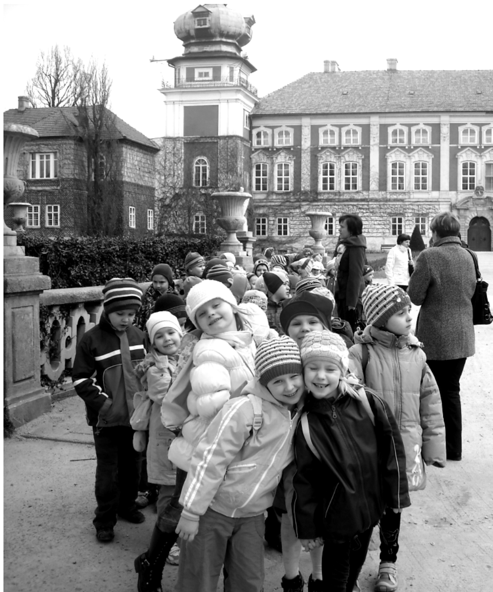
Fot: Przedszkolaki z Przedszkola Nr 1 w Rakszawie.

D latego korzystanie z podręczników, zeszytów i kart pracy w przedszkolu ma stanowić jedynie uzupełnie-