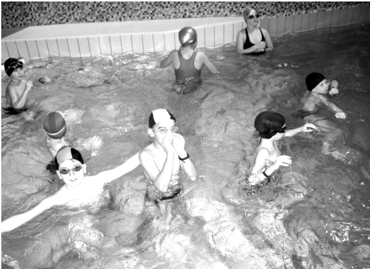
Fot; „W zdrowym ciele zdrowy duch”- zajęcia na basenie w Łańcucie.

W rozpoczętym nowym roku szkolnym 2011/2012 Szkoła Podstawowa w Węgliskach poszerzyła ofertę edukacyjną o zajęcia na basenie w Łańcucie. Działając w myśl zasady w „zdrowym ciele zdrowy duch” staramy się dbać nie tylko o rozwój intelektualny naszych uczniów, ale także o ich sprawność fizyczną i dobrą kondycję ciała. Uczniowie podzieleni są na dwie grupy wiekowe: młodszą (klasy I – III) i starszą (klasy IV – VI). Zajęcia na krytej pływalni w Łańcucie odbywają się w każdy wtorek.