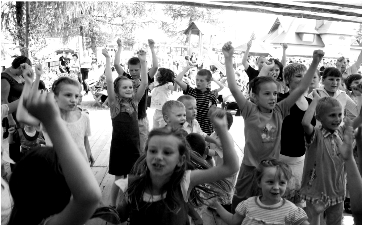
Fot; II Festyn Rodzinny „Mama, Tata, Ja i ...”

Uczniowie SP 3 mogą rozwijać swoje zainteresowania dzięki różnorodnym zajęciom pozalekcyjnym, a także udziałem w realizacji nowych programów innowacyjnych.