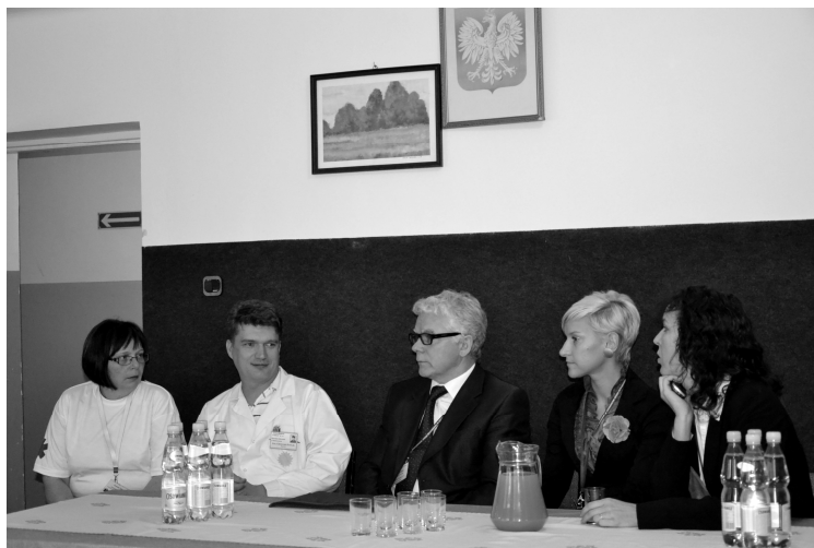
Fot; Delegaci z Ministerstwa Obrony Narodowej, Ministerstwa Zdrowia, Urzędu Wojewódzkiego w Rzeszowie.