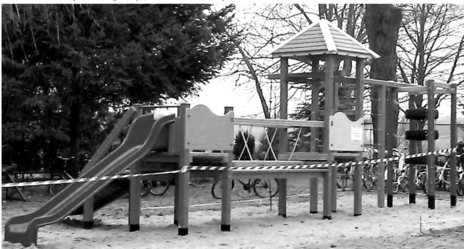
Fot; Element placu zabaw przy Szkole Podstawowej w Wydrzu.