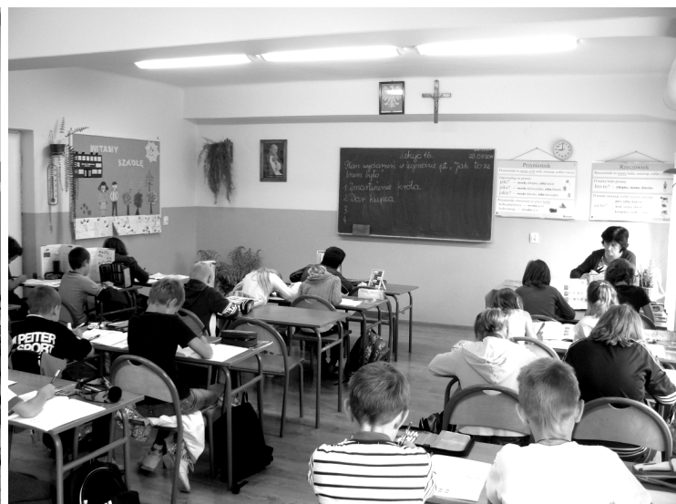
Fot; Przed remontem i po.....sala lekcyjna w Szkole Podstawowej Nr 1 w Rakszawie.