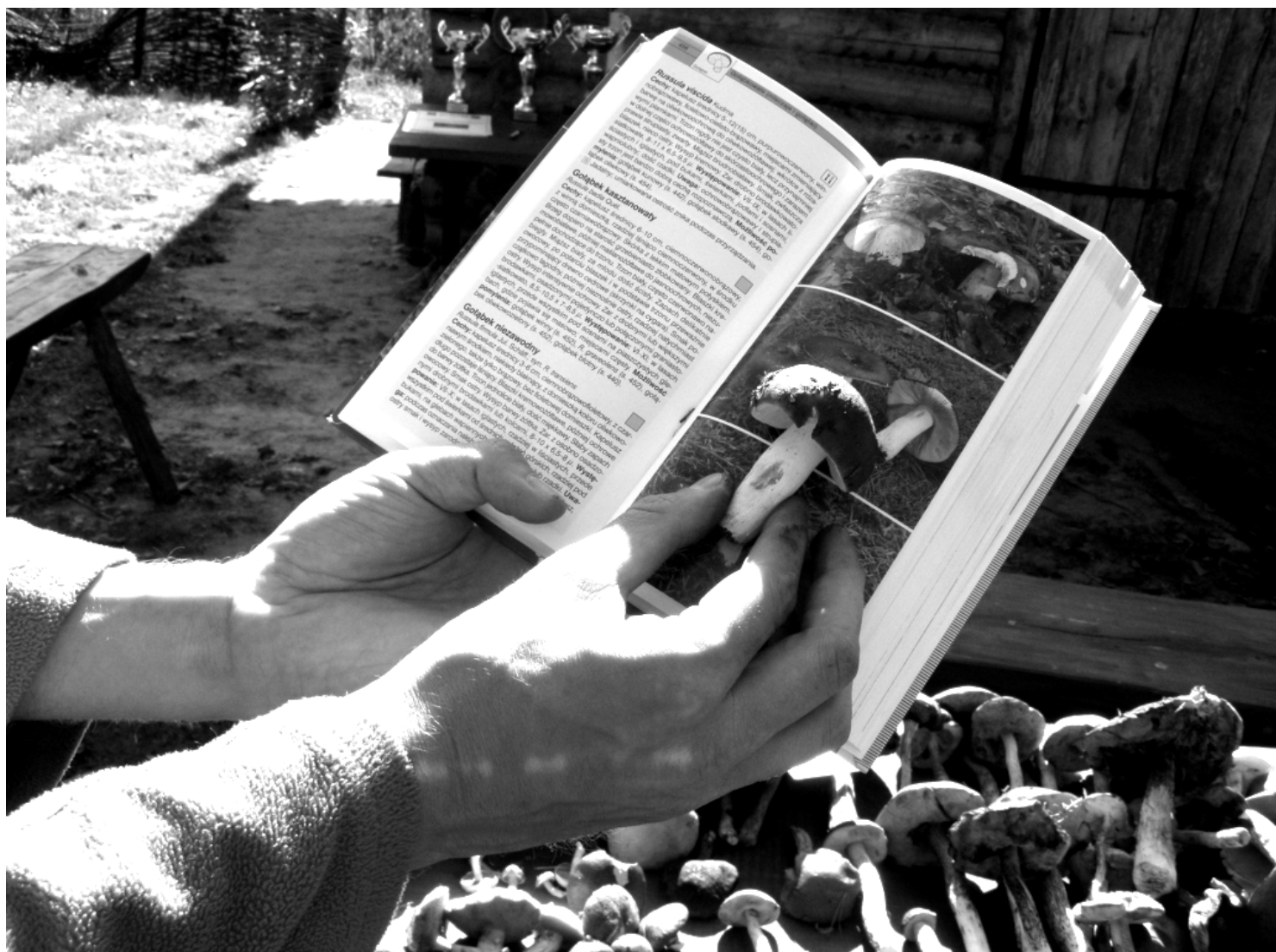
Fot.; IV Powiatowe Międzyszkolne Zawody w Grzybobraniu w Gminie Rakszawa.