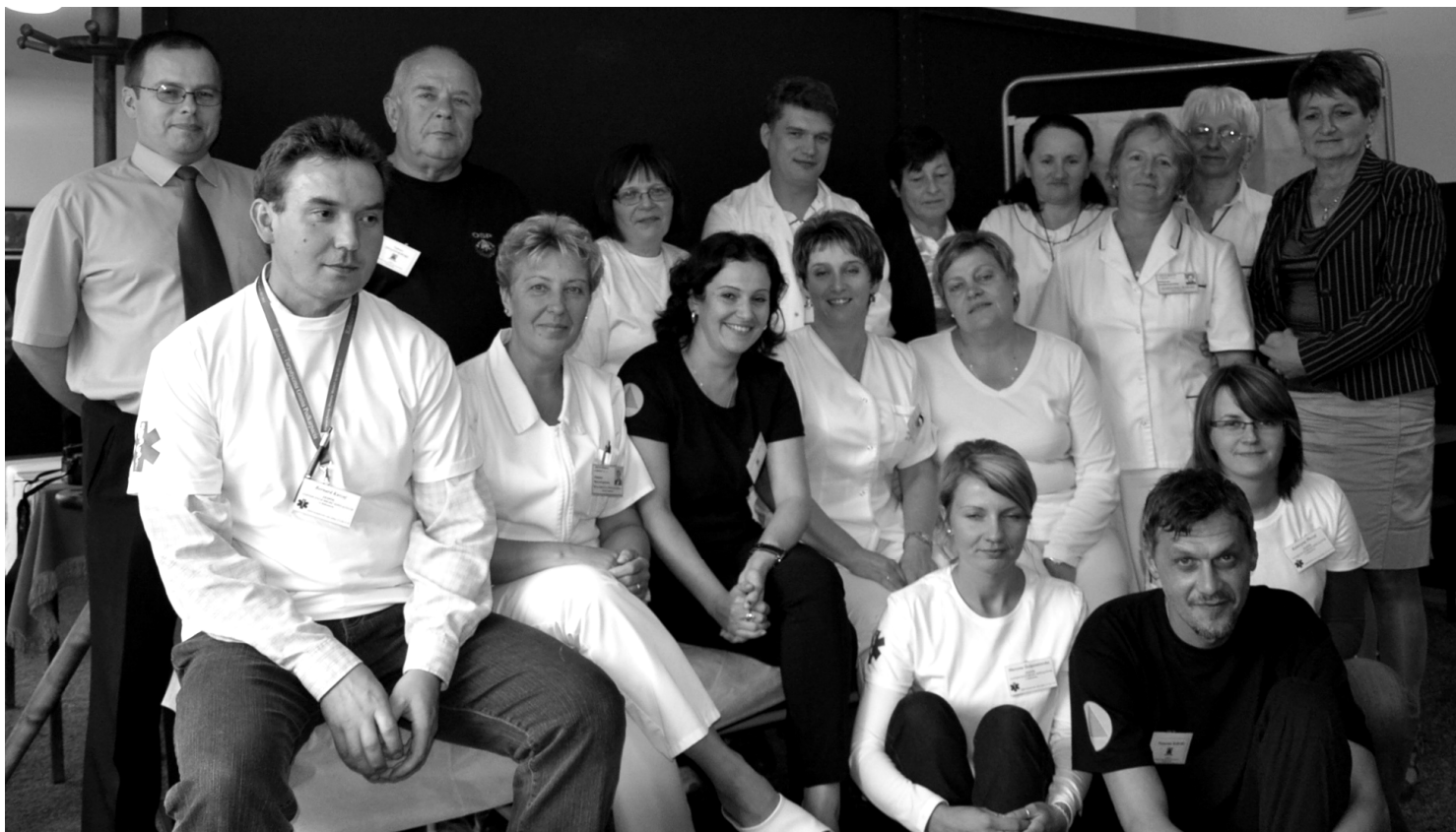
Fot; Zespół Zastępczych Miejsc Szpitalnych w Rakszawie.

W dniach 19 – 21 września br. na terenie Gminy Rakszawa odbyły się ćwiczenia obronne, realizowane jako jedno z ogniw wojewódzkich ćwiczeń kompleksowych „BIESZCZADY 2011”.