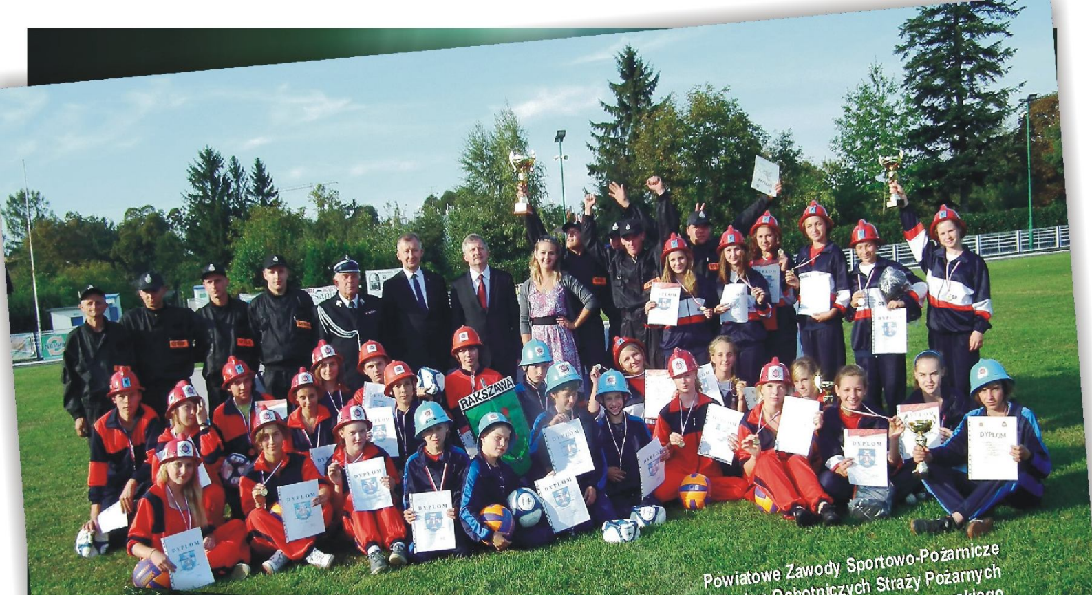
Powiatowe Zawody Sportowo-Pożarnicze Drużyn Ochotniczych Straży Pożarnych Powiatu Łancuckiego