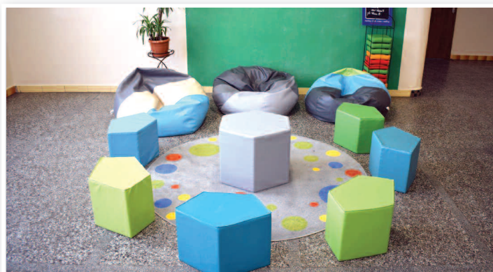
Utworzenie kąjka relaksu w Szkole Podstawowej nr 3 w Rakszawie