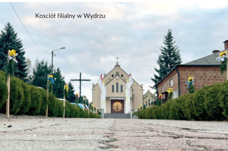
Kościół filialny w Wydrzu