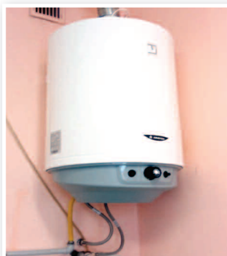
Montaż nowego podgrzewacza wody w szkole Podstawowej w Węgliskach