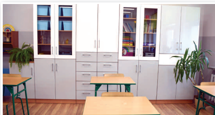
Zakup nowych mebli do dwóch sal lekcyjnych w Szkole Podstawowej nr 3 w Rakszawie