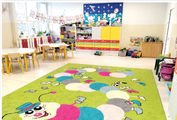
Zaadaptowanie nowej sali przedszkolnej dla VII grupy - Wiewiórki wraz z wyposażeniem oraz remont łazienki dla dzieci w ZSPIP nr 1 w Rakszawie