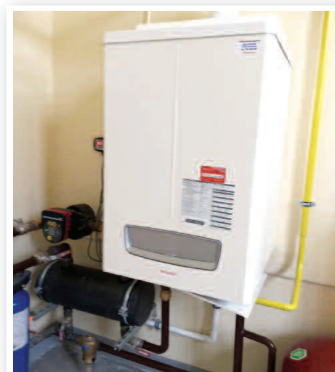
Wymiana pieca centralnego ogrzewania i remont kotłowni w SP Wydrze