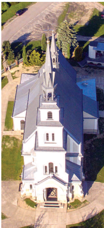
Kościół pw. Podwyższenia Krzyża Świętego w Rakszawie

To już pięćdziesiąta czwarta parafia na trasie peregrynacji. Dzień wcześniej 13 listopada wizerunek NSPJ nawiedził Parafię pw. NMP Matki Kościoła w Rakszawie Górnej i kościół filialny w Wydrzu.