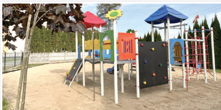
Modernizacja placu zabaw przy Szkole Podstawowej nr 2 w Rakszawie