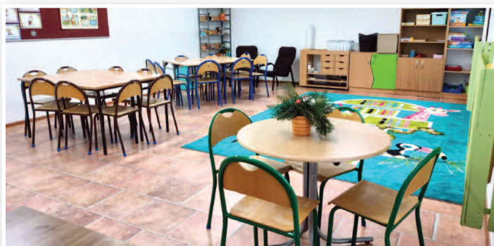
Utworzenie nowej sali świetlicowej w ZSPIP nr 1 w Rakszawie