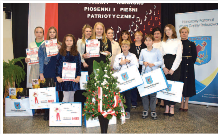
V Gminny Konkurs Piosenki i Pieśni Patriotycznej, SP 3, 4.11.2022 .