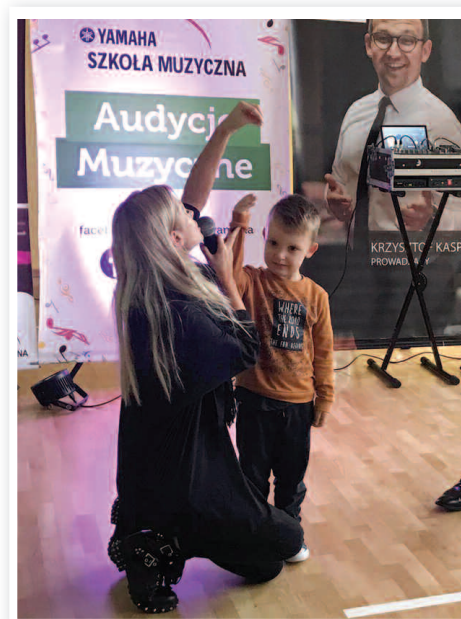
Audycja Muzyczna Yamaha - ZSPiP nr 1 w Rakszawie