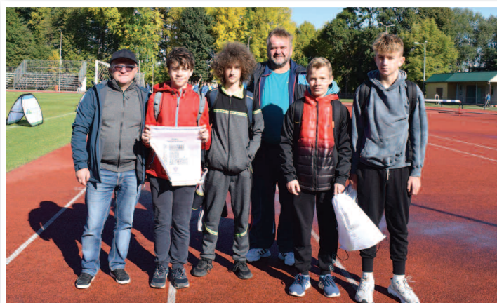
Finał Wojewódzkich Igrzysk Młodzieży Szkolnej klasy VII-VIII oraz Igrzysk Dzieci klasy IV-VI, Kolbuszowa, 28-29.09.2022 r.