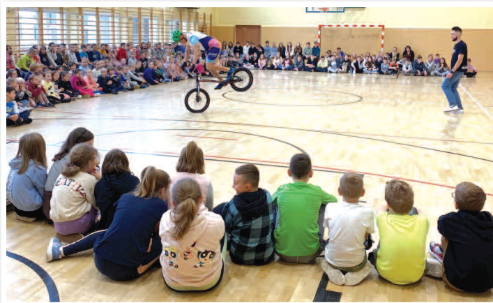
Warsztaty „Szkółka z Pasją”, SP 1, 19.10.2022 r.