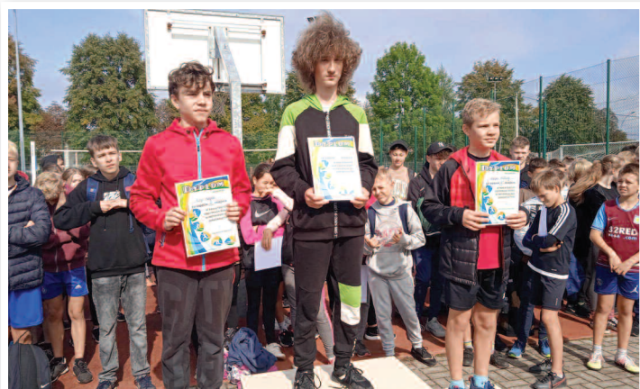
Finał Powiatowych Igrzysk Młodzieży Szkolnej klasy VII-VIII oraz Igrzysk Dzieci klasy IV-VI, Białobrzegi, 27.09.2022 r.