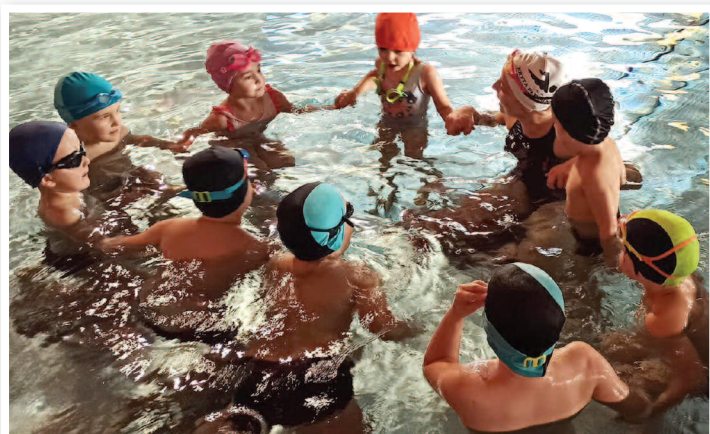
Zajęcia na basenie - SP Węglińska