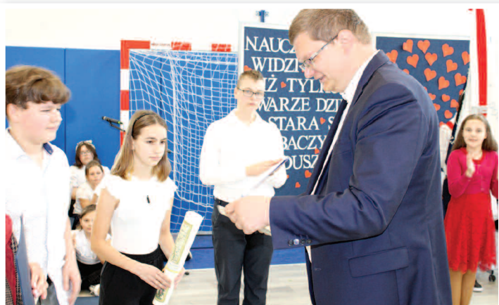
Dzień Nauczyciela - SP nr 2 w Rakszawie