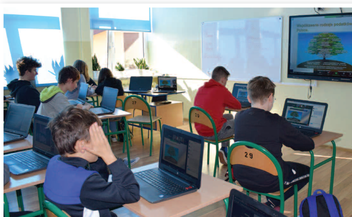
Warsztaty ekonomiczne - SP nr 3 w Rakszawie