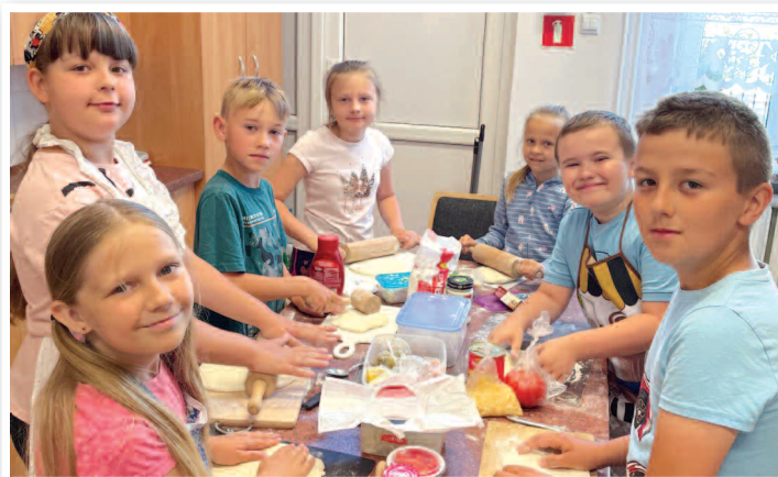
Warsztaty kulinarne „Dbam o zdrowie bo zdrowo jem”, SP 3, 5.10.2022 r.