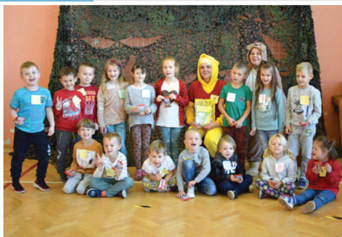
Urodziny Kubusia Puchatka - SP nr 3 w Rakszawie