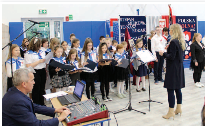
Święto Odzyskania Niepodległości i Dzień Patrona - SP nr 2 w Rakszawie