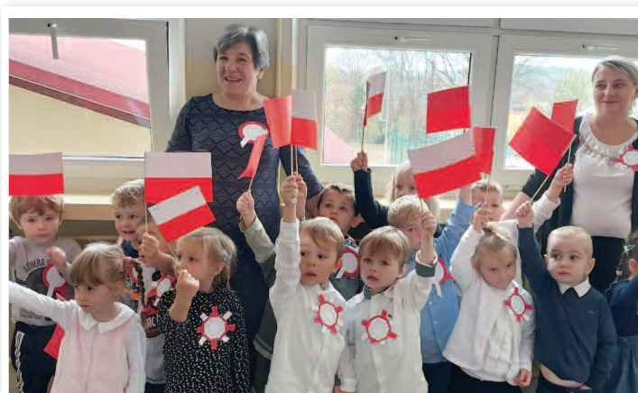
Przedszkolaki śpiewają Mazurka Dąbrowskiego - ZSPiP nr 1 w Rakszawie