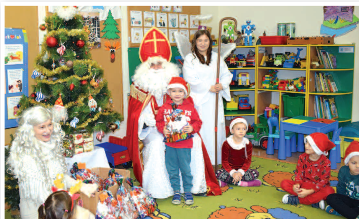
Wizyta św. Mikołaja - SP3 w Rakszawie