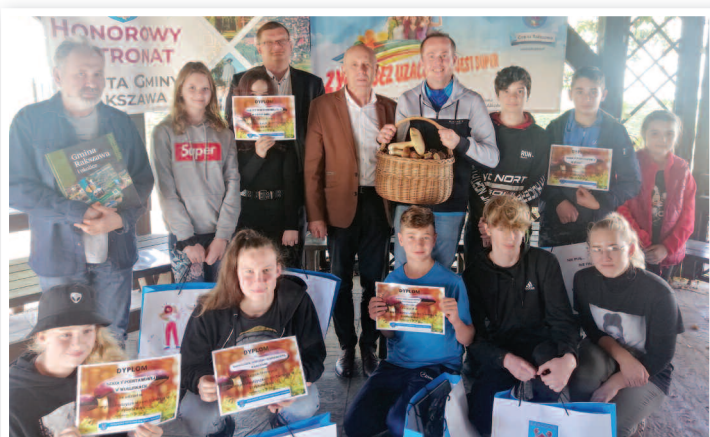
Gminny Międzyszkolny Turniej w Grzybobranii, SP 1, 18.10.2022 r.