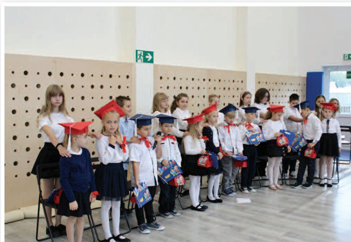
Pasowanie na Ucznia - SP nr 2 w Rakszawie