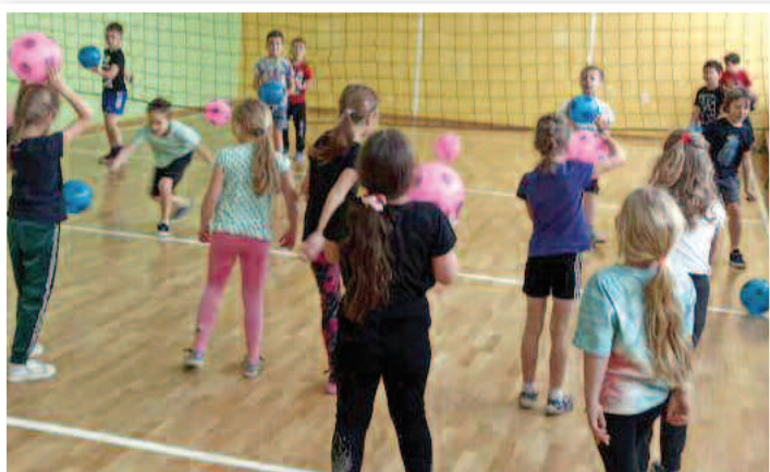
„Akademia Małych Zdobywców”- ZSPiP nr 1 w Rakszawie