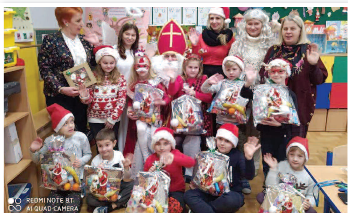
Wizyta św. Mikołaja - SP nr 2 w Rakszawie