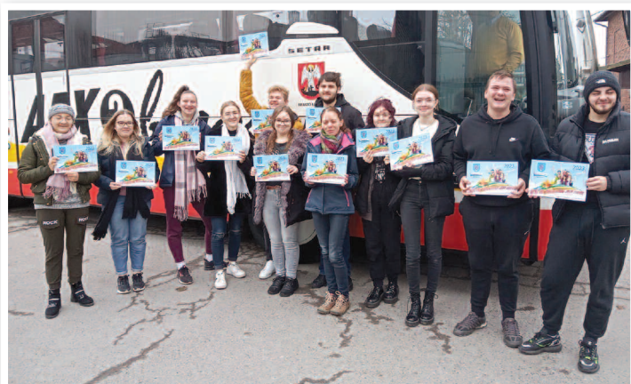
Warsztaty integracyjno-profilaktyczne w Bochni, ZSTG, 29.11.2022 r.