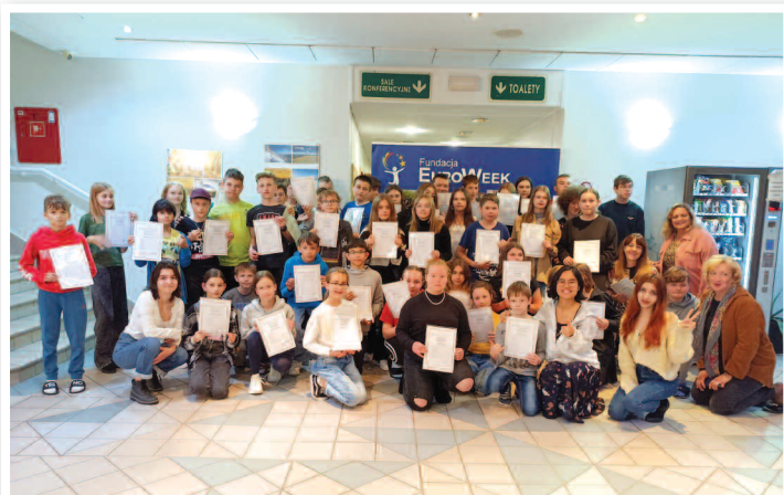
Projekt szkoleniowy „Euro Week-Szkoła Liderów”, SP2 i SP3, 5-9.09.2022 r.