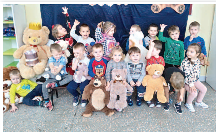
Dzień Pluszowego Misia - ZSPiP nr 1 w Rakszawie