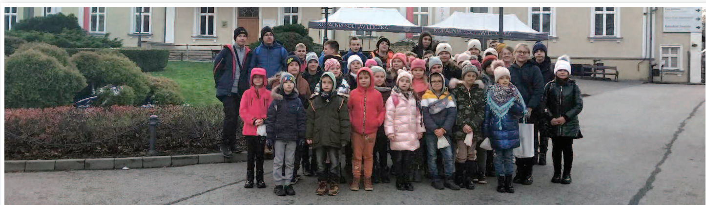
Wycieczka do kopalni soli w Wieliczce - SP Wydrze