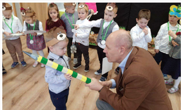
Pasowanie na Przedszkolaka - ZSPiP nr 1 w Rakszawie