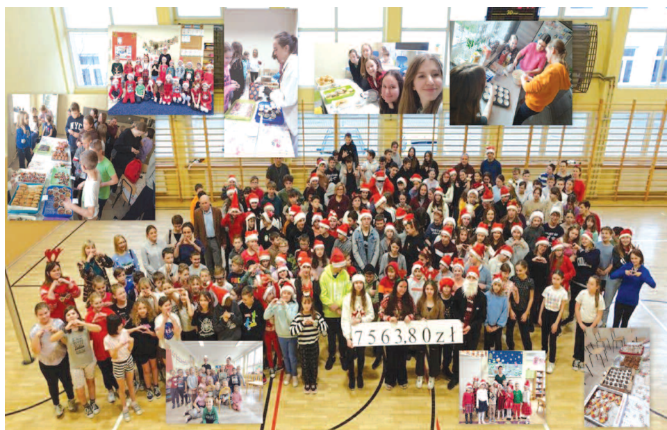
Akcje charytatywne w ZSPiP nr 1 w Rakszawie

Nasze szkoły i przedszkola to prawdziwi tytani pracy, tylko w okresie od października do grudnia 2022 roku odbyło się w nich kilkadziesiąt wydarzeń. Serdecznie dziękuję nauczycielom, rodzicom, obsłudze administracyjnej za ogrom pacy.