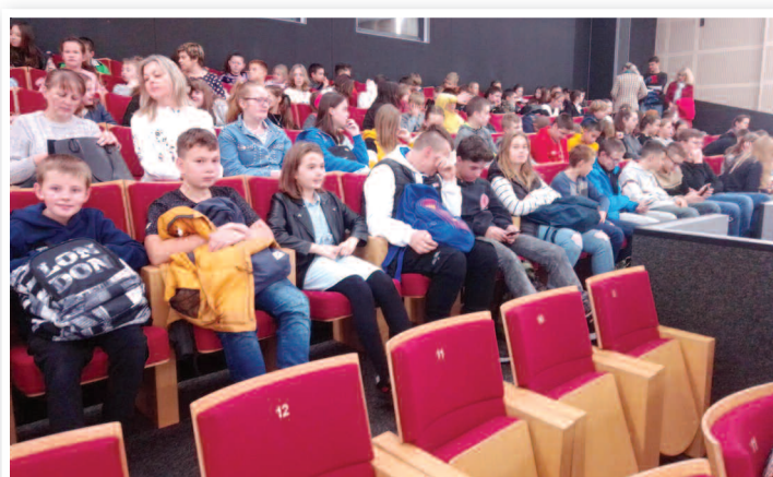
Musical „Mały Książę”, SP Węglika, 13.10.2022 r.