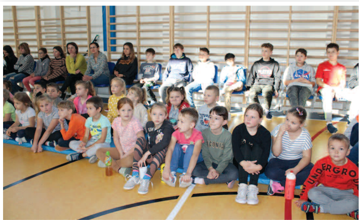
Warsztaty „Szkółka z Pasją”, SP 2, 21.10.2022 r.