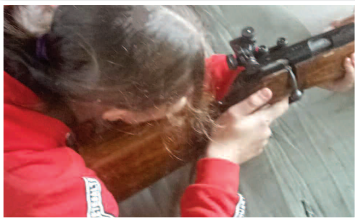
Warsztaty sportowe w strzelectwie dla SP 2 i SP Węglicka, Żoźnia - 24.10.2022 r.